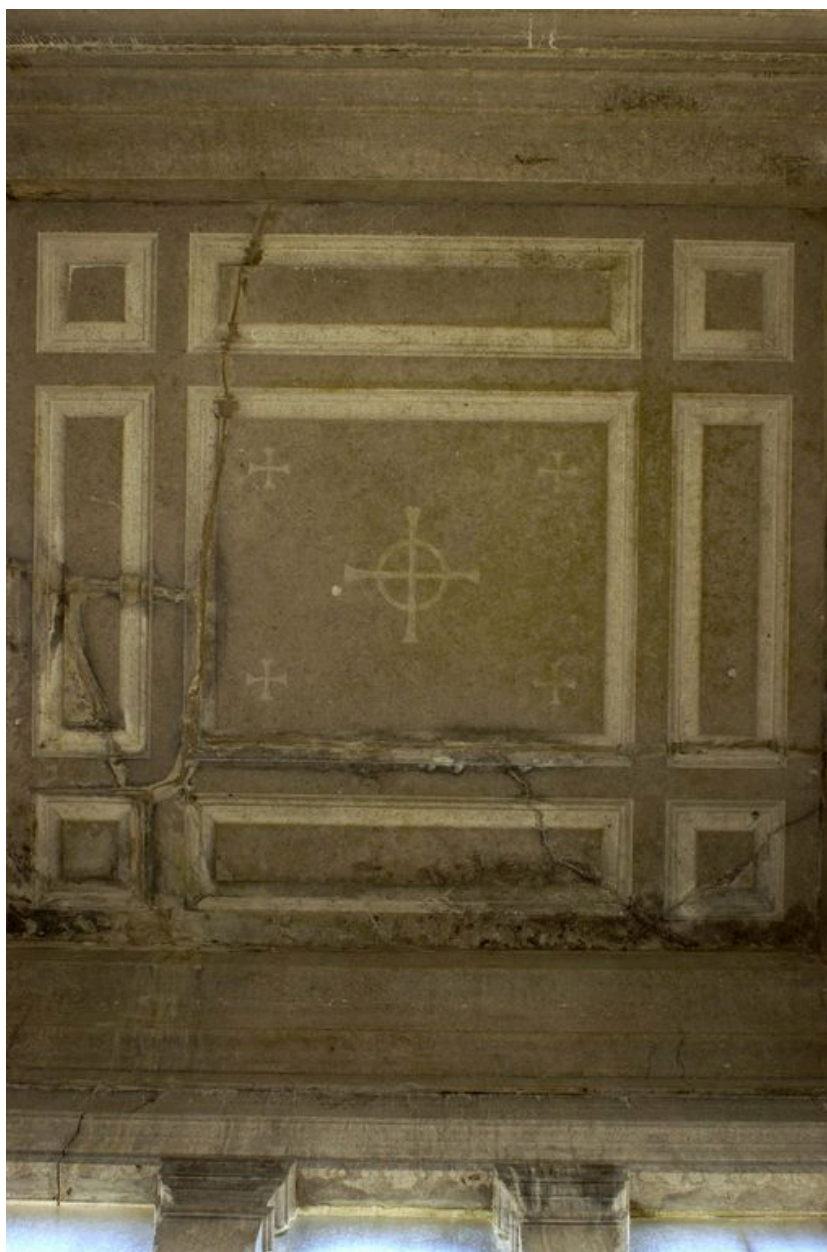
Vue intérieure, détail sur le plafond.