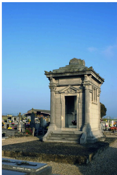
Vue générale. IVR22_20058000011NUCA