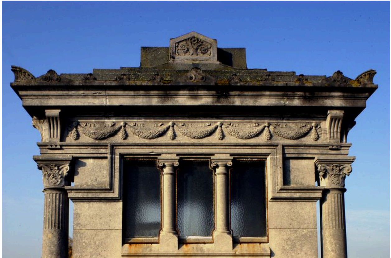
Vue de détail sur la fenêtre est.