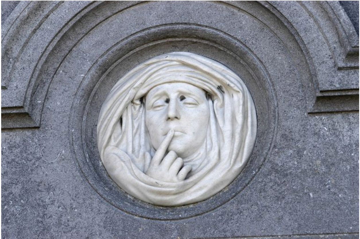
Vue de détail sur le relief en marbre (mur nord).