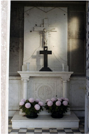
Vue intérieure. IVR22_20058000012NUCA