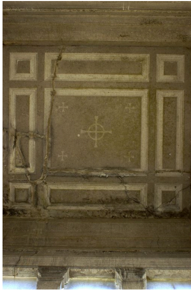
Vue intérieure, détail sur le plafond.