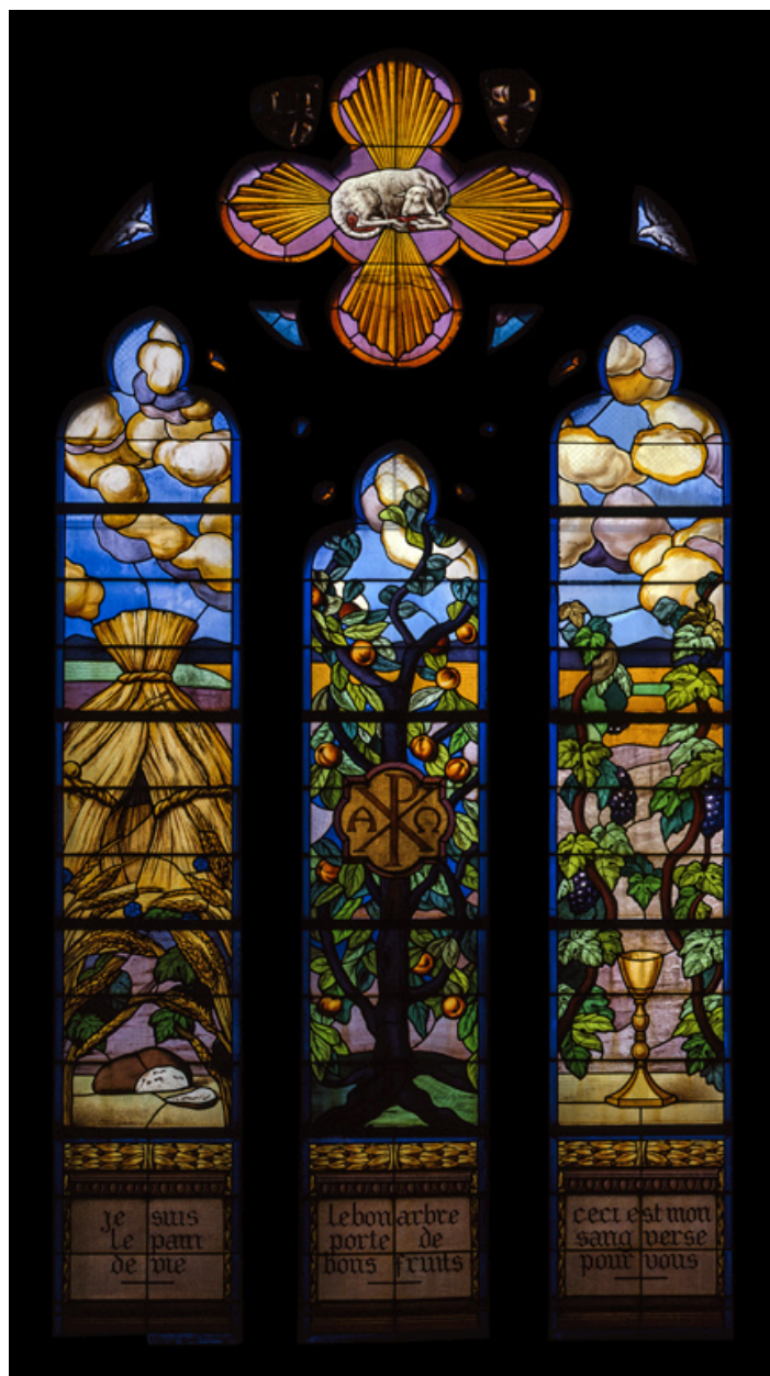
Baie 0 : l'arbre de vie, oeuvre de David Burnand, 1924.