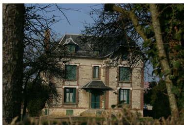
Vue du logis. IVR22_20030202894NUCA