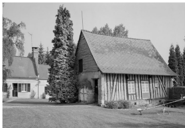
Logis et grange. Vue générale. IVR22_19856000882X

IVR22_20096000195NUCA