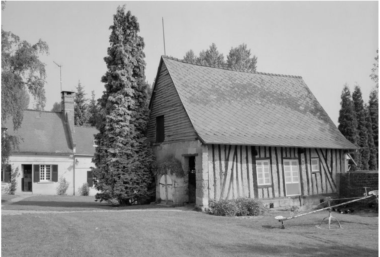
Logis et grange. Vue générale.