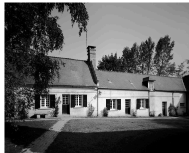
Logis.