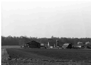
Vue de situation. IVR22_19856000581X