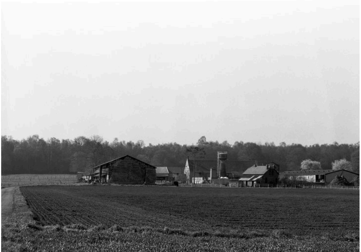
Vue de situation.