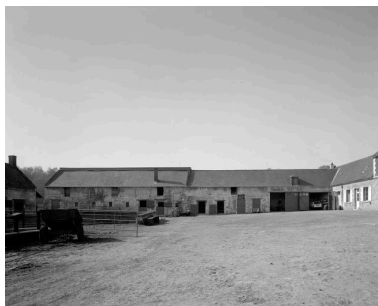
Porcherie, étable à chevaux, depuis la cour. IVR22_19856000578V