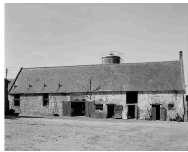
Grange, élévation antérieure. IVR22_19856000577V