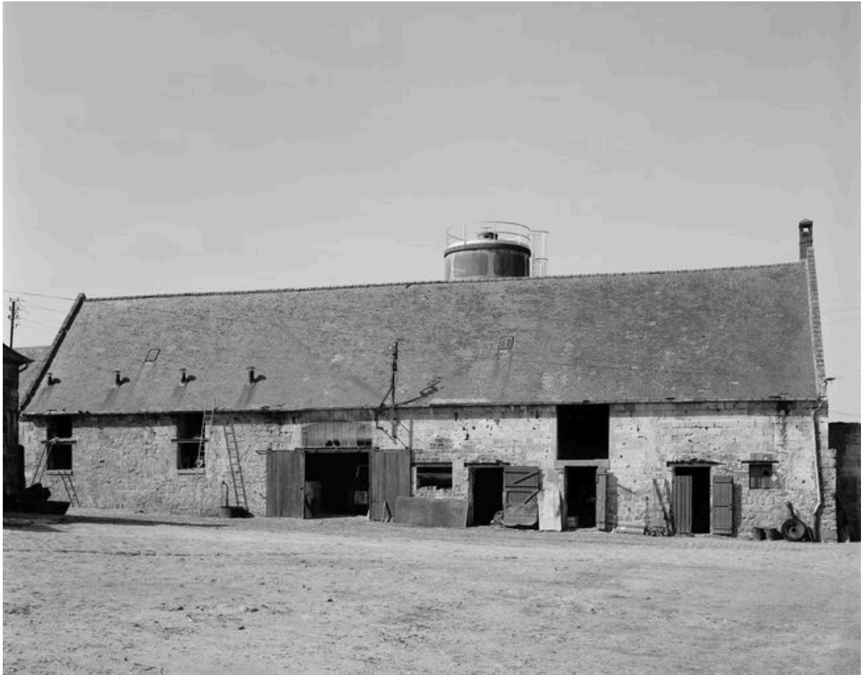
Grange, élévation antérieure.