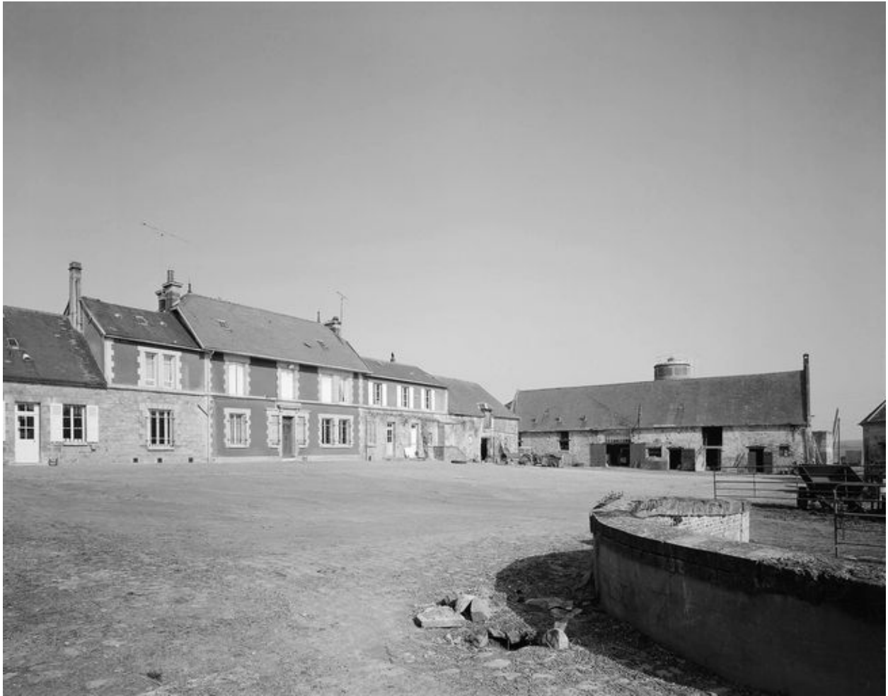
Logis et grange, depuis la cour.