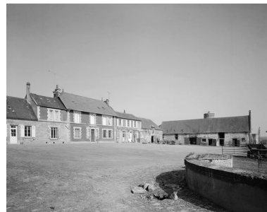
Logis et grange, depuis la cour. IVR22_19856000580V