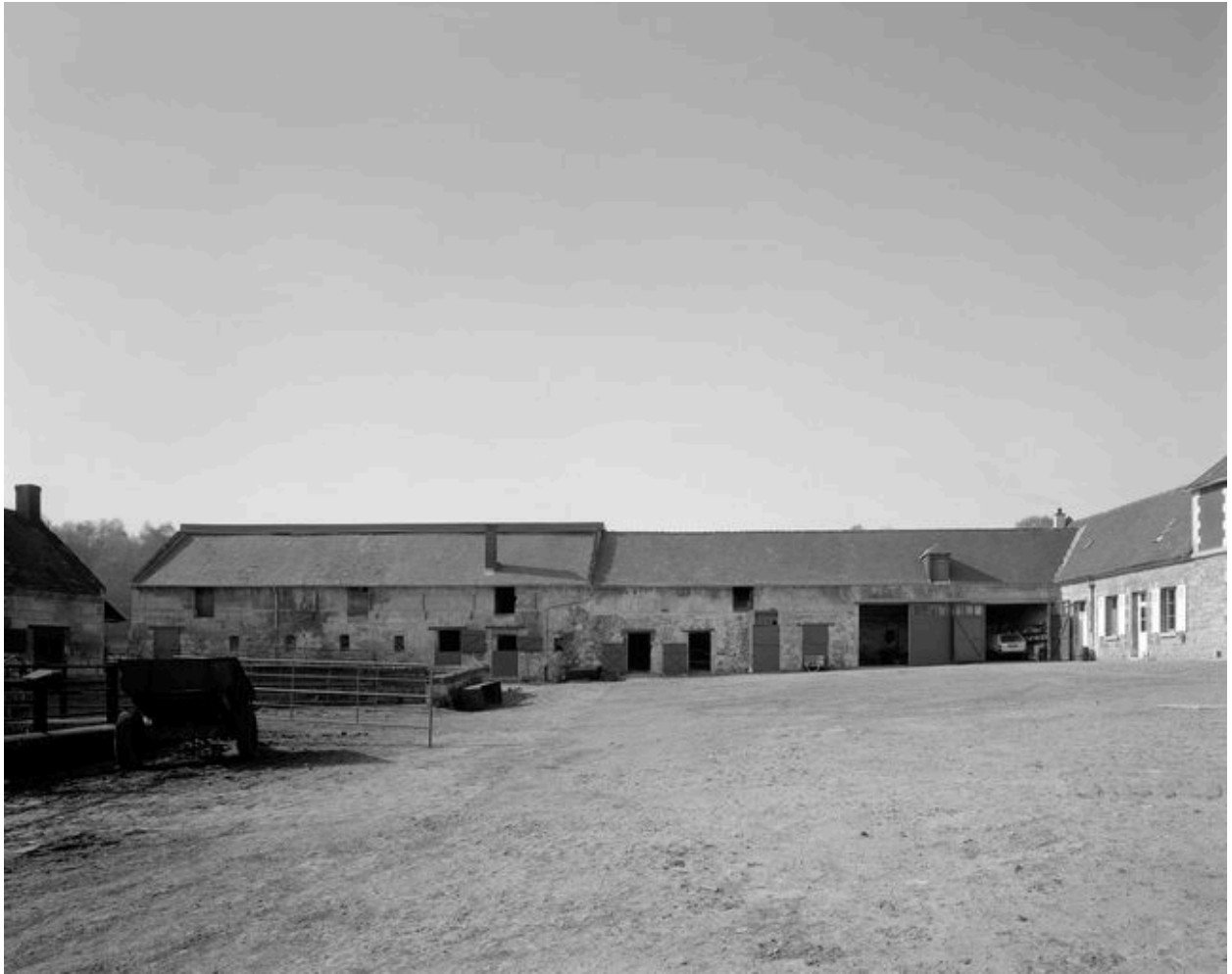
Porcherie, étable à chevaux, depuis la cour.