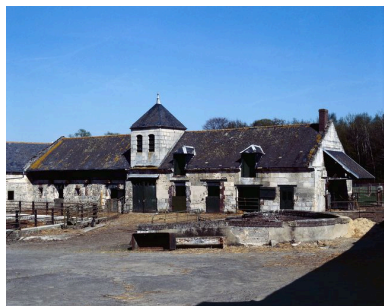
Etables et pigeonnier, depuis la cour. IVR22_19856000645XA