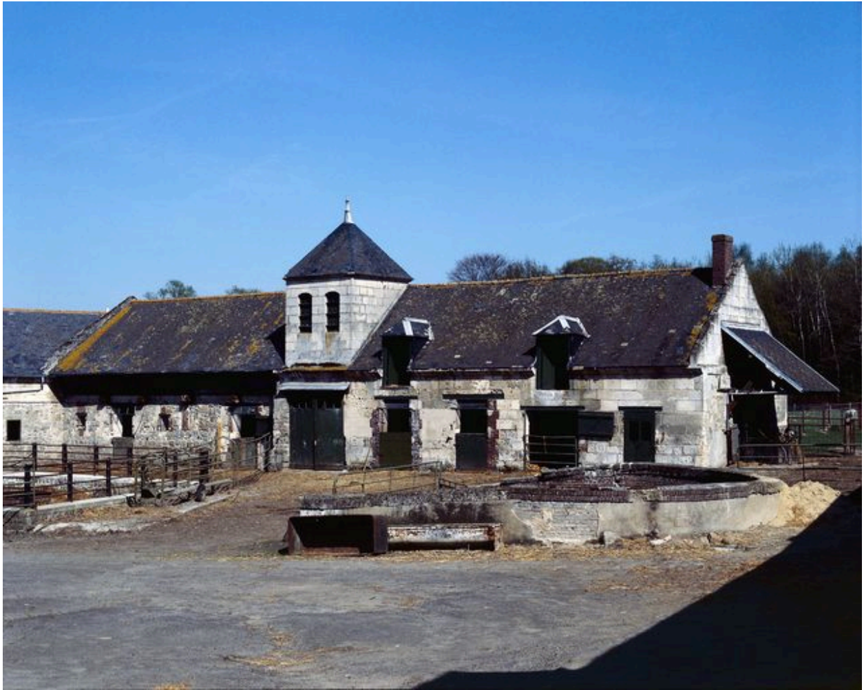
Etables et pigeonnier, depuis la cour.