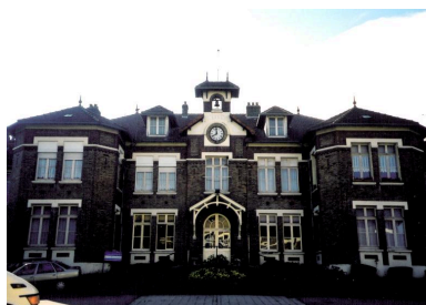
Le bâtiment principal.