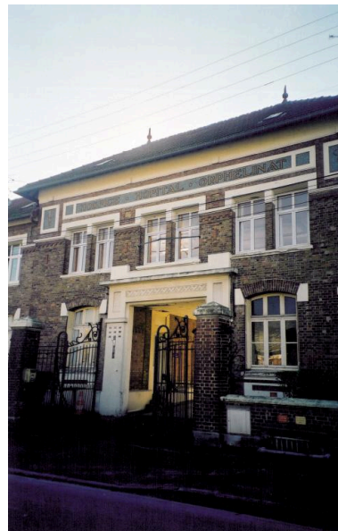
Le bâtiment d'entrée. IVR22_20158005388NUCA