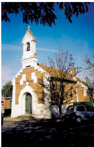
La chapelle.