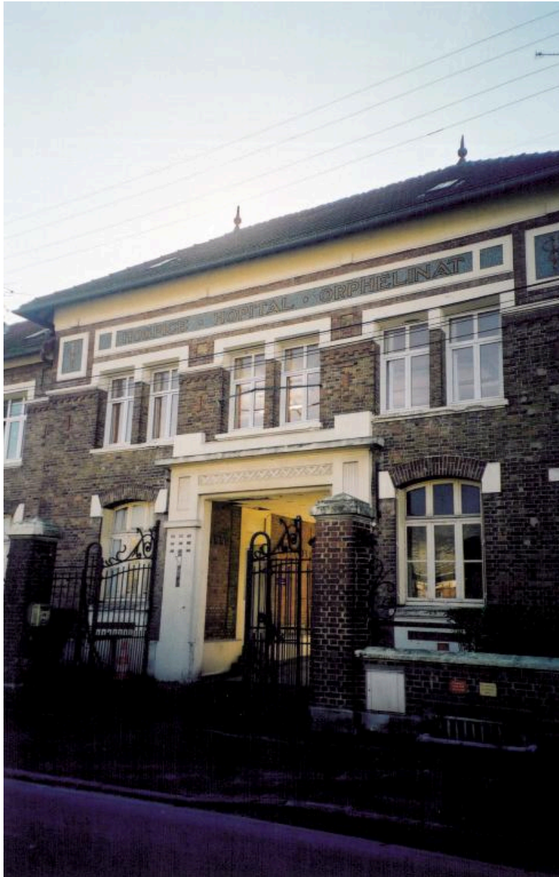
Le bâtiment d'entrée.