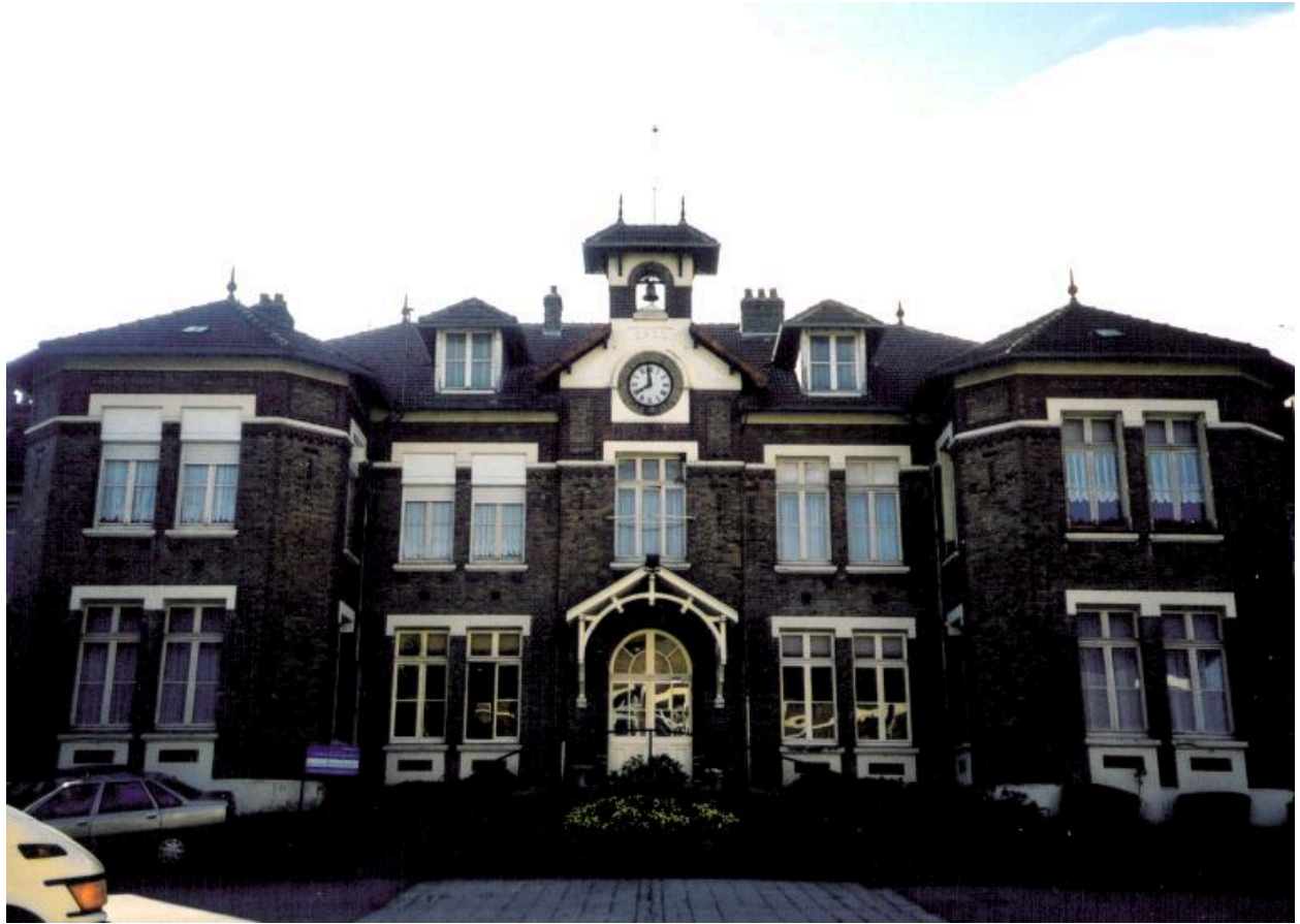
Le bâtiment principal.