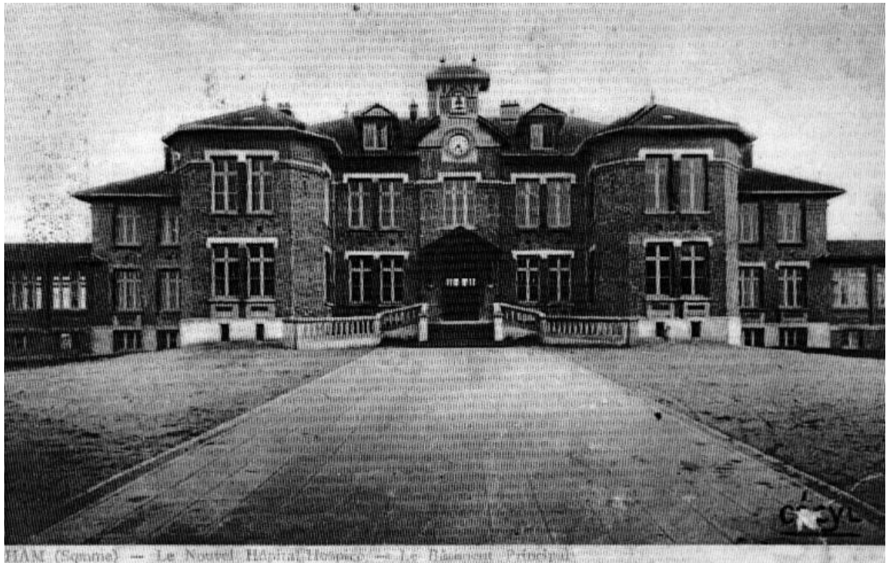
Le bâtiment principal, carte postale (AD Somme ; 8 Fi 1498).