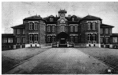
Le bâtiment principal, carte postale.