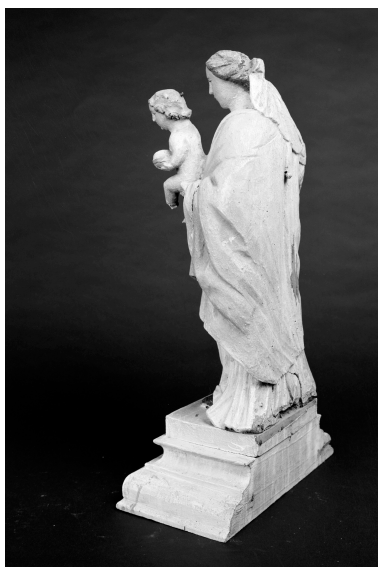
Trois quarts revers.

IVR31_19876200745X