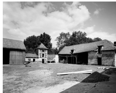
Bâtiments sur cour.