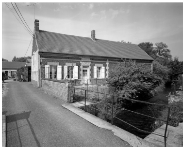
Logis. Elévation antérieure. IVR22_19866000134V