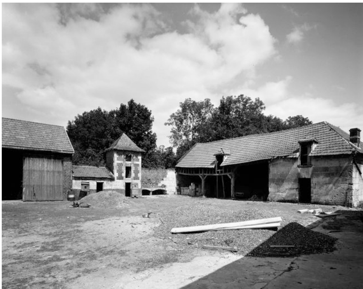
Bâtiments sur cour.