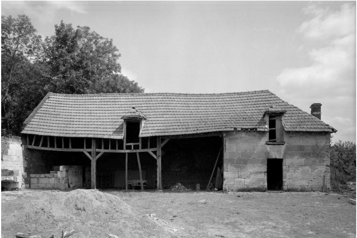
Grange et hangar.