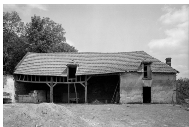
Grange et hangar. IVR22_19856001014X