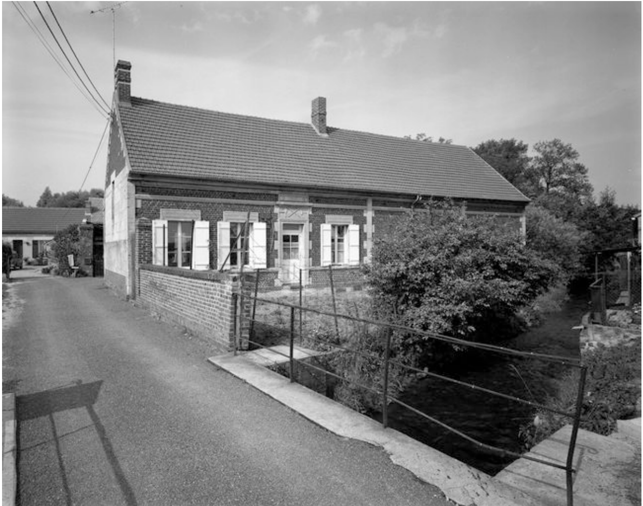
Logis. Elévation antérieure.