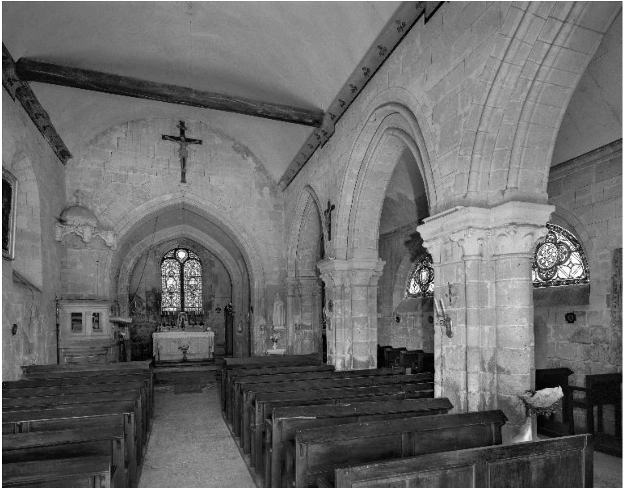
Vue intérieure de l'église et de son ameublement.