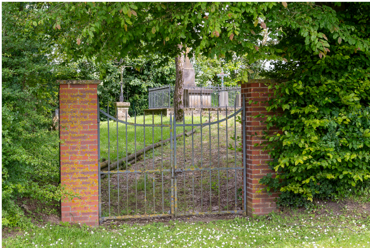
Vue générale de l'entrée du cimetière.