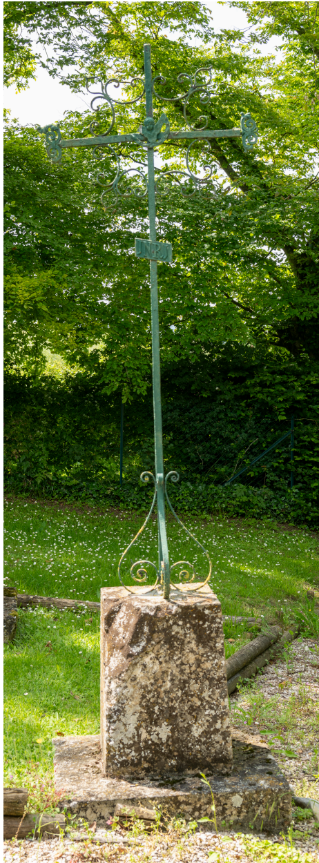
Croix funéraire, pierre et fer forgé, XIXe siècle.