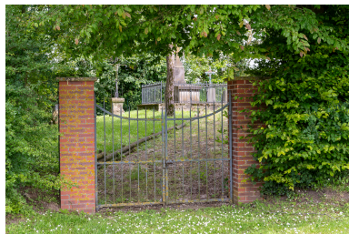
Vue générale de l'entrée du cimetière. IVR32_20246000523NUCA