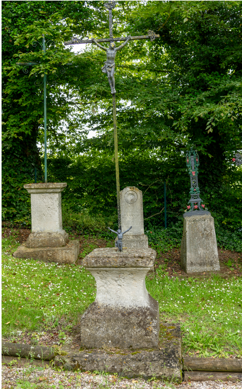
Ancienne croix du cimetière (?), pierre et fer forgé, dernier quart du XVIIIe siècle (?).