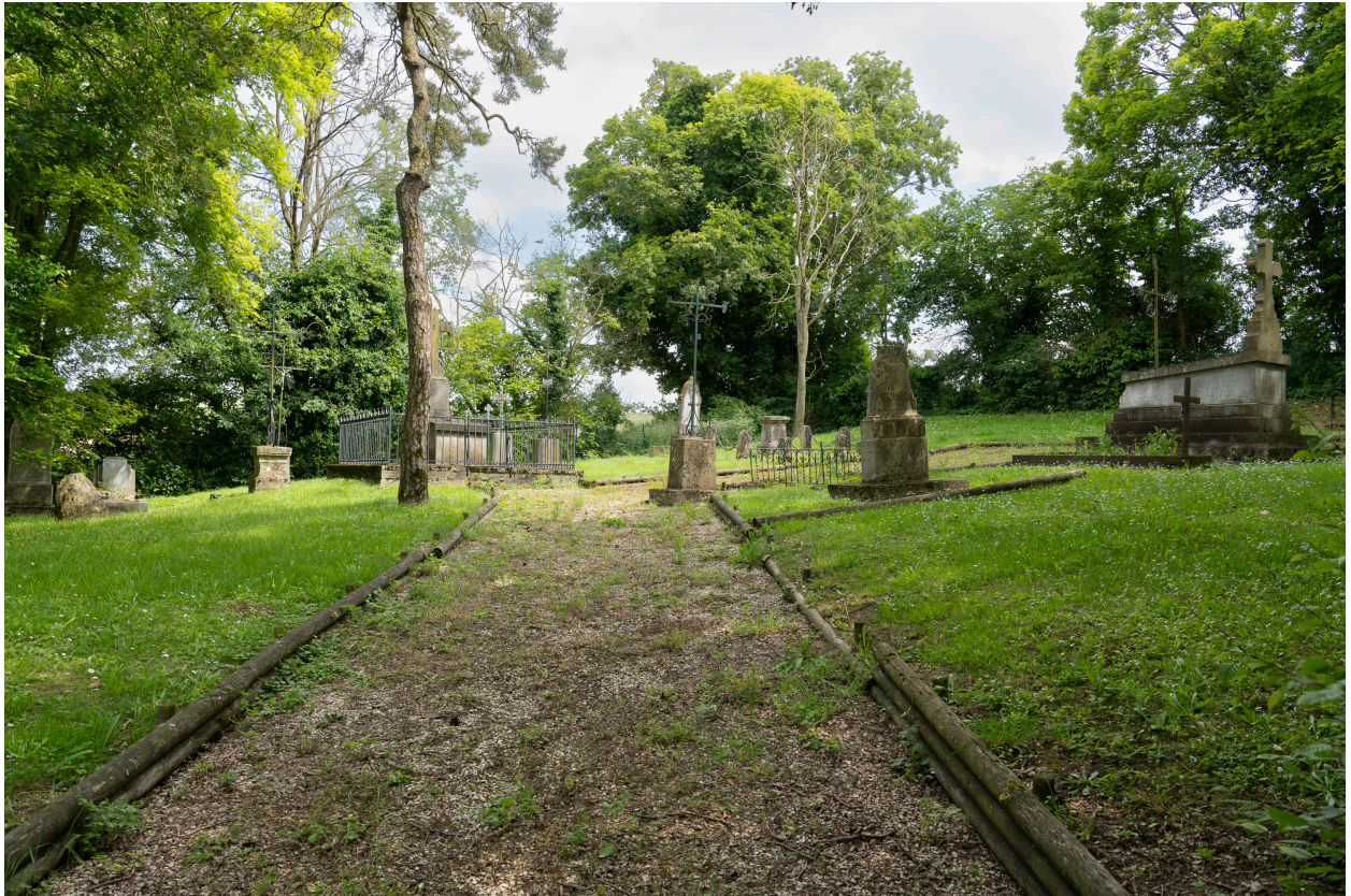
Vue générale depuis l'entrée du cimetière.