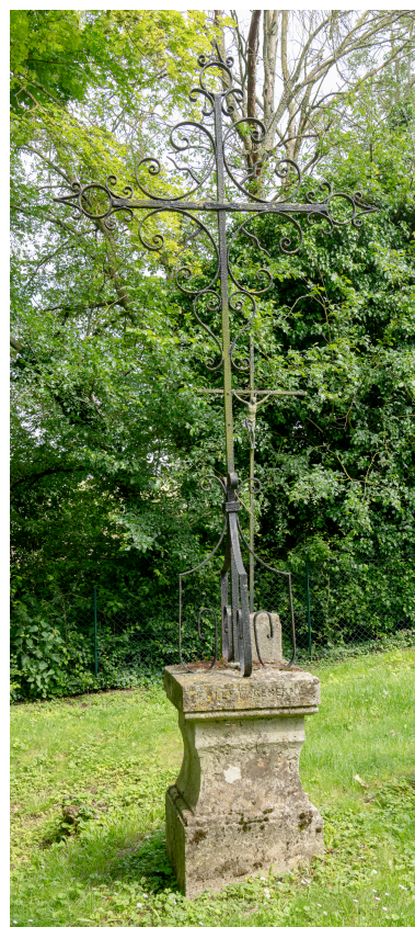
Croix funéraire de la famille Follet-Deberny, pierre et fer forgé, seconde moitié du XIXe siècle. IVR32_20246000528NUCA