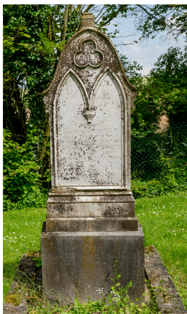
Monument funéraire de la famille Macrez-De Ridder, calcaire et marbre, seconde moitié du XIXe siècle.