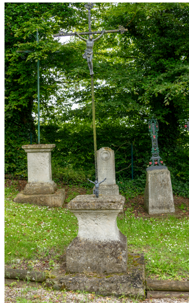
Ancienne croix du cimetière (?), pierre et fer forgé, dernier quart du XVIIIe siècle (?). IVR32_20246000525NUCA