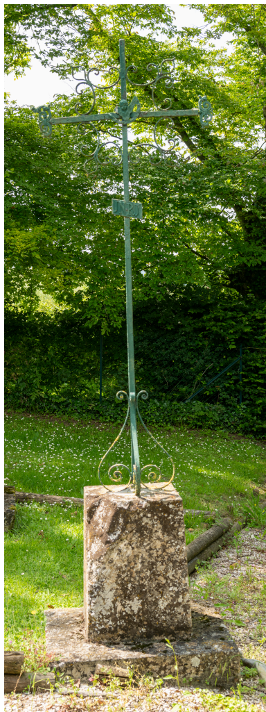
Croix funéraire, pierre et fer forgé, XIXe siècle.