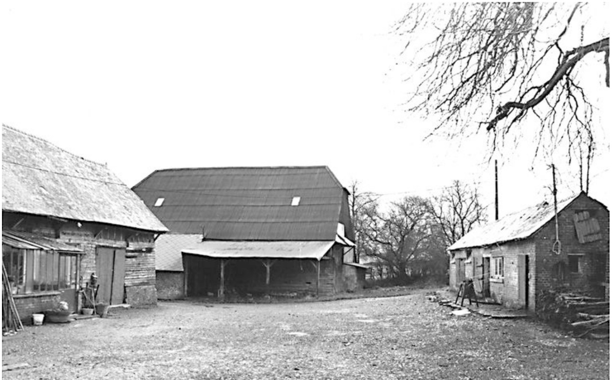
Grange et porcherie.