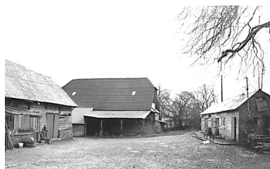
Grange et porcherie.

IVR22_19970202373Z