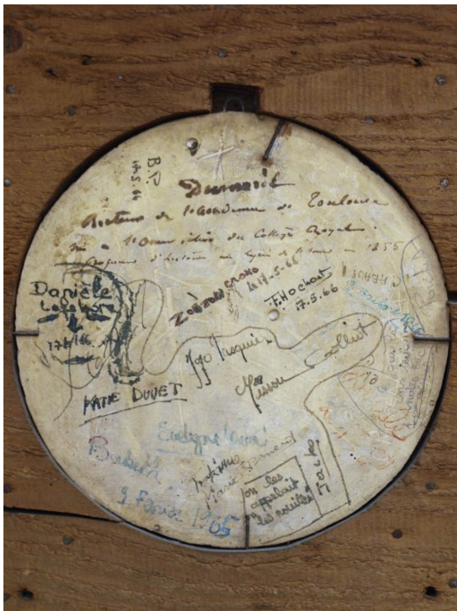
Vue de détail : graffiti et inscription au revers