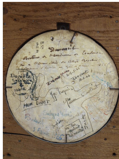
Vue de détail : graffiti et inscription au revers IVR31_20106204449NUCA