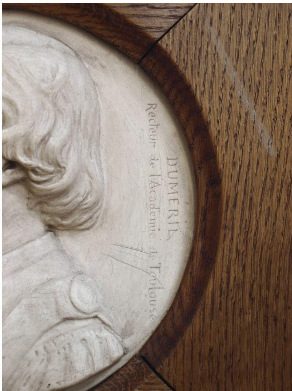
Vue de détail : inscription