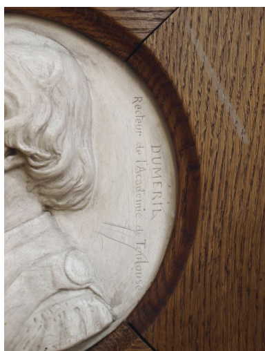
Vue de détail : inscription IVR31_20106204448NUCA