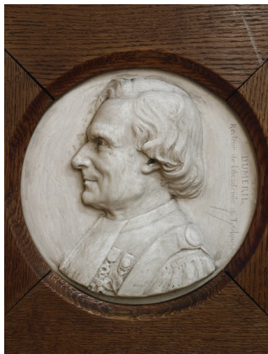
Vue générale IVR31_20106204446NUCA