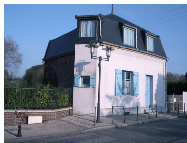
Vue générale. IVR22_20058005186NUCA