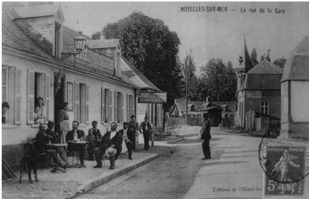
Vue ancienne de la rue de la Gare avec vue latérale de la maison.