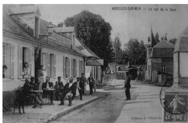
Vue ancienne de la rue de la Gare avec vue latérale de la maison.