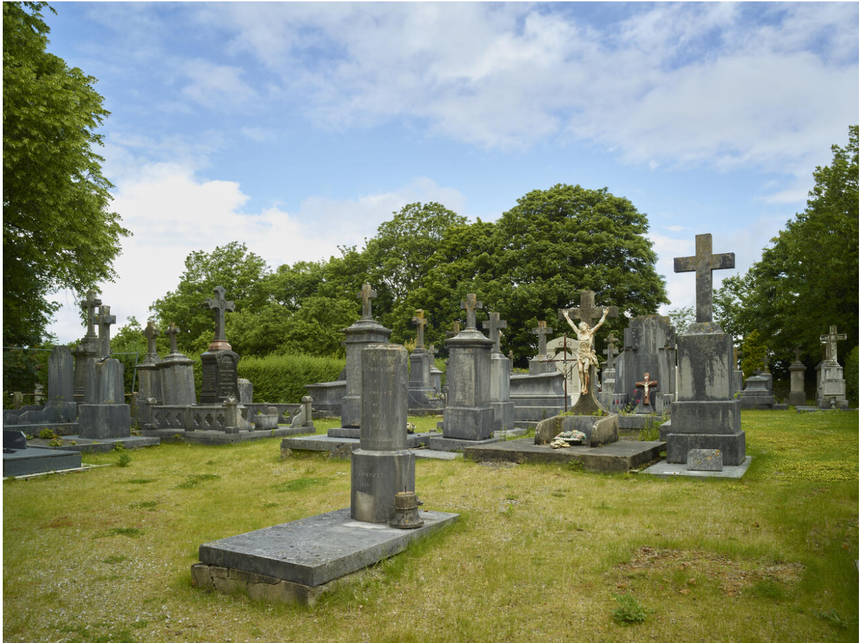
Vue générale du cimetière au nord de l'église.