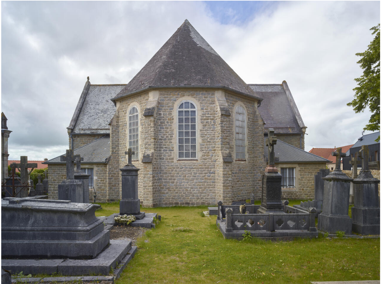
Vue du chevet.