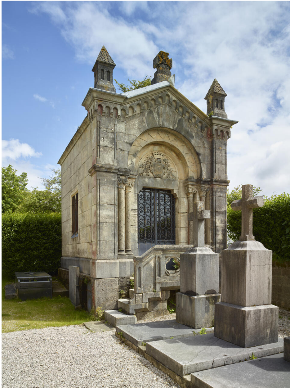
Chapelle funéraire (de la famille Fabre-Roustang ?).