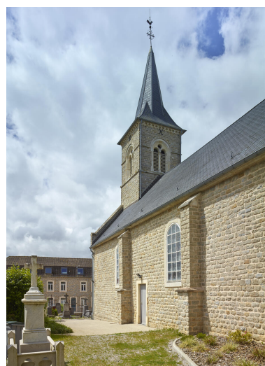
Vue de l'élévation est. IVR32_20246200166NUCA