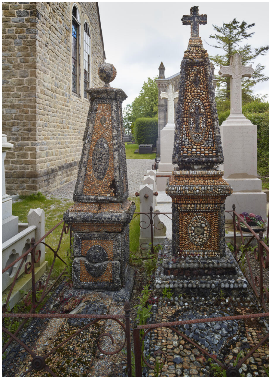
Enclos funéraire, tombes recouvertes de cailloux de couleurs formant un décor.