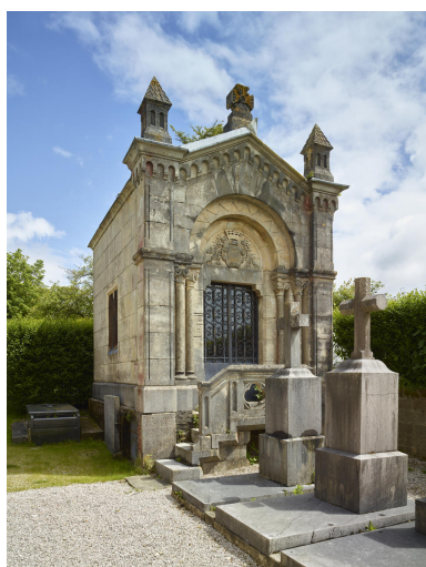
Chapelle funéraire (de la famille Fabre-Roustang ?).