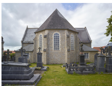
Vue du chevet. IVR32_20246200163NUCA