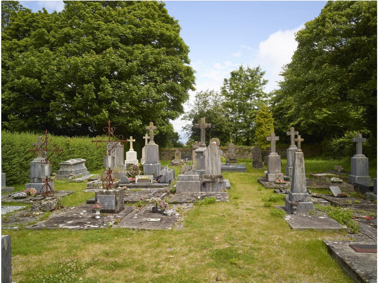
Vue générale du cimetière au nord de l'église.