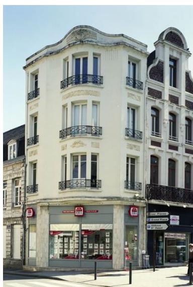
Vue générale. IVR31_20086200132XE