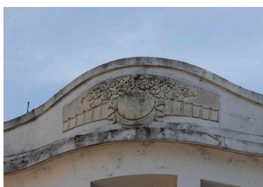
Décor sculpté du fronton, mêlé de fleurs en aplat, de rubans et de vagues.