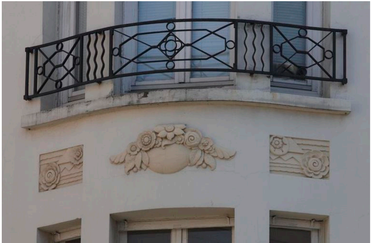
Décors floraux et géométriques d'un garde-corps et d'une allège.