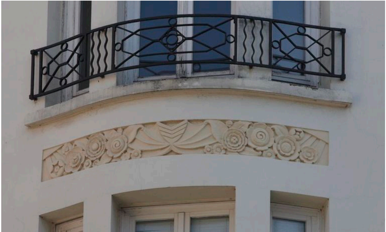
Détail d'une allège sculptée de fleurs en aplat et de formes géométriques.