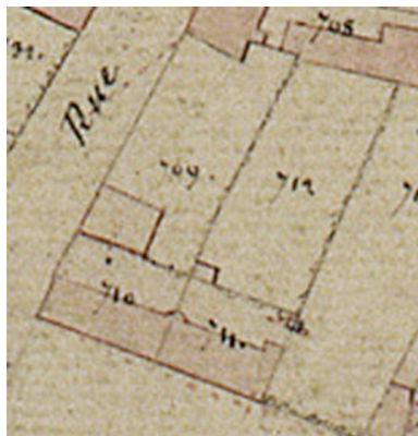
Détail du plan cadastral, section B, par Carette, 1832 (AD Somme ; 3P 1447/4).

IVR22_20088015480NUCA