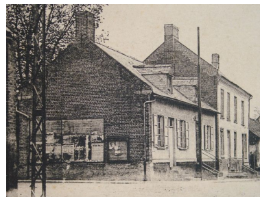
Vue générale de la mairie-école et du logement de l'institutrice, avant 1914