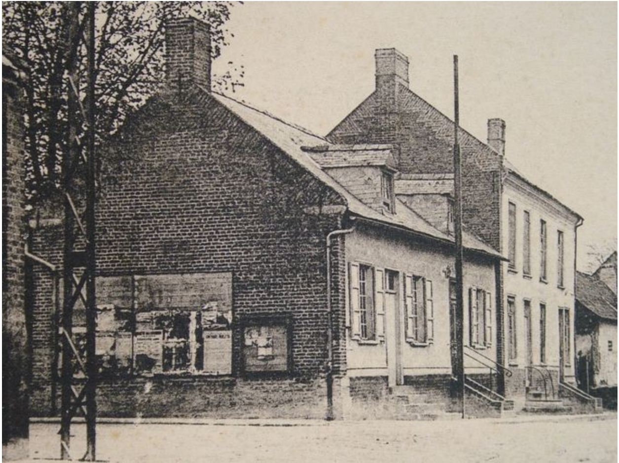
Vue générale de la mairie-école et du logement de l'institutrice, avant 1914.