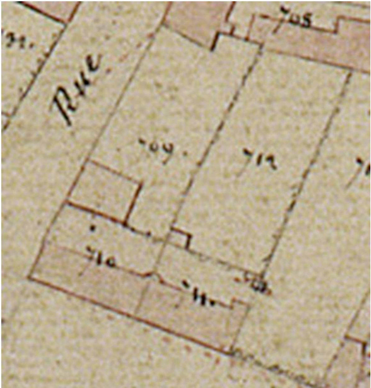
Détail du plan cadastral, section B, par Carette, 1832 (AD Somme ; 3P 1447/4).