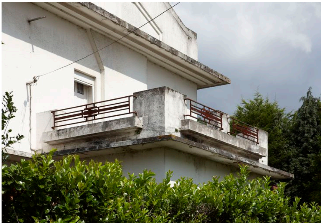
Façade latérale, étage, détail : terrasse et garde-corps.