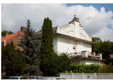
Façade latérale, vue partielle : traitement du pignon.