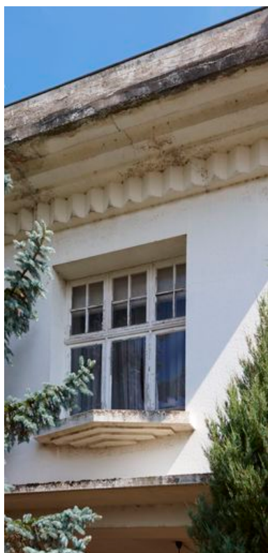
Façade, étage, détail : baie, auvent et corniche.