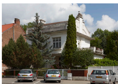
Vue générale. IVR31_20105900376NUC4A