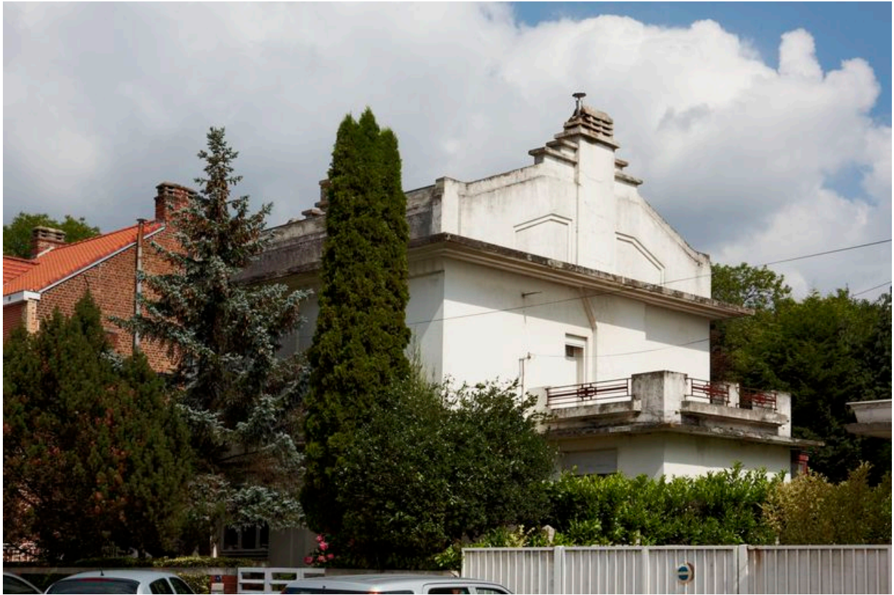
Façade latérale, vue partielle : traitement du pignon.