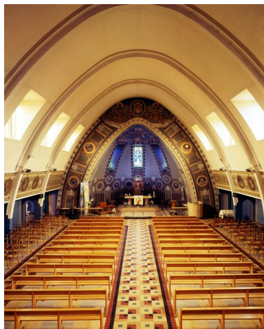
Vue de la nef, vers le chœur. IVR22_20048000076VA