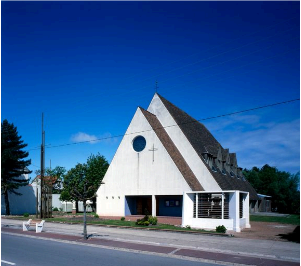
Vue d'ensemble depuis l'avenue de la Plage.