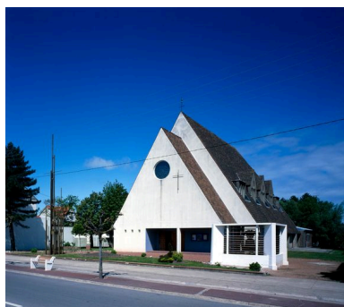
Vue d'ensemble depuis l'avenue de la Plage.

IVR22_20038000502VA