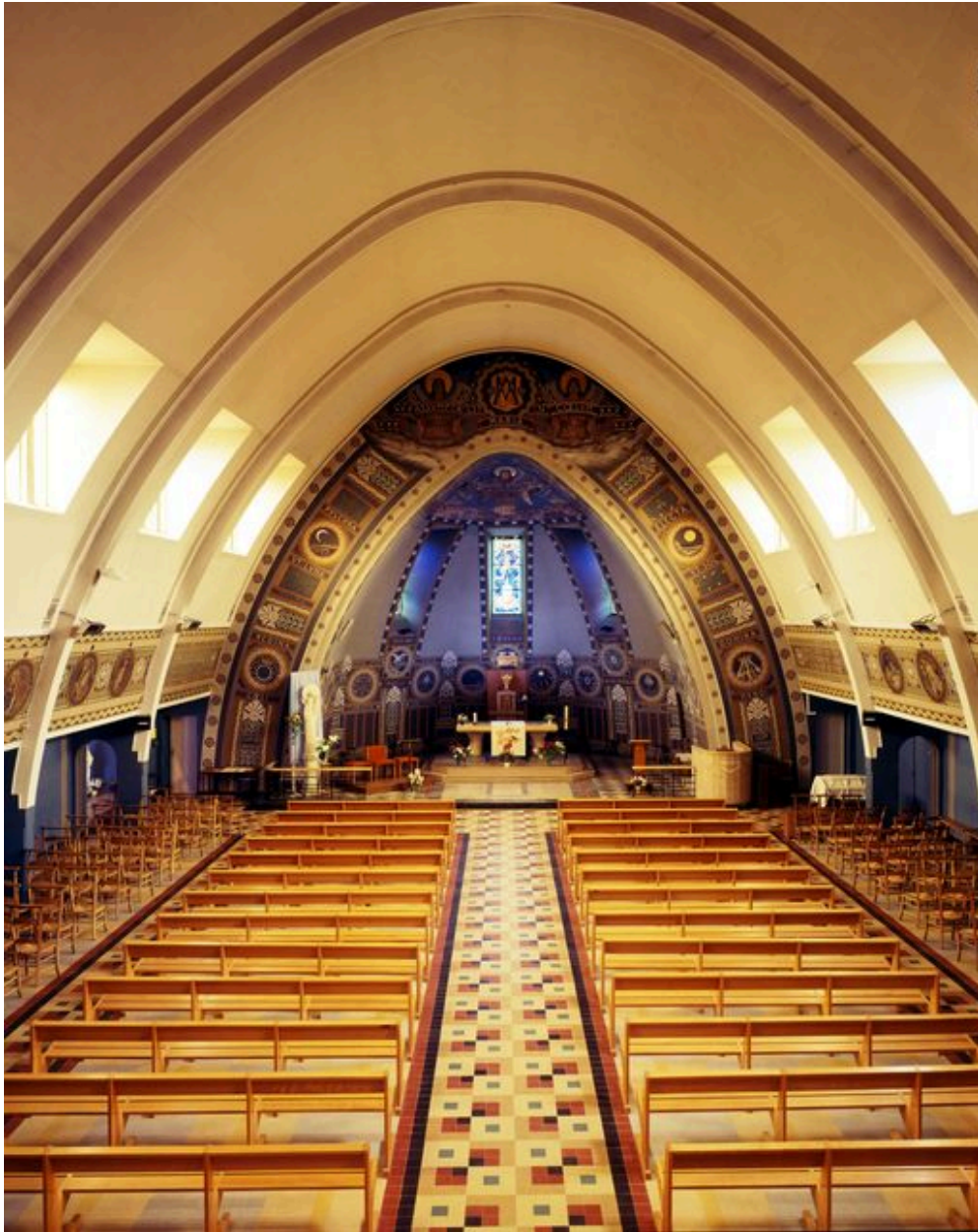
Vue de la nef, vers le chœur.