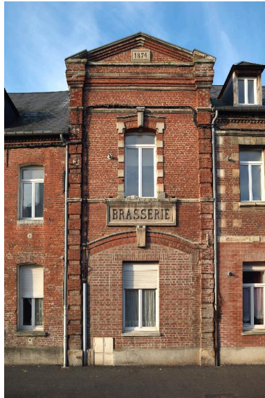
La travée centrale de l'ancienne brasserie.

IVR22_20158001057NUC2A