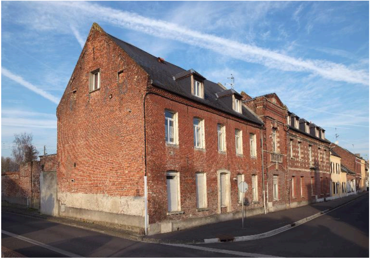
Vue générale, depuis le sud.