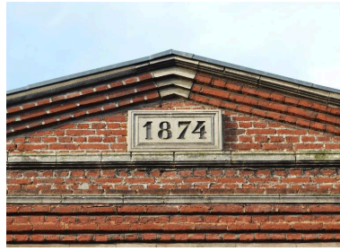
Date gravée sur le fronton.