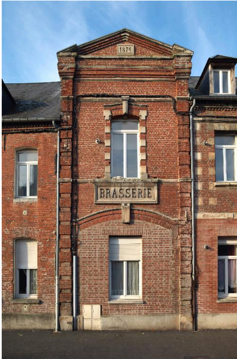
La travée centrale de l'ancienne brasserie.