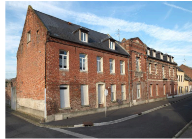
Vue générale, depuis le sud. IVR22_20158001055NUC2A