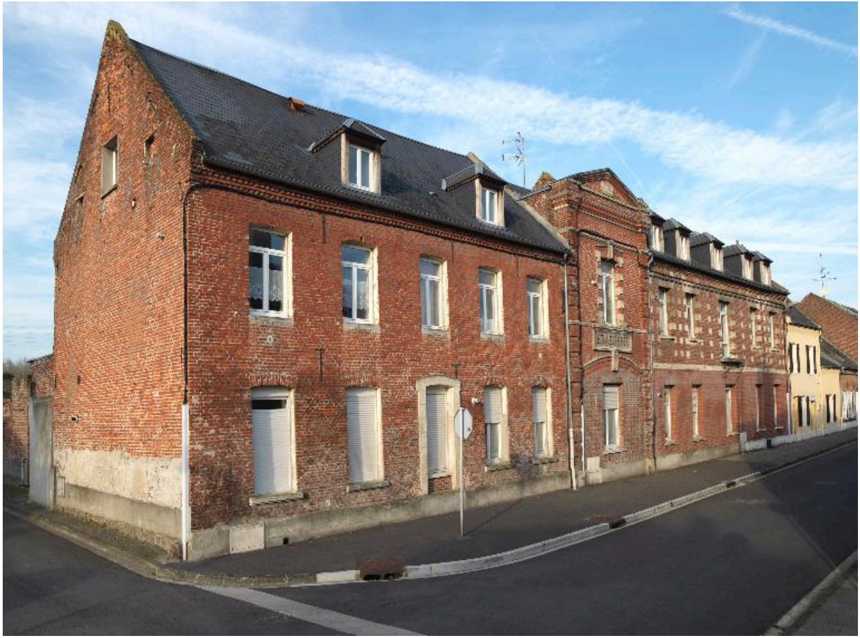
Vue générale, depuis le sud.