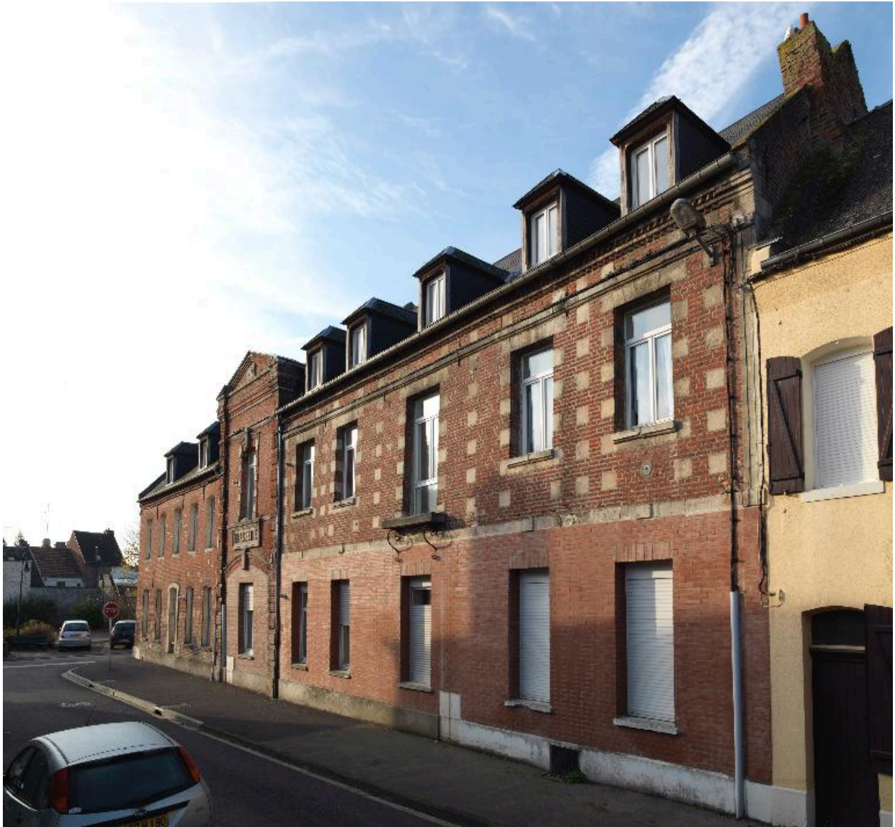
Vue générale depuis le nord.