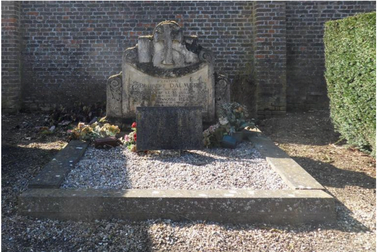
Stèle funéraire, vers 1925.