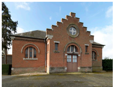
La chapelle. Vue depuis le nord.