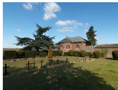
Vue générale, depuis le sud-est. IVR22_20128000039NUCA