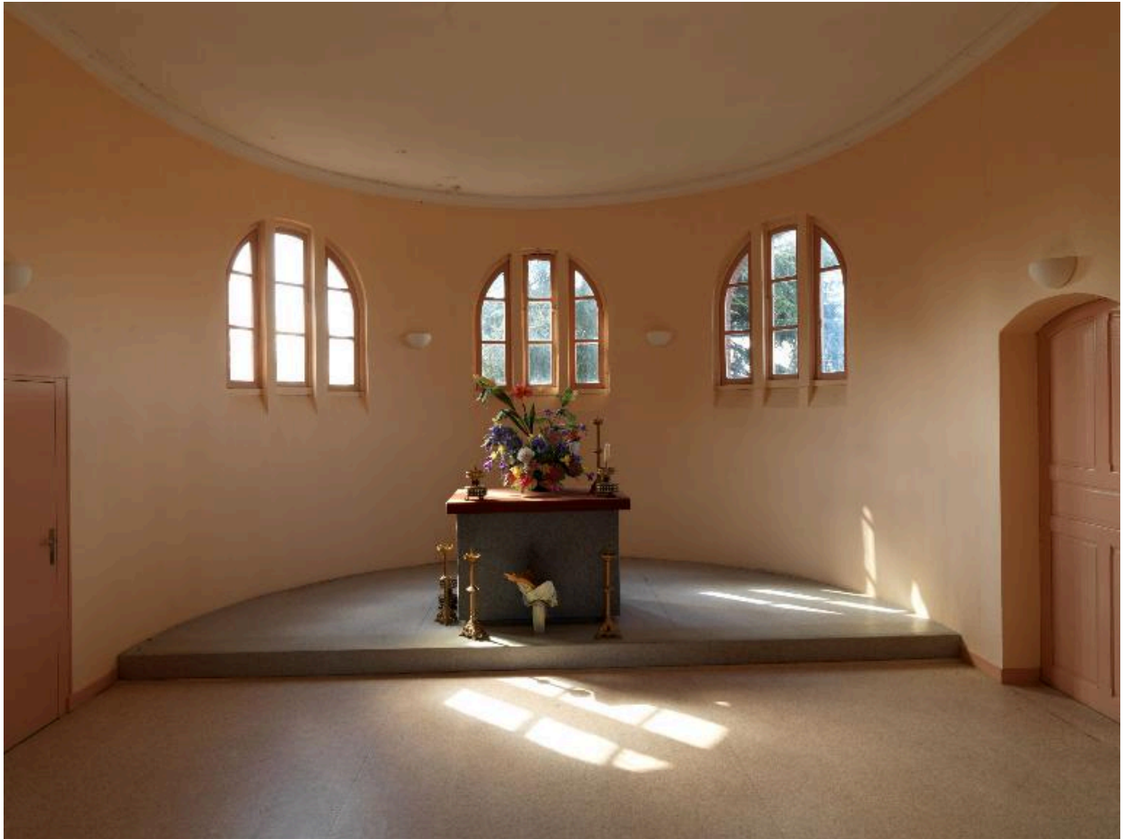
Vue intérieure de la chapelle.