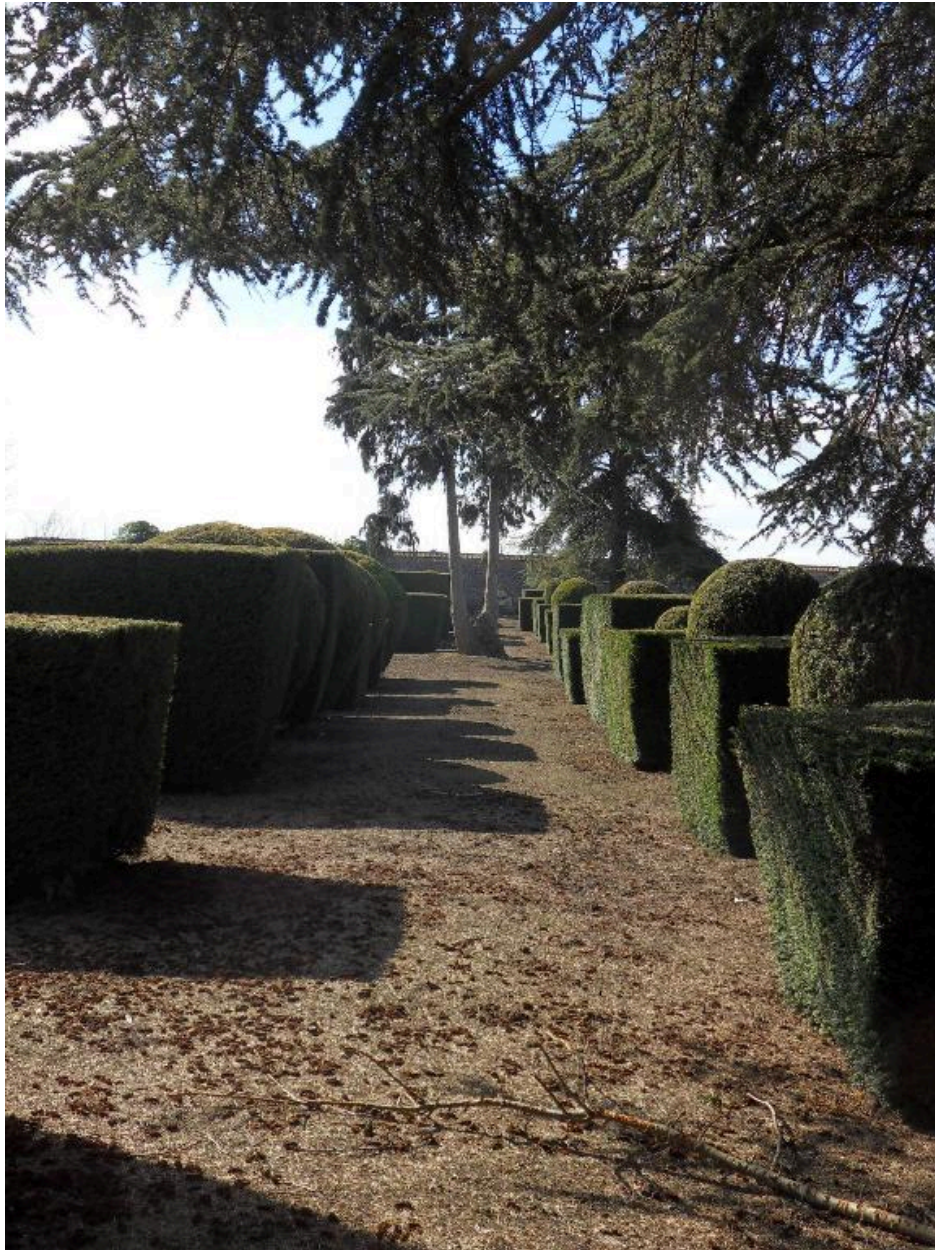
L'allée centrale du cimetière, vue vers le sud.