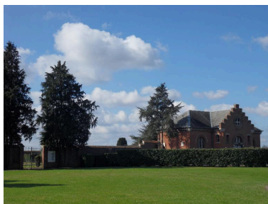
Vue de situation depuis le nord-est. IVR22_20128015639NUCA