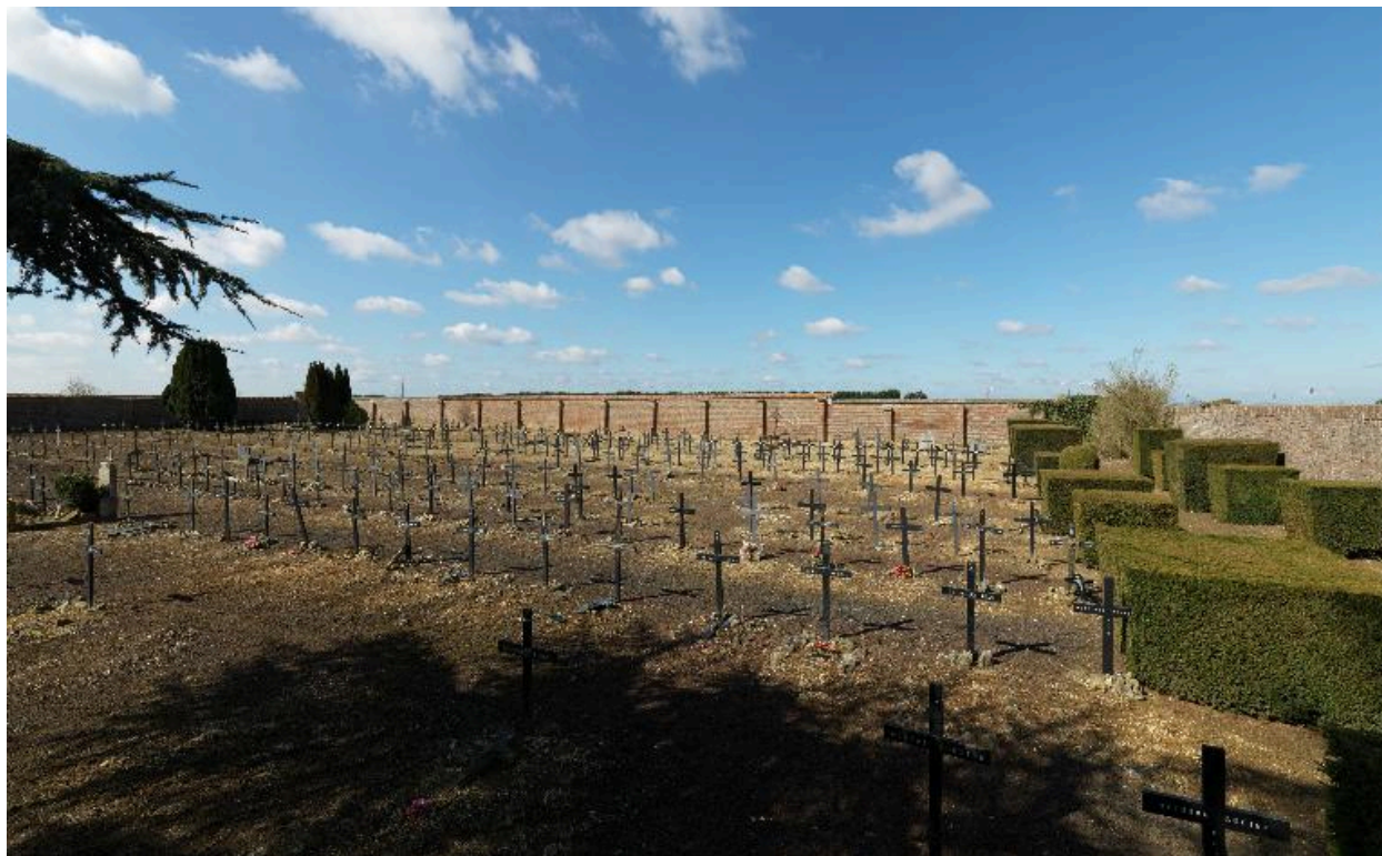
Vue générale, depuis le nord-est.