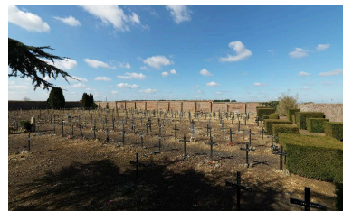
Vue générale, depuis le nord-est.