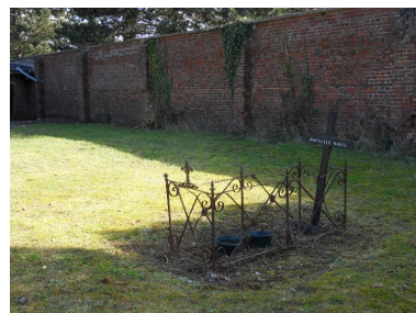
Tombeau à enclos. IVR22_20128015637NUCA