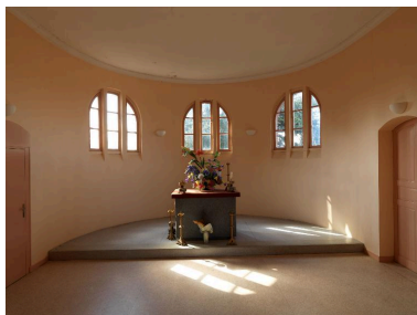
Vue intérieure de la chapelle. IVR22_20128000040NUCA