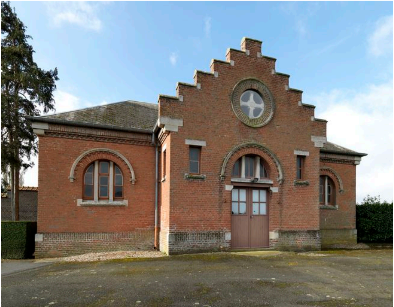
La chapelle. Vue depuis le nord.