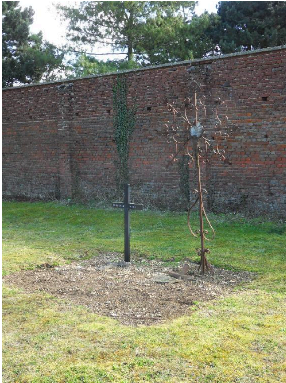
Croix funéraire, 1er quart 20e siècle.