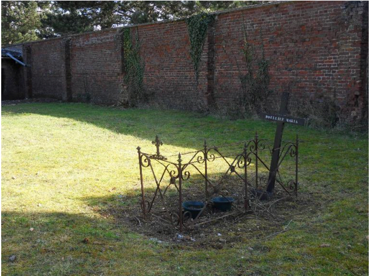
Tombeau à enclos.