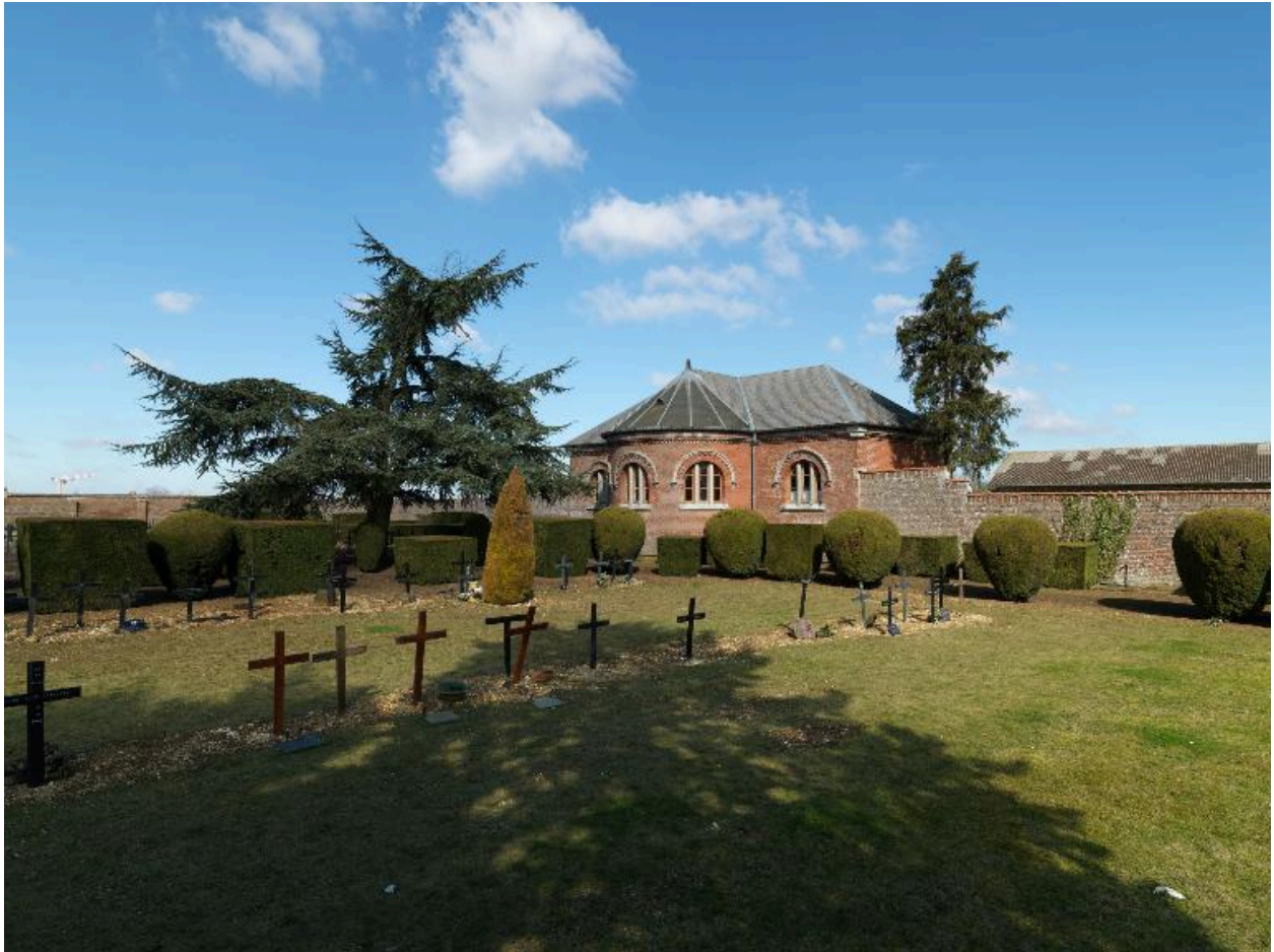
Vue générale, depuis le sud-est.