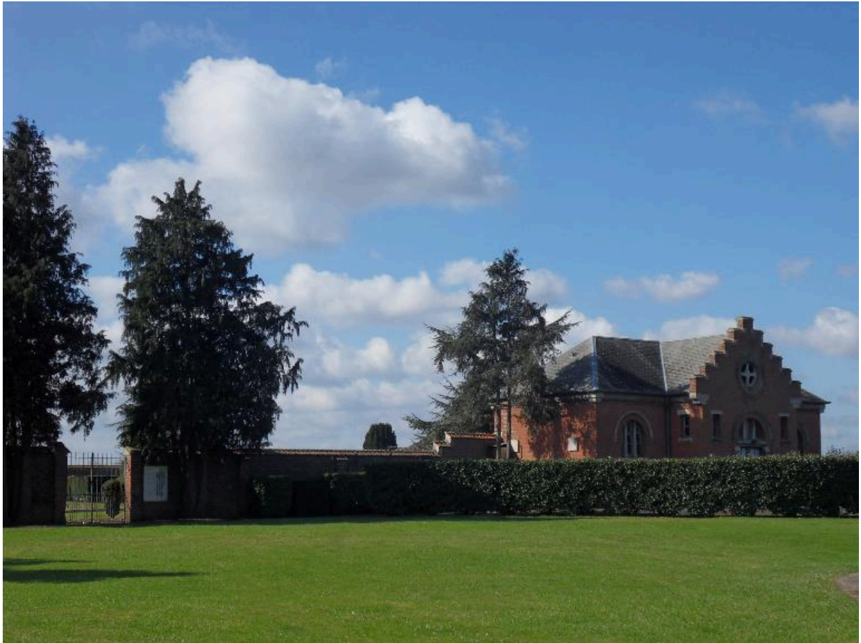
Vue de situation depuis le nord-est.