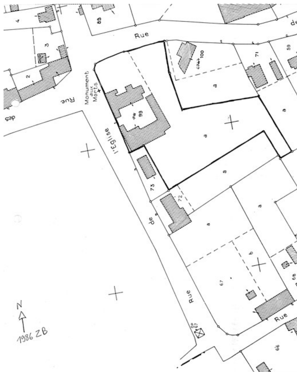
Plan de situation. Extrait du plan cadastral de 1986, section ZB.