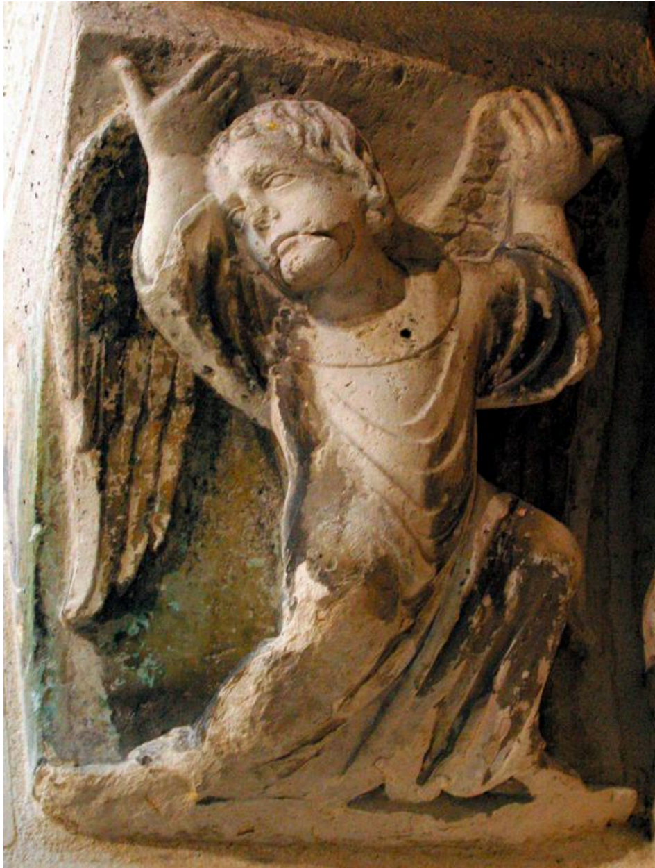
Vue de l'un des deux coussinets du portail occidental.