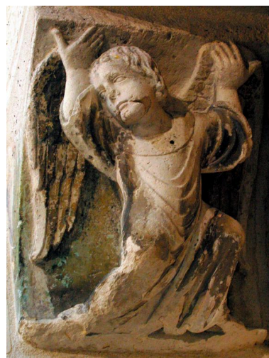
Vue de l'un des deux coussinets du portail occidental. IVR22_20040202697NUC1A