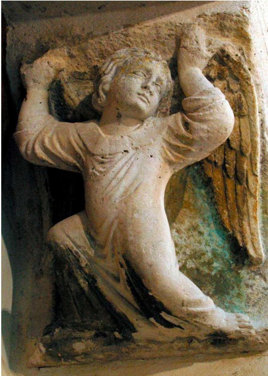
Vue de l'un des deux coussinets du portail occidental.