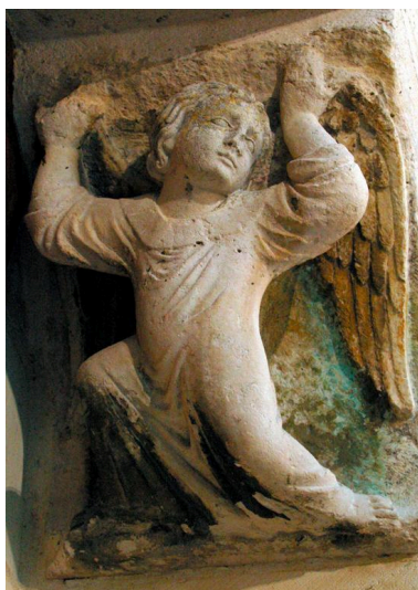
Vue de l'un des deux coussinets du portail occidental. IVR22_20040202696NUC1A