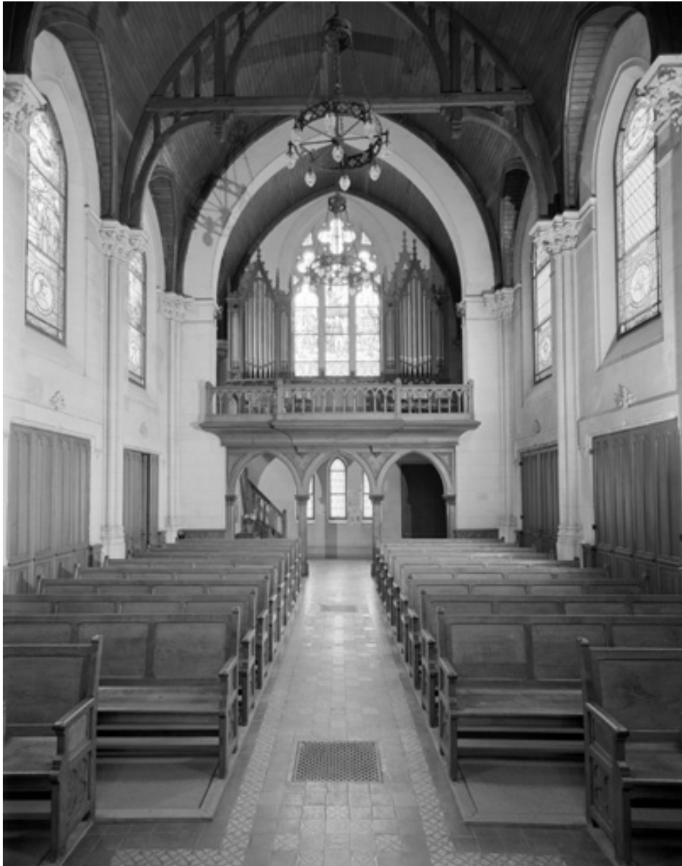
Vue intérieure, du chœur vers l'entrée.