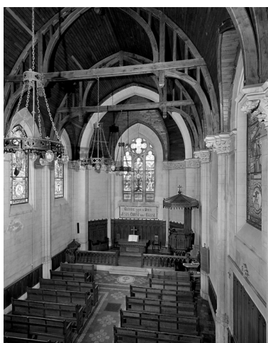
Vue intérieure depuis la tribune d'orgue, détail du choir. IVR22_19930200818V