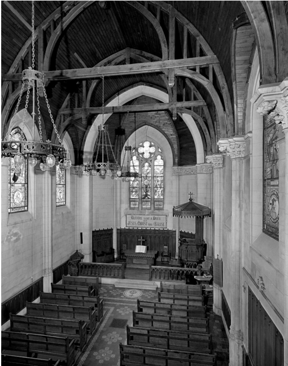
Vue intérieure depuis la tribune d'orgue, détail du chœur.