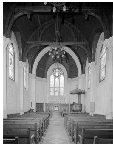
Vue intérieure, de l'entrée vers le choir.