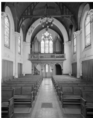
Vue intérieure, du choeur vers l'entrée. IVR22_19930200816V