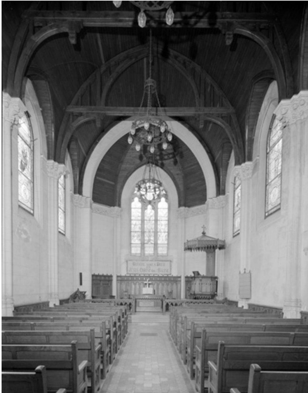
Vue intérieure, de l'entrée vers le chœur.