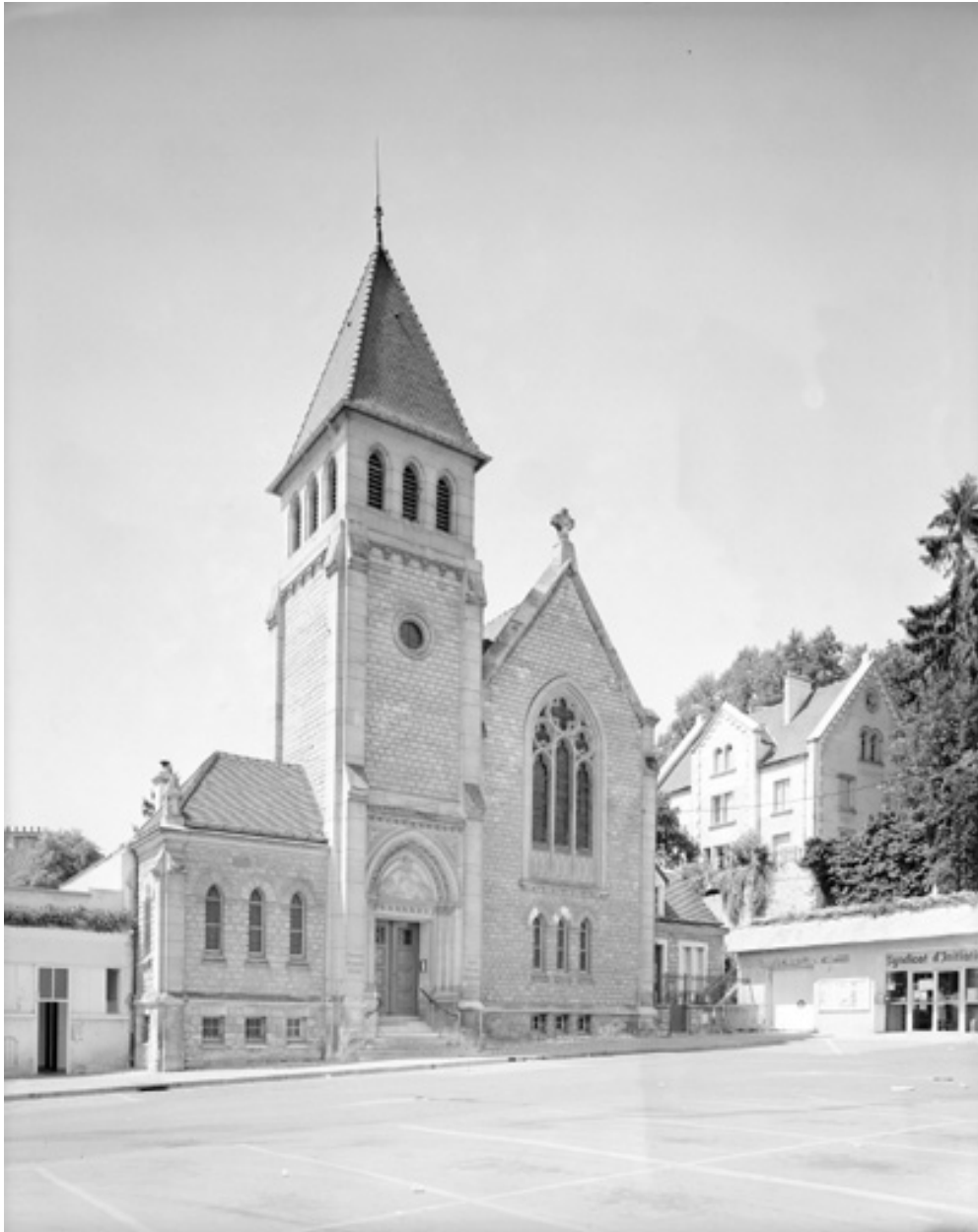
Elévation sur la place. Chauquet et Cret, architectes, 1924.