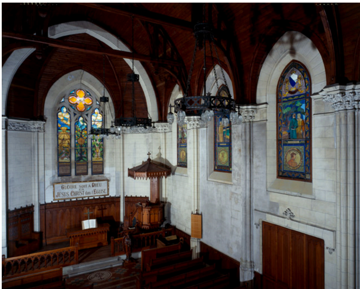
Vue intérieure prise de la tribune.