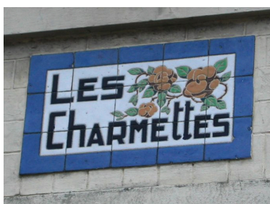
Détail des carreaux de céramique portant appellation de la maison dite Les Charmettes.