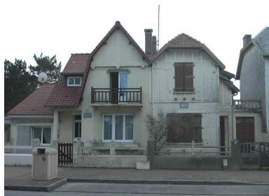
Vue d'ensemble des deux habitations.