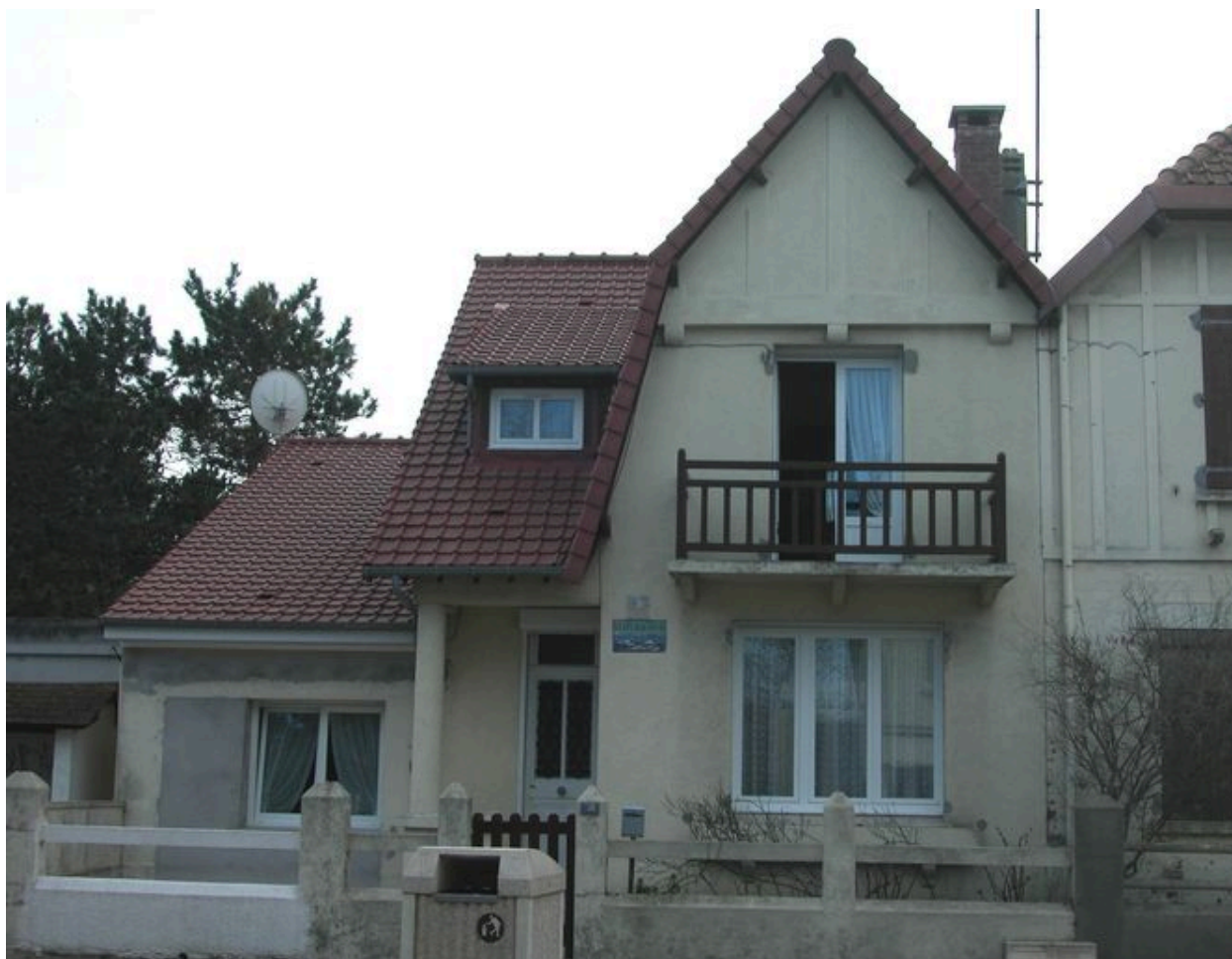
Les Brisants, élévation antérieure.