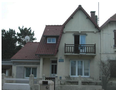
Les Brisants, élévation antérieure.