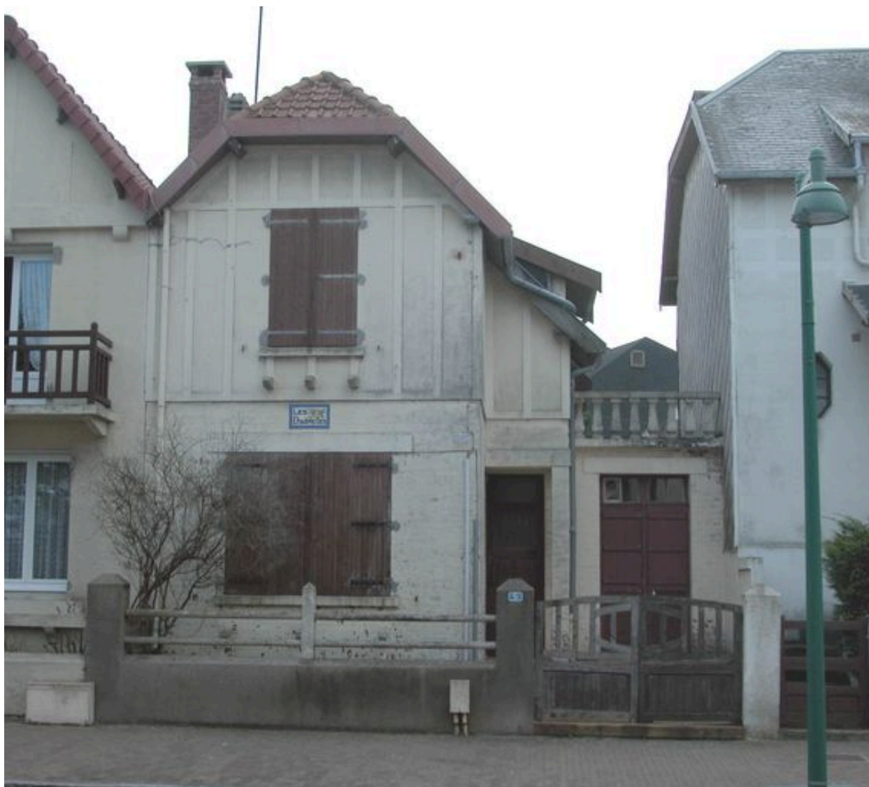
Les Charmettes, élévation antérieure.