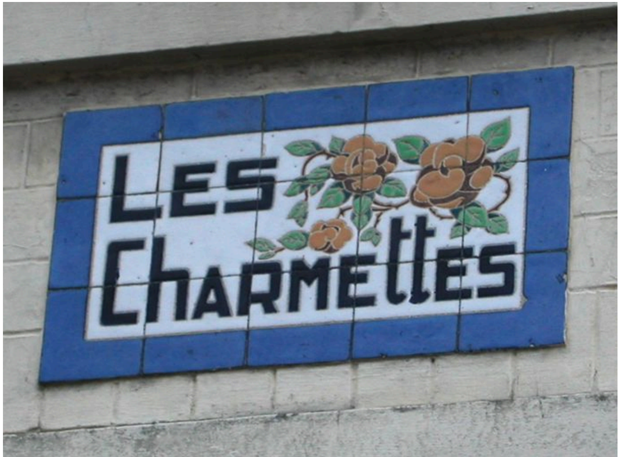
Détail des carreaux de céramique portant appellation de la maison dite Les Charmettes.