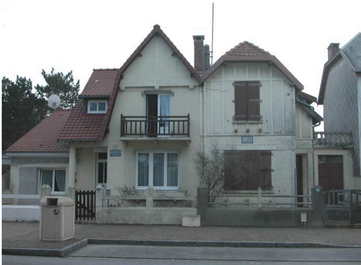
Vue d'ensemble des deux habitations.