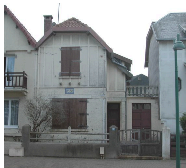
Les Charmettes, élévation antérieure.