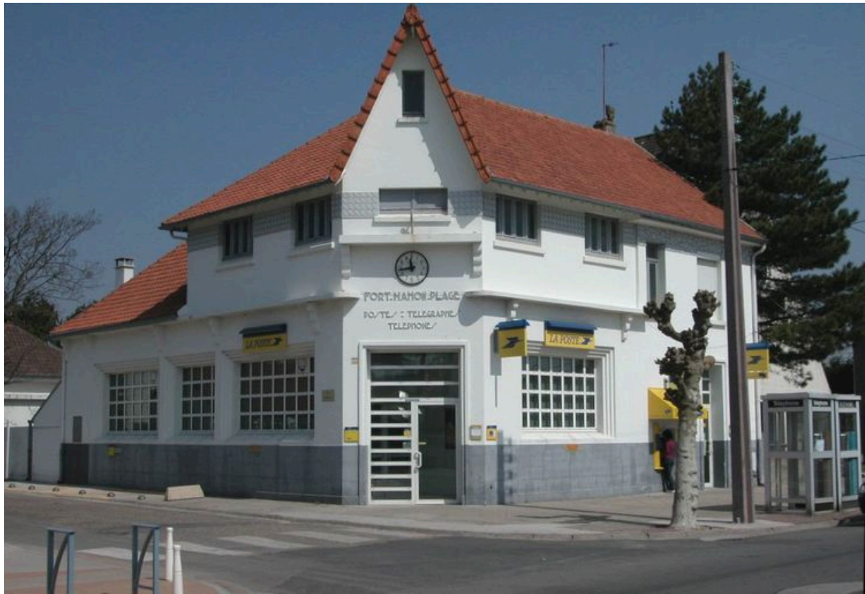
Vue d'ensemble depuis l'avenue.