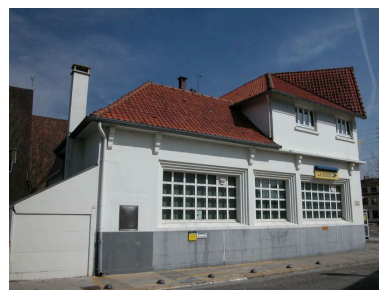
Elévation latérale, sur la rue Berlioz. IVR22_20058002970NUCA