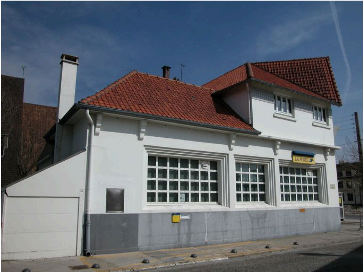
Elévation latérale, sur la rue Berlioz.