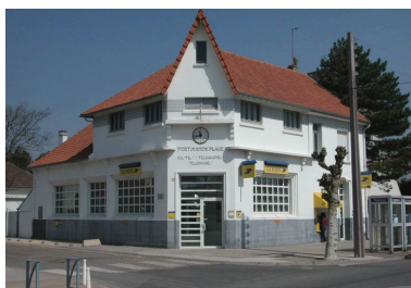
Vue d'ensemble depuis l'avenue. IVR22_20038005423NUCA