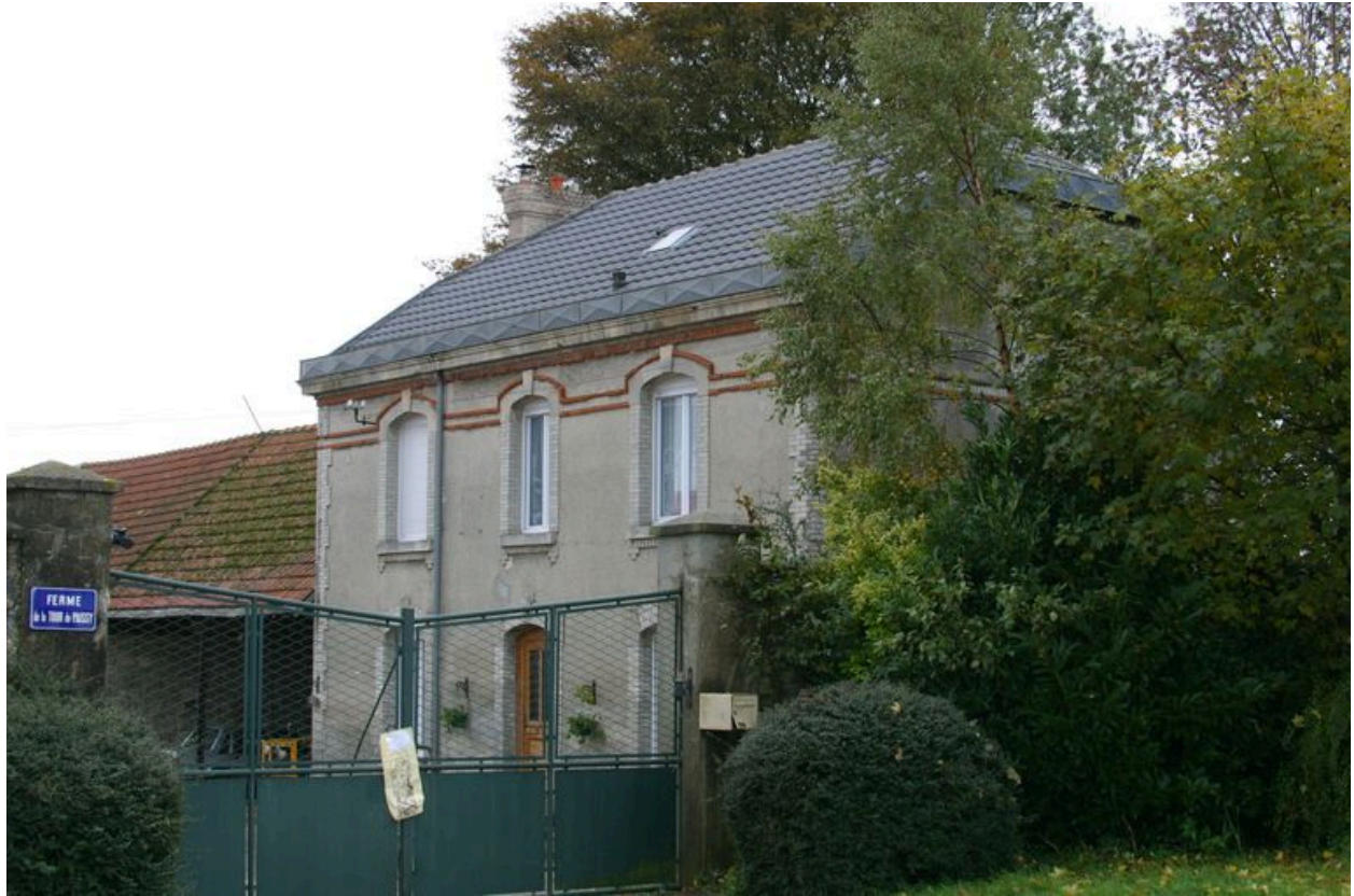
Vue de la façade principale du logis.