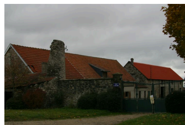
Vue générale des bâtiments agricoles. IVR22_20030202010NUCA