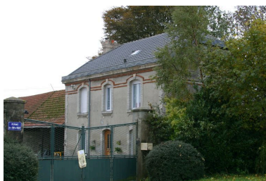
Vue de la façade principale du logis.