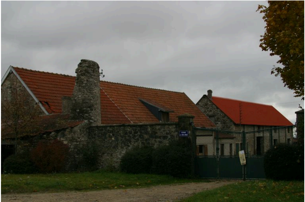
Vue générale des bâtiments agricoles.