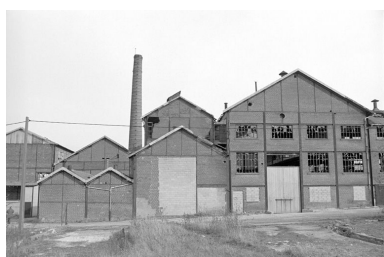
Atelier de fabrication, flanc ouest. IVR22_19908001220Z