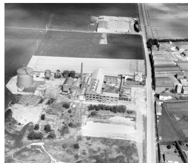
Vue aérienne, flanc ouest.