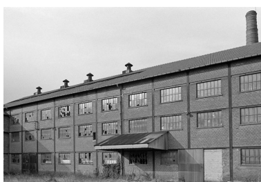
Atelier de fabrication, flanc sud. IVR22_19908001223Z