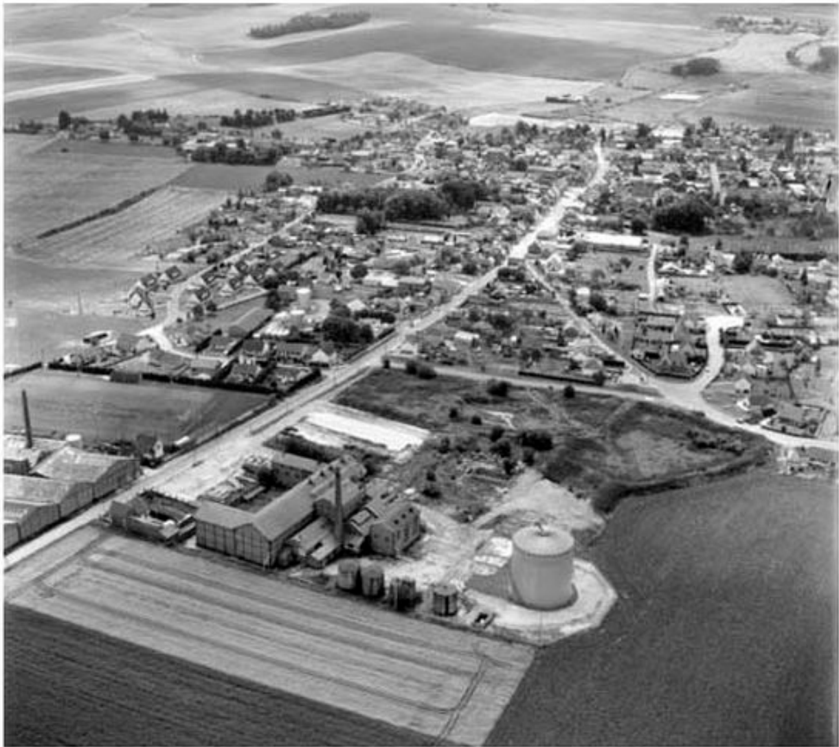
Vue aérienne, flanc est.