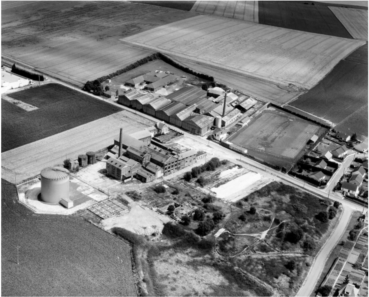
Vue aérienne, flanc nord-ouest.