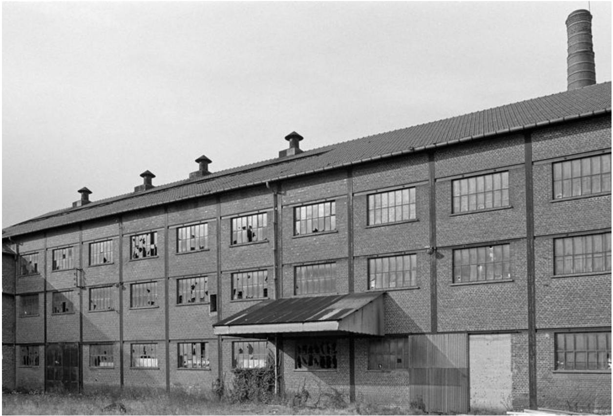
Atelier de fabrication, flanc sud.