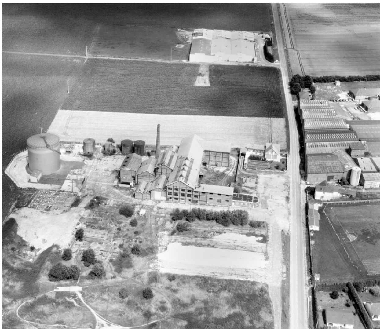
Vue aérienne, flanc ouest.