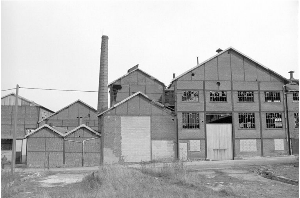
Atelier de fabrication, flanc ouest.