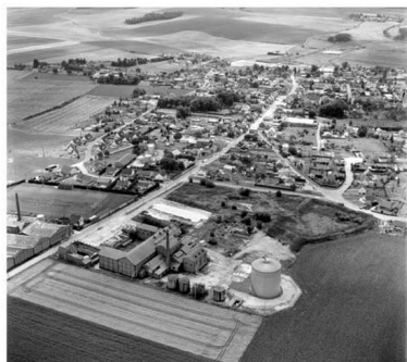
Vue aérienne, flanc est.