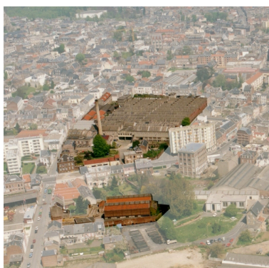
Vue aérienne de la filature Touron vers 1988-1990. Au premier plan, les entrepôts de la rue Crozat.

IVR22_20050205666NUCAB