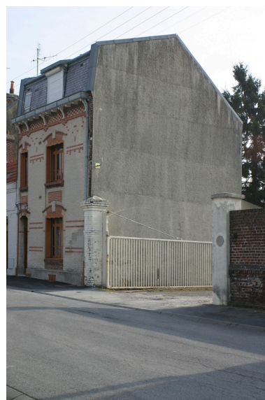
Entrée du site : la conciergerie.

IVR22_20050205669NUCAB