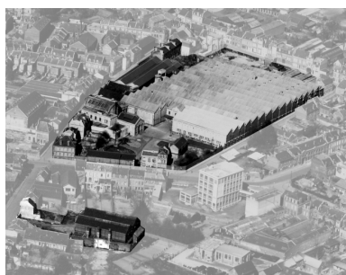
Vue aérienne du site dans les années 1930 : au premier plan, les entrepôts (BM Saint-Quentin).

Phot. Pillet Frédéric IVR22_20050205666NUCAB