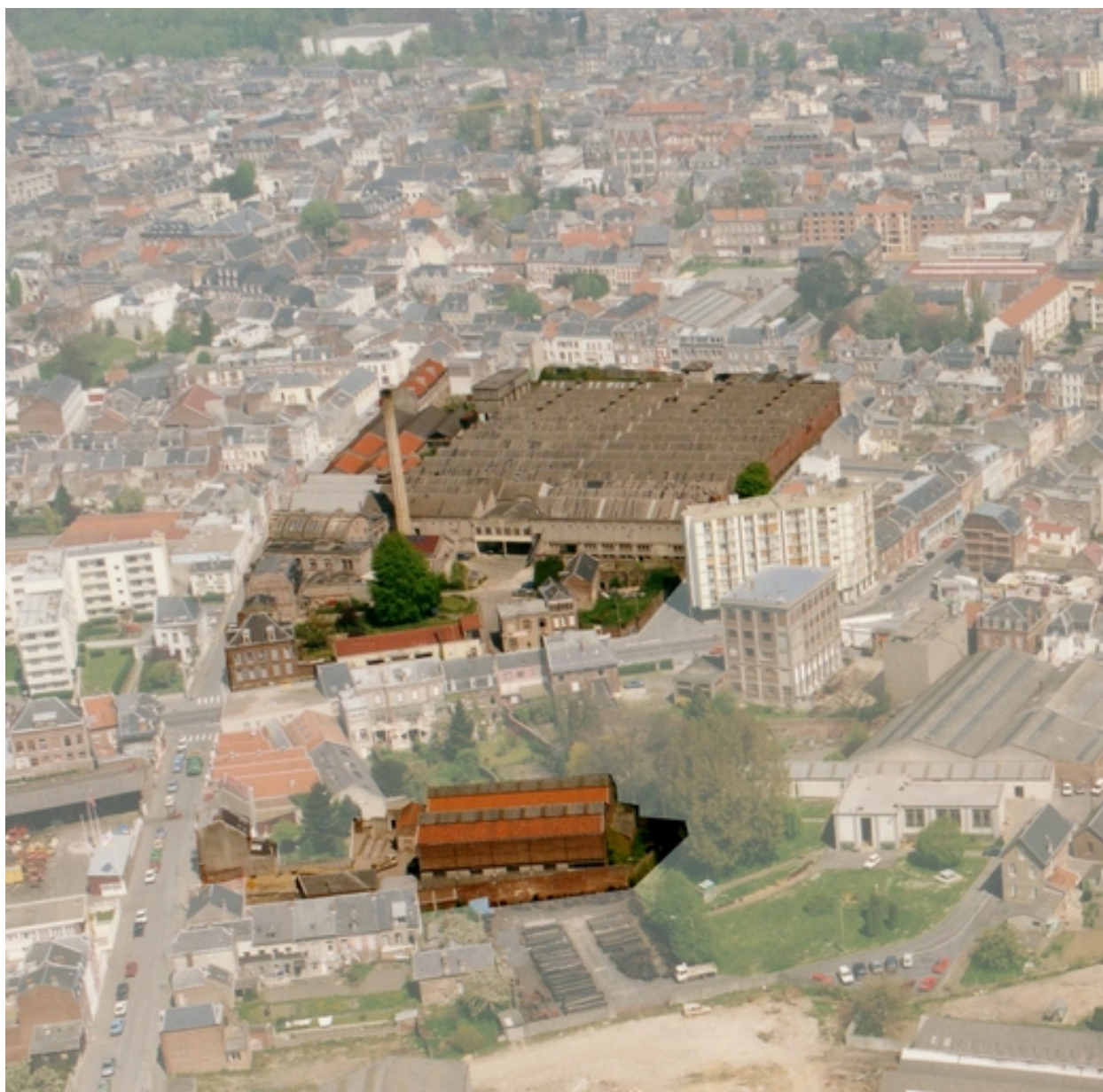
Vue aérienne de la filature Touron vers 1988-1990. Au premier plan, les entrepôts de la rue Crozat.