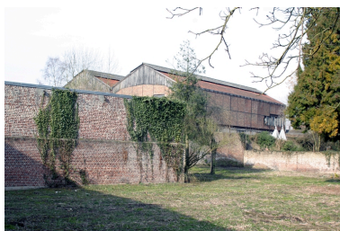
Les entrepôts vus depuis l'est.

IVR22_20050205676NUCA