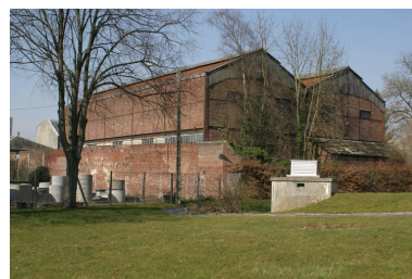
Les entrepôts vus depuis le sud-est.

IVR22_20050205677NUCA