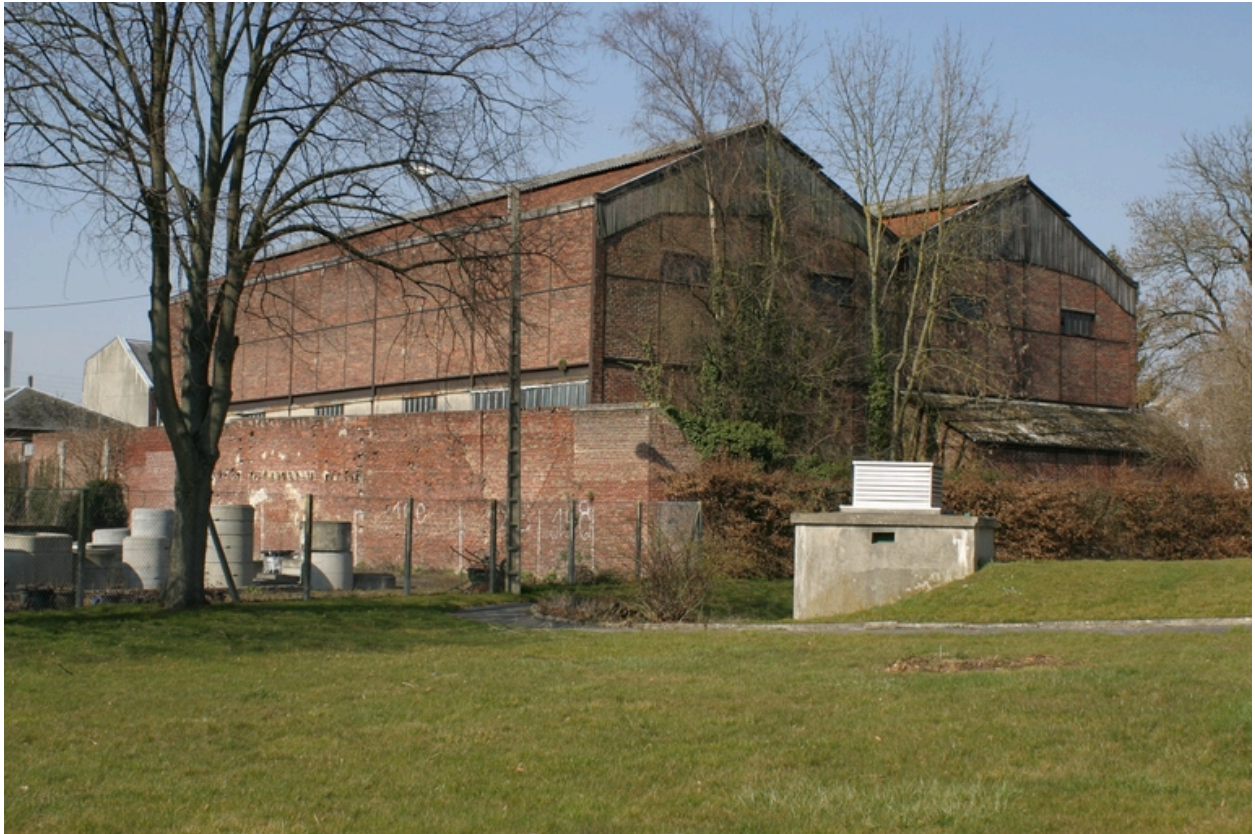
Les entrepôts vus depuis le sud-est.