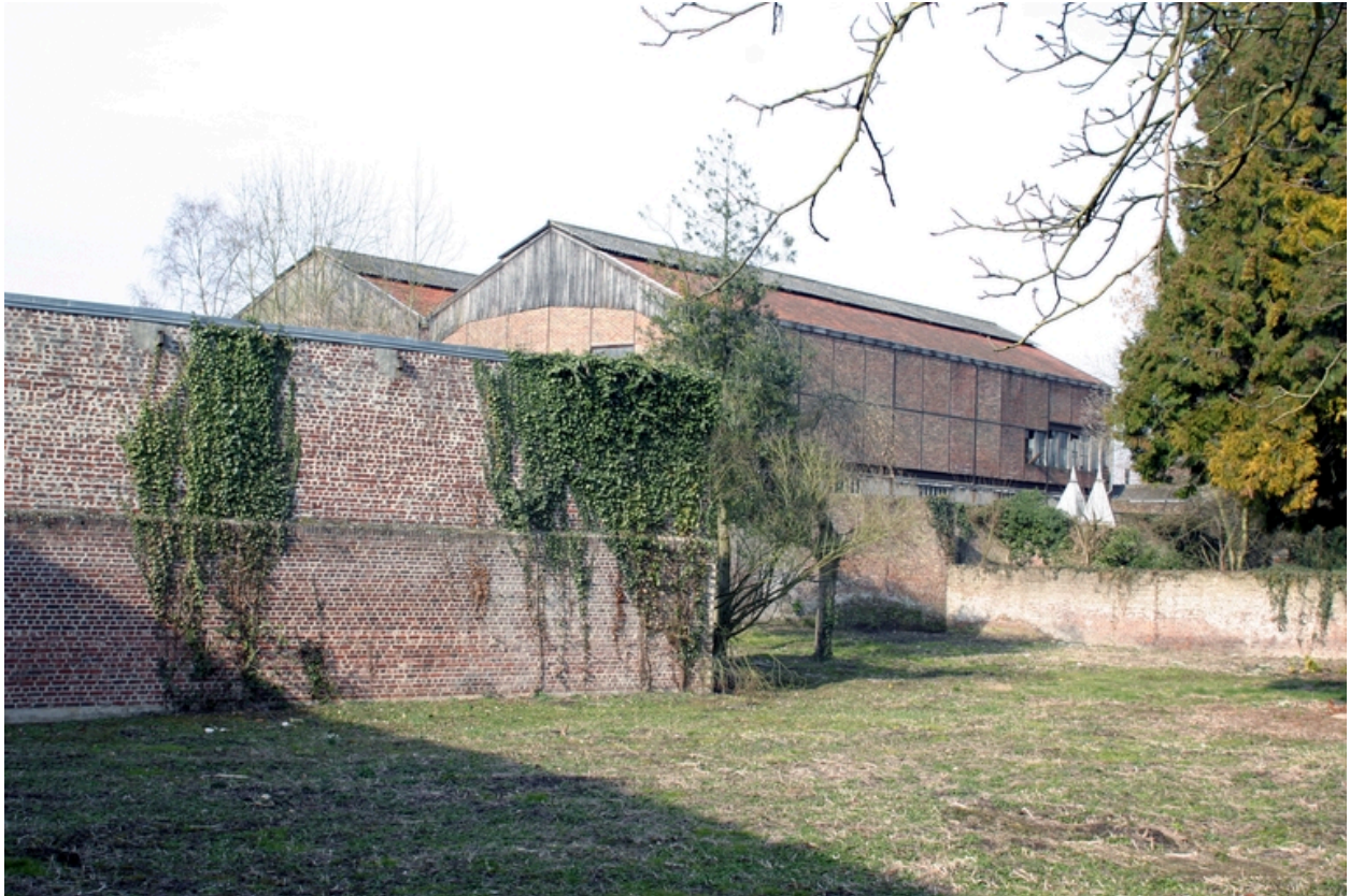
Les entrepôts vus depuis l'est.