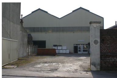
Cour et façade antérieure des entrepôts.

IVR22_20050205676NUCA