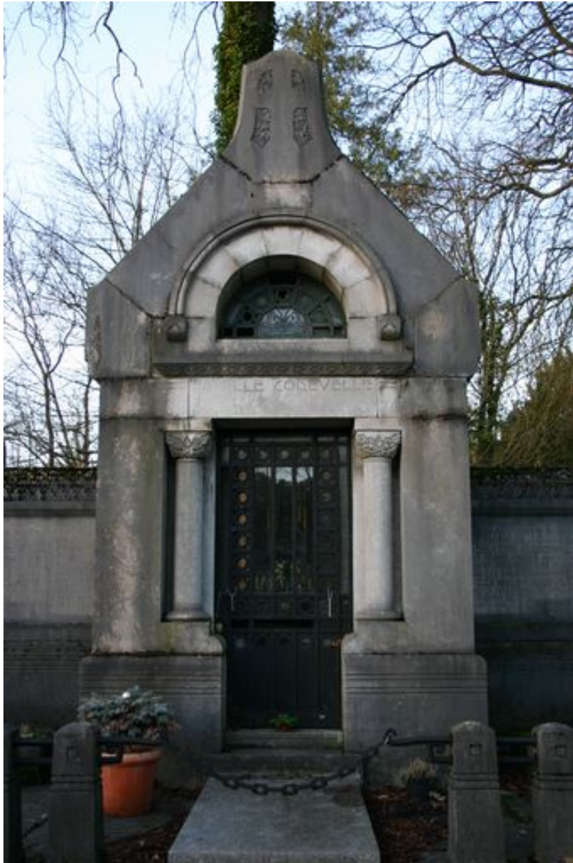
Tombeau en forme de chapelle, vue de face.