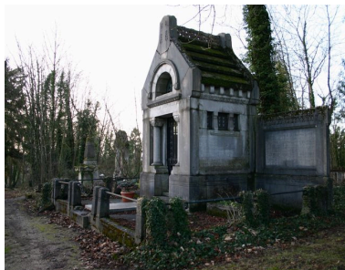
Vue générale, depuis le côté. IVR22_20098000501NUCA