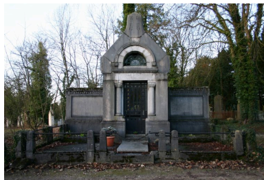
Vue générale. IVR22_20098000500NUCA