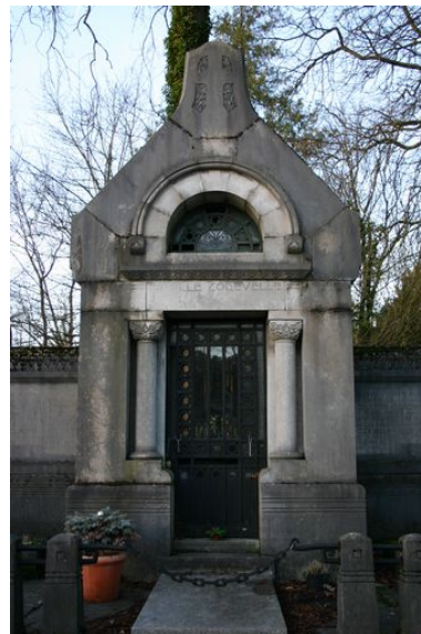
Tombeau en forme de chapelle, vue de face.