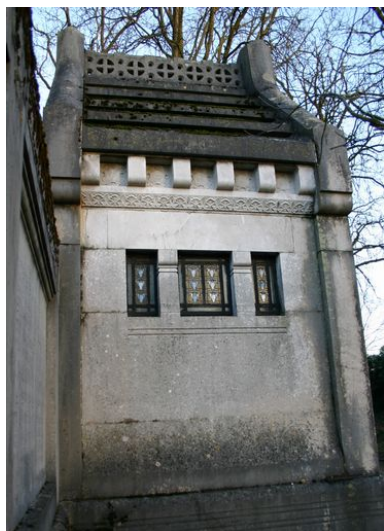
Tombeau en forme de chapelle, vue de côté.