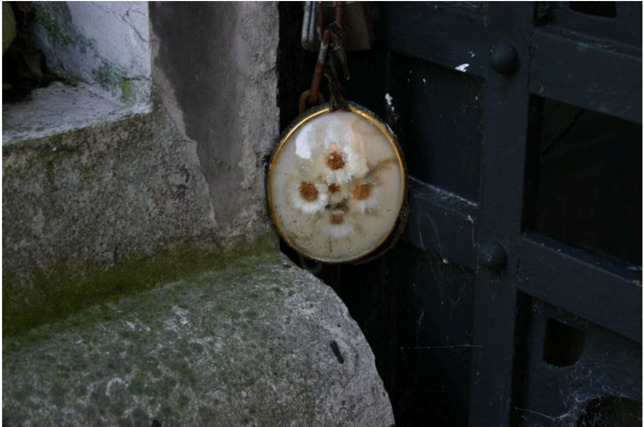
Détail du médaillon, agrémentant la chaîne fermant la porte d'entrée du tombeau-chapelle.