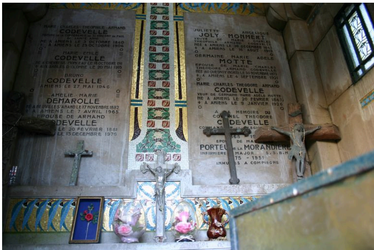
Vue intérieure partielle.