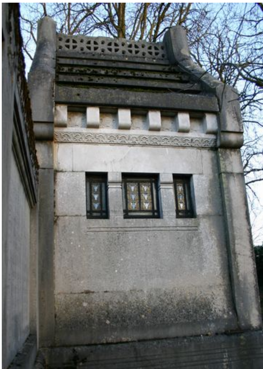
Tombeau en forme de chapelle, vue de côté.