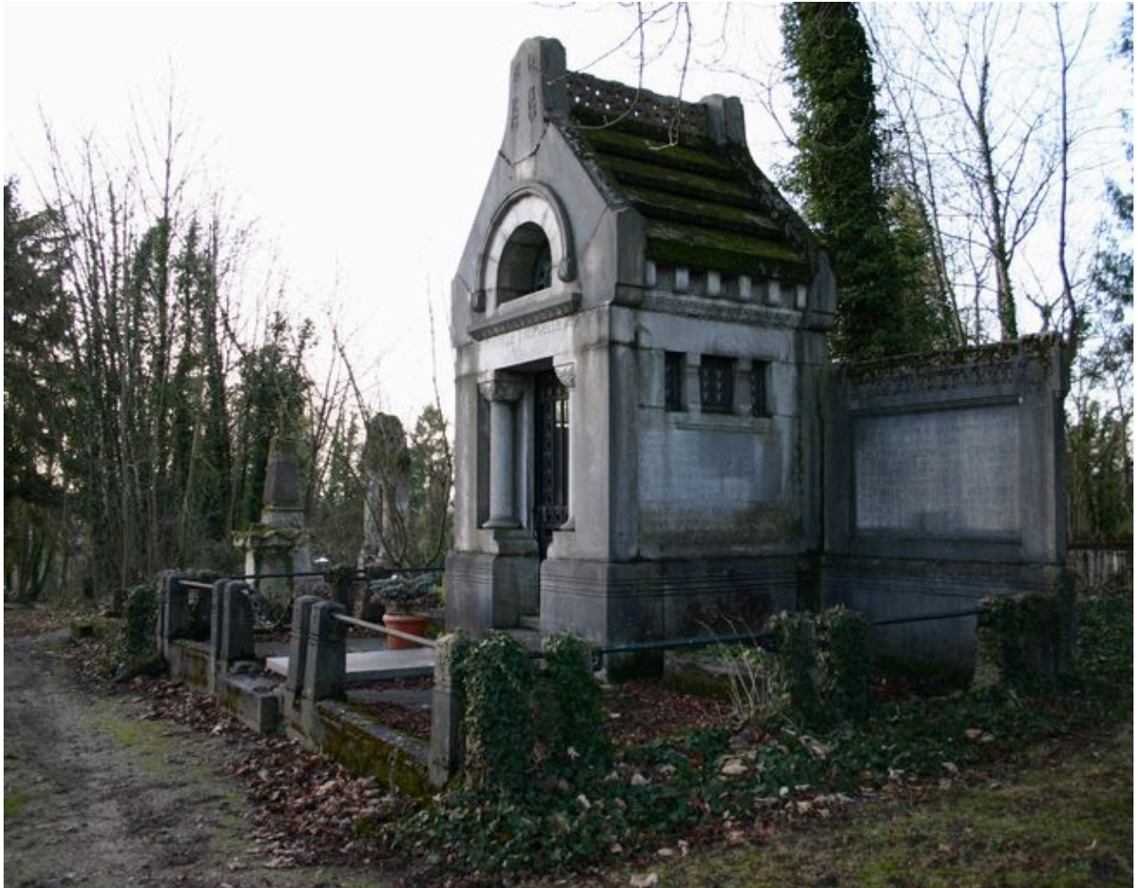
Vue générale, depuis le côté.