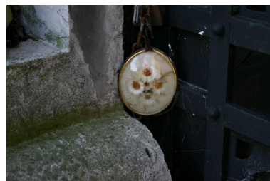
Détail du médaillon, agrémentant la chaîne fermant la porte d'entrée du tombeau-chapelle. IVR22_20098000714NUCA