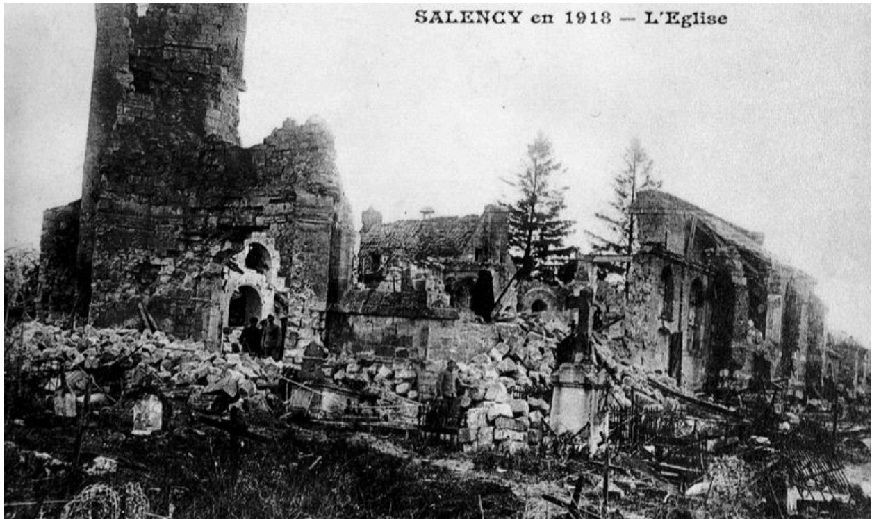
Ruines de l'église en 1918.