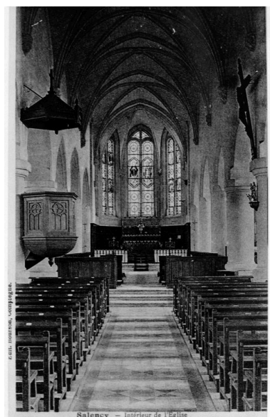
Vue intérieure vers le choeur, avant 1914 (AP). IVR22_19856000206XB