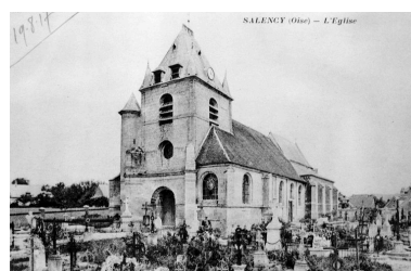
Vue générale, avant 1914