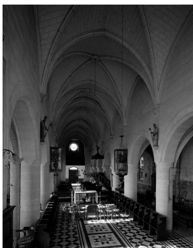
Vue intérieure vers l'entrée.