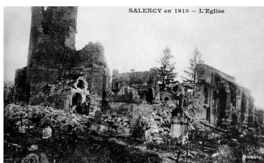
Ruines de l'église en 1918 (AP). IVR22_19856000242XB