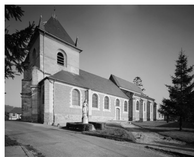
Elévation sud. IVR22_19846001320V