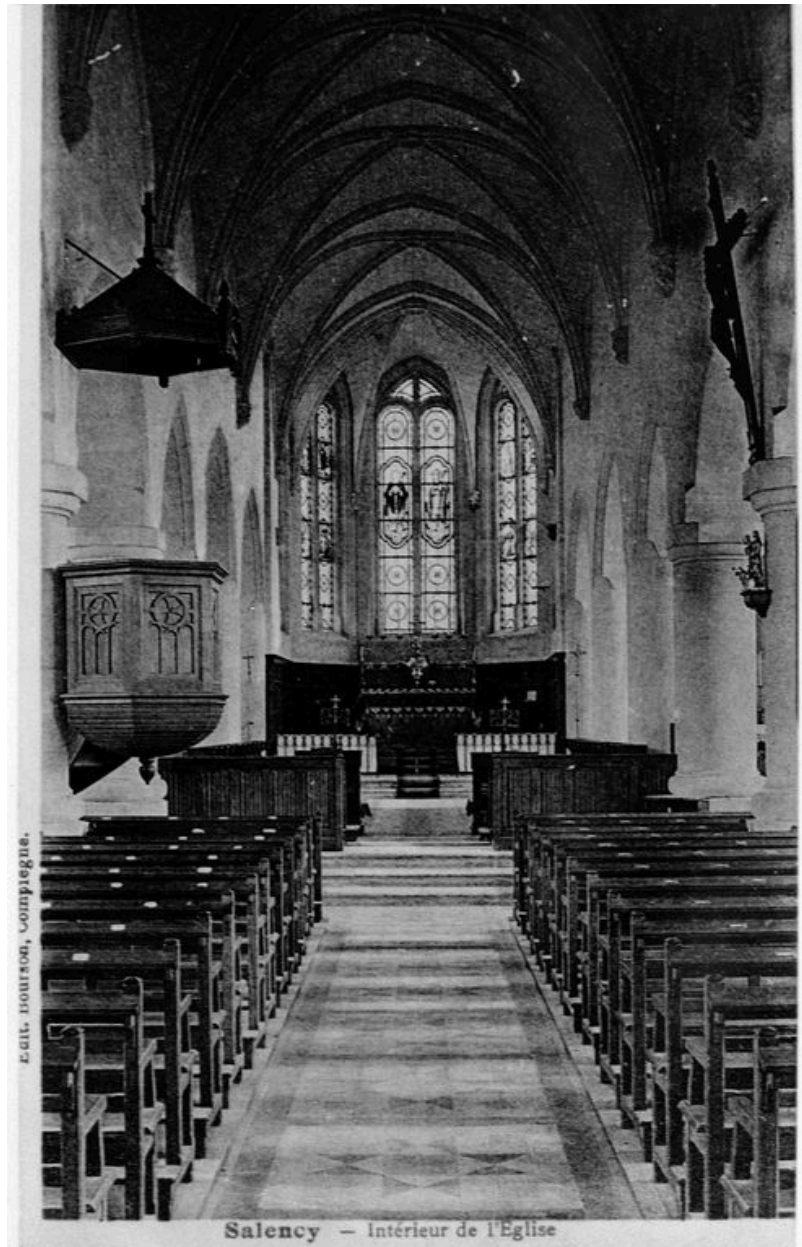
Vue intérieure vers le chœur, avant 1914 (AP).