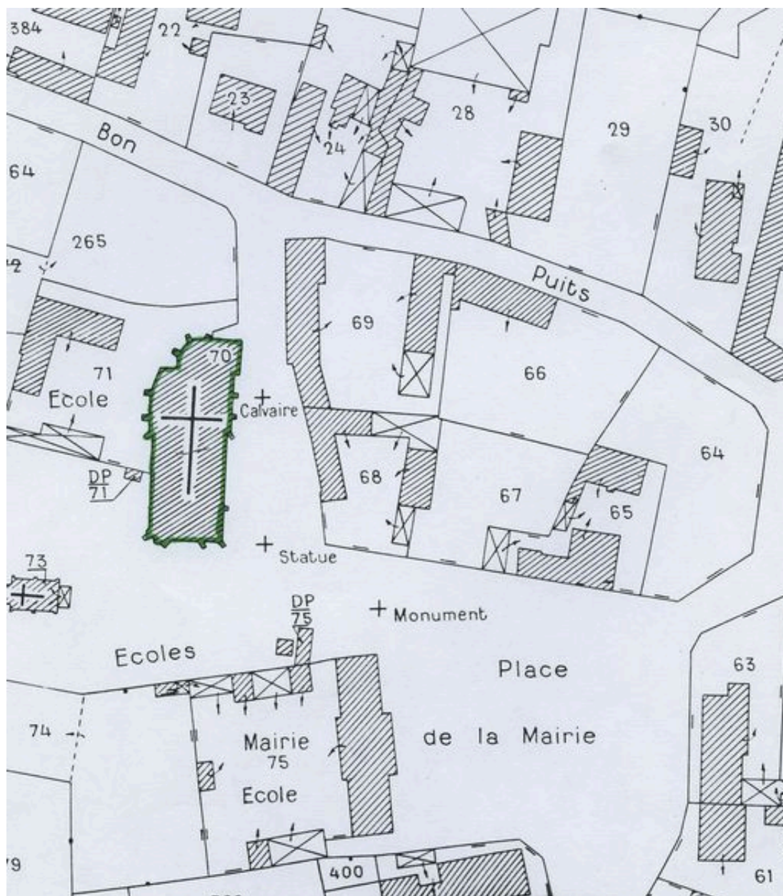
Plan de situation. Extrait du plan cadastral de 1982, section ZD 70.