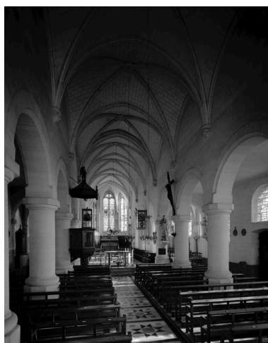
Vue intérieure vers le choeur. IVR22_19846001322V