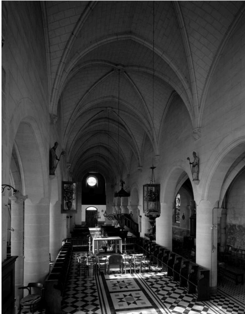
Vue intérieure vers l'entrée.