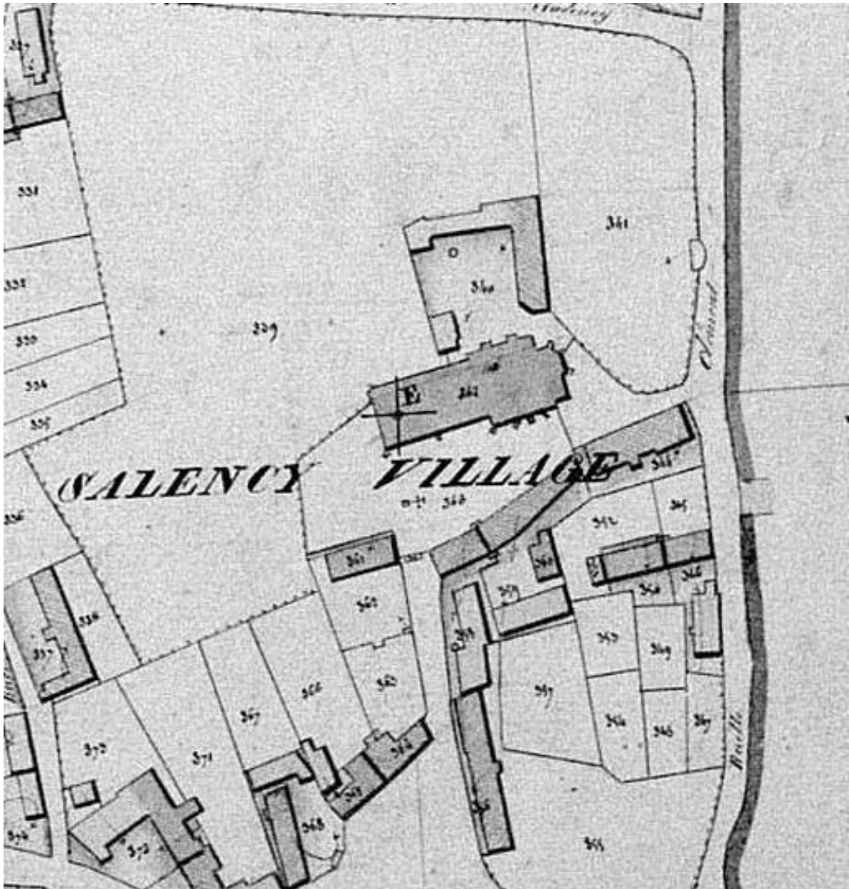
Extrait du cadastre napoléonien (DGI).