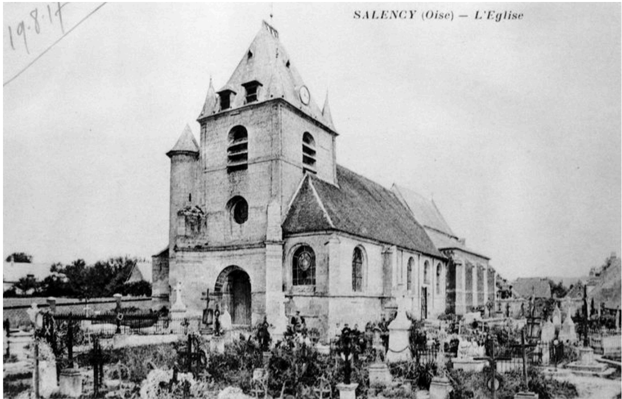
Vue générale, avant 1914 (AP).