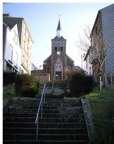
La chapelle vue depuis la rue de Saint-Valery. IVR22_20058000150XA