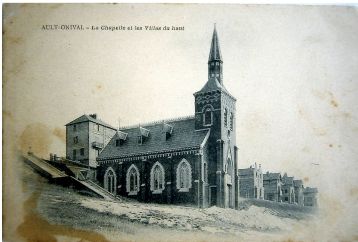
Carte postale, 1er quart 20e siècle (coll. part.).