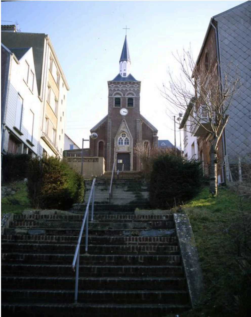
La chapelle vue depuis la rue de Saint-Valery.