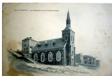
Carte postale, 1er quart 20e siècle (coll. part.). IVR22_20058000605XAB