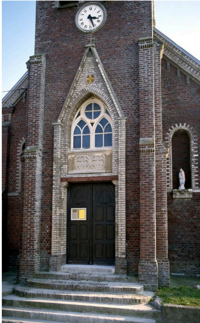
Détail de la façade occidentale.