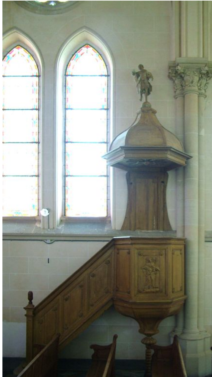
Chaire à prêcher, chêne, 4e quart du 19e siècle.