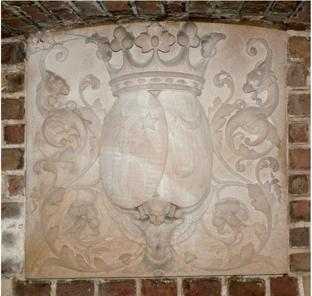
Bas-relief de la crypte aux armoiries d'alliance des familles de Sauzay et des Essarts.