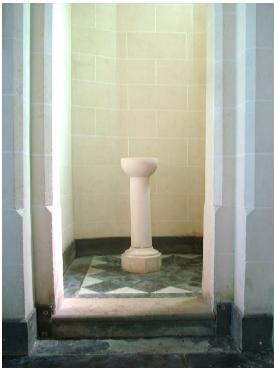
Fonts baptismaux, calcaire, 4e quart du 19e siècle.