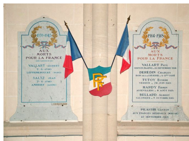
Tableaux commémoratifs des morts des deux guerres mondiales, marbre, 1ère moitié du 20e siècle. IVR22_20108001729NUCA