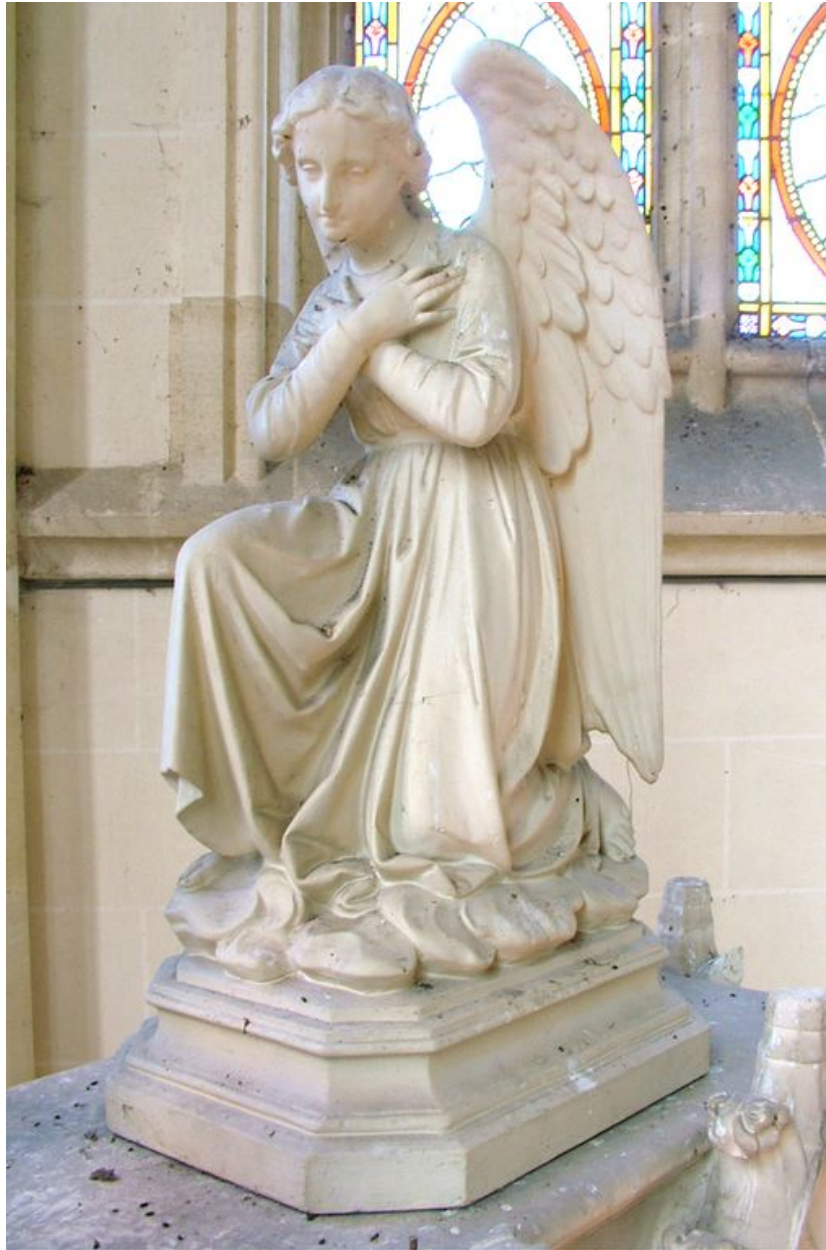
Statue : un des deux anges adoreurs surmontant le maître-autel, plâtre, 4e quart du 19e siècle.