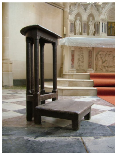
Tabouret de chantre, chêne, 19e siècle. IVR22_20108001719NUCA