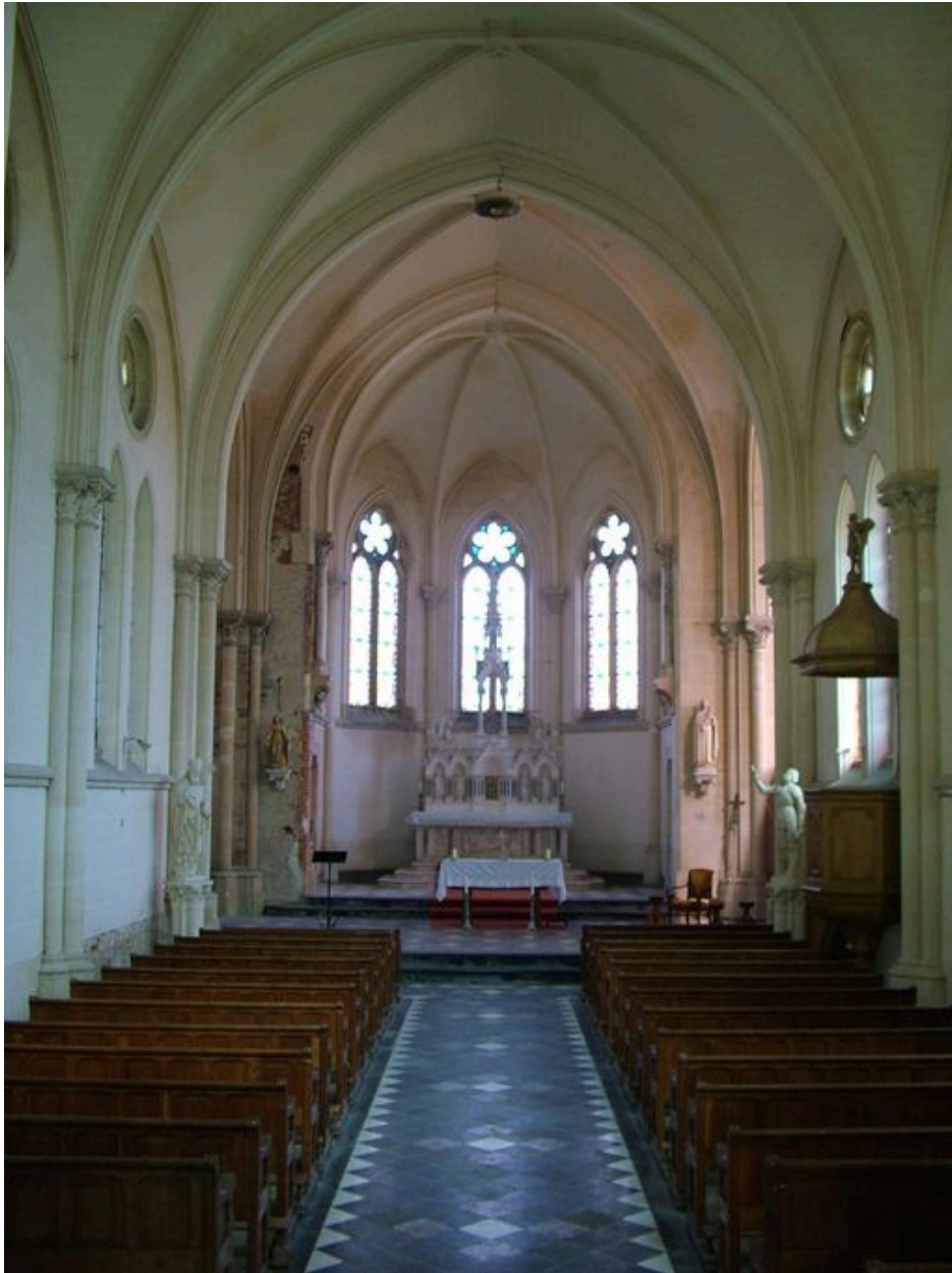
Vue générale de l'intérieur de l'église.