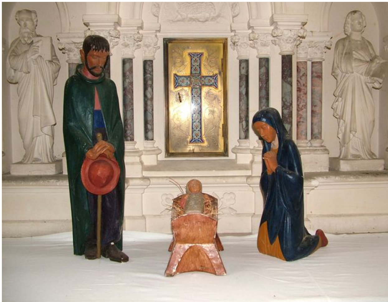
Crèche, signée F. P., plâtre polychrome, 4e quart du 20e siècle.