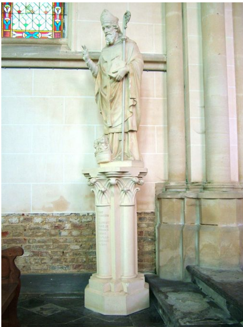
Statue : saint Nicolas et son socle, plâtre, 2e quart du 20e siècle.