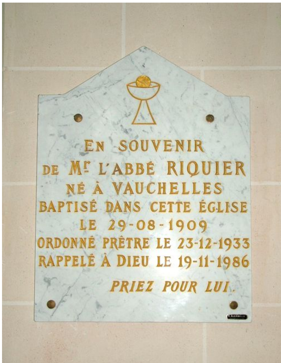
Plaque commémorative de l'abbé Riquier, marbre, 4e quart du 20e siècle.