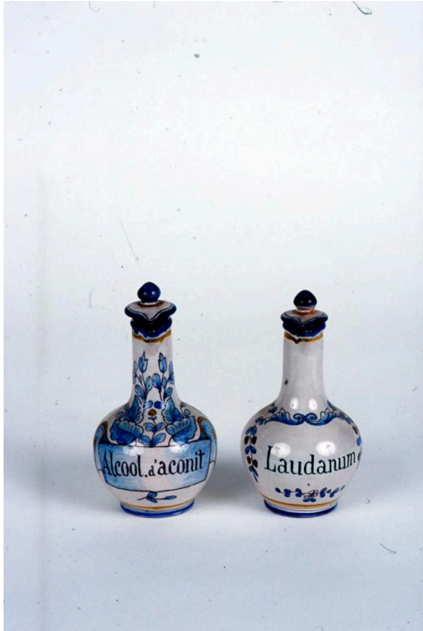
Vue d'ensemble de 2 des 9 bouteilles de pharmacie, ces exemplaires contenant respectivement de l'alcool d'aconit et du laudanum.