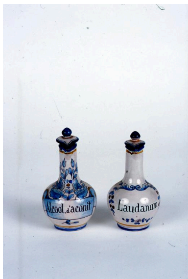
Vue d'ensemble de 2 des 9 bouteilles de pharmacie, ces exemplaires contenant respectivement de l'alcool d'aconit et du laudanum.