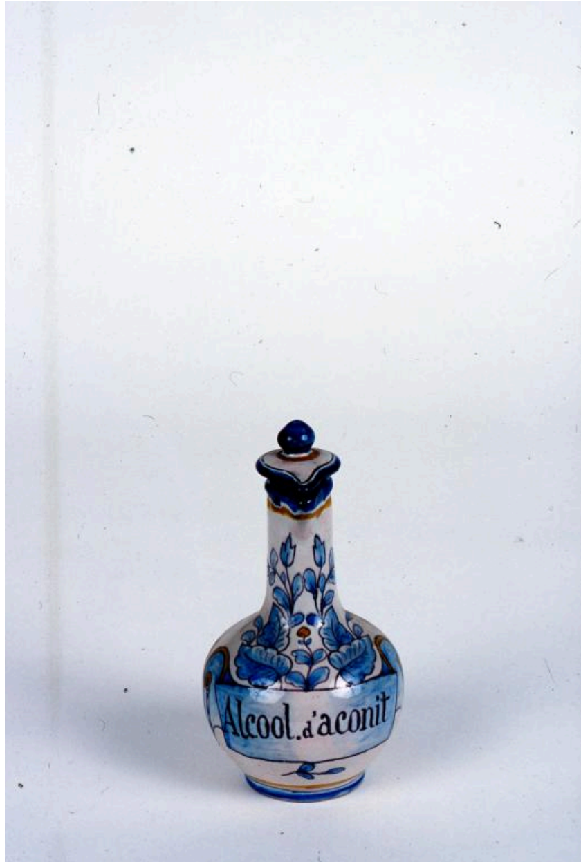
Vue générale d'une des 9 bouteilles de pharmacie, cet exemplaire contenant de l'alcool d'aconit.