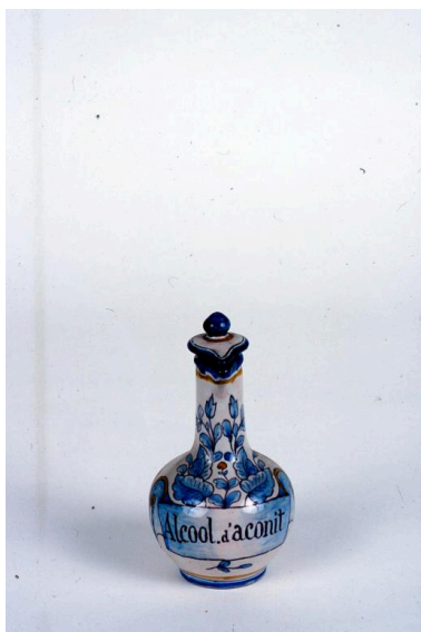
Vue générale d'une des 9 bouteilles de pharmacie, cet exemplaire contenant de l'alcool d'aconit. IVR21_20045900274ZA