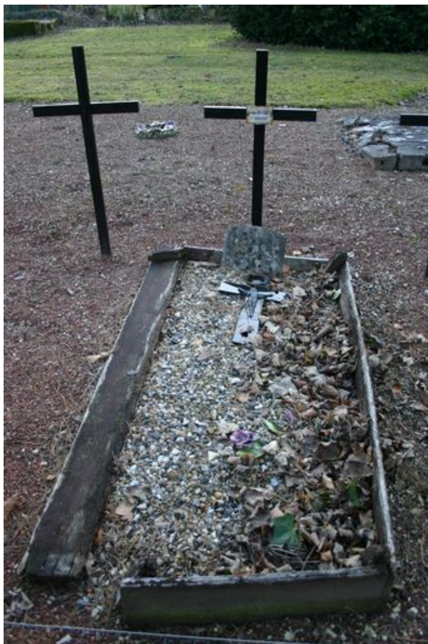
Monument particulier d'une des victimes civiles du bombardement de 1944 : croix funéraire.