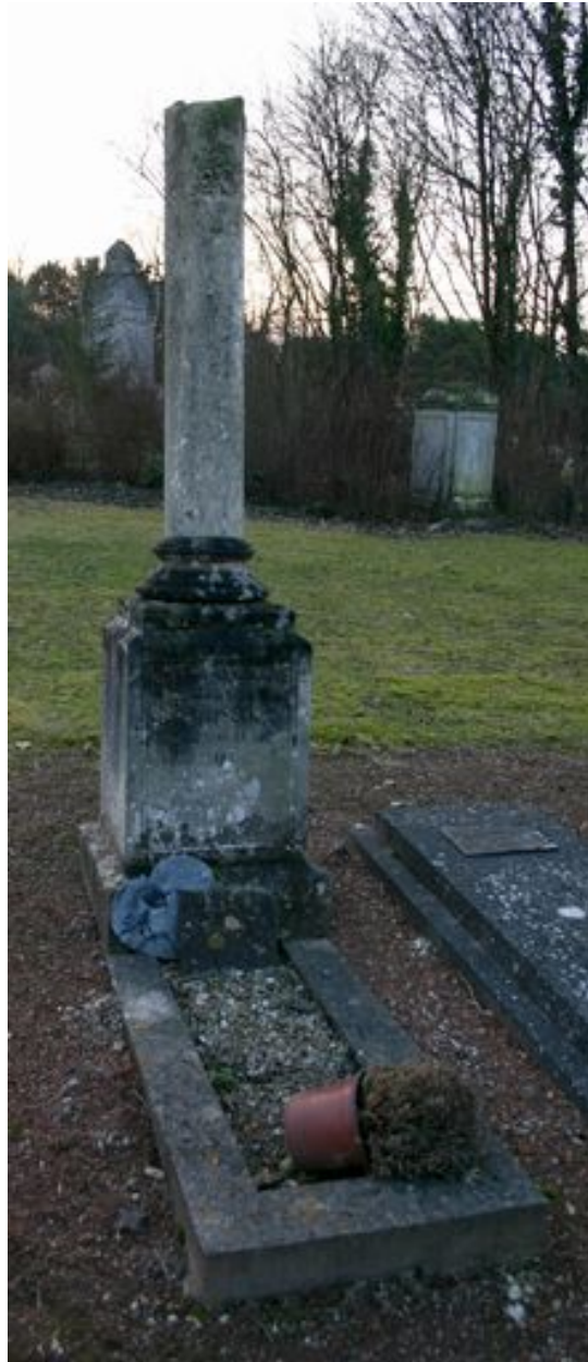
Monument particulier d'une des victimes civiles du bombardement de 1944 : colonne funéraire.