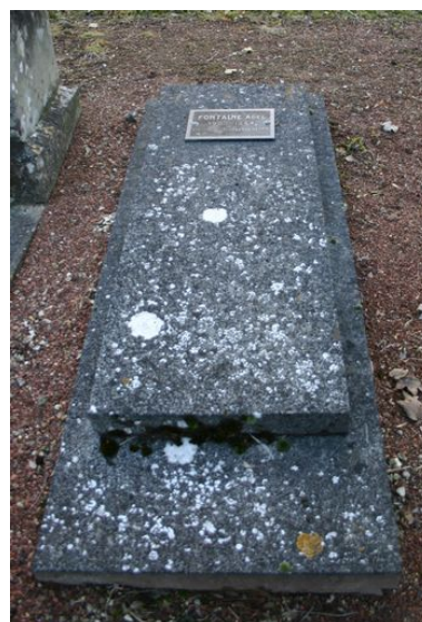
Monument particulier d'une des victimes civiles du bombardement de 1944 : dalle funéraire. IVR22_20088000908NUCA