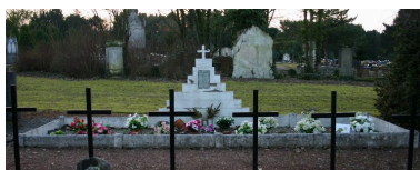
Monument particulier d'une famille victime civile du bombardement de 1944 : stèle de forme pyramidale. IVR22_20088000910NUCA