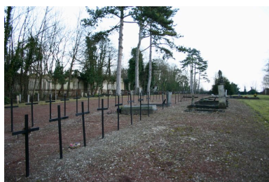
Vue générale, vers l'est. IVR22_20088000906NUCA