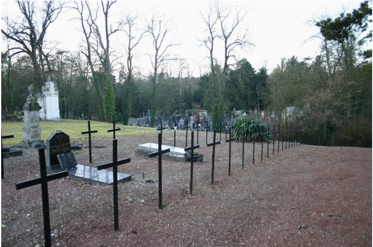
Vue vers le sud-ouest.