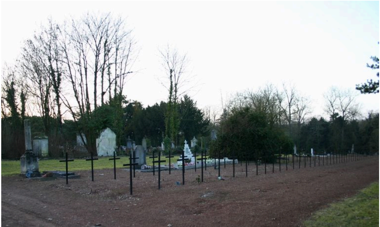
Vue générale, vers le sud-ouest.