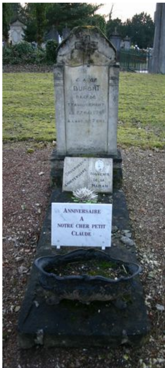
Monument particulier d'une des victimes civiles du bombardement de 1944 : stèle en granito.