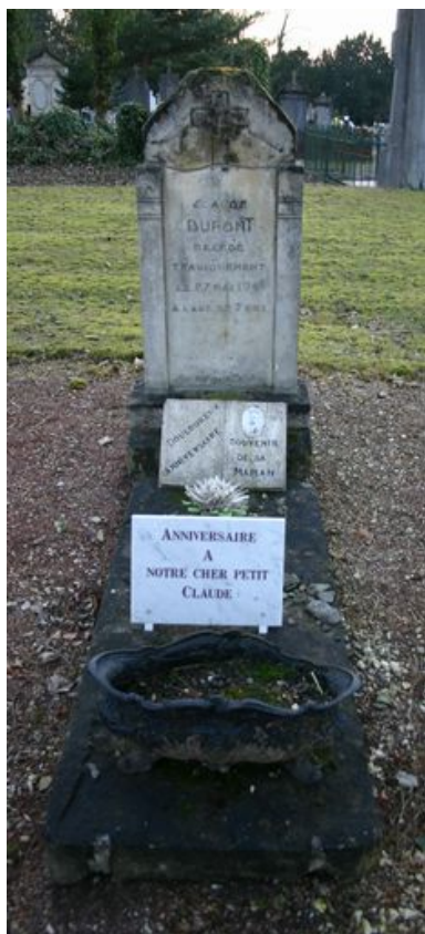
Monument particulier d'une des victimes civiles du bombardement de 1944 : stèle en granito.