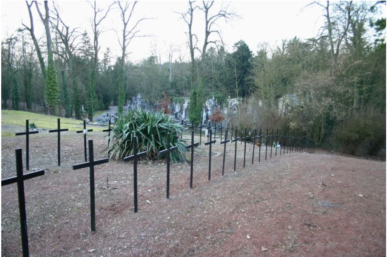
Vue vers l'ouest.