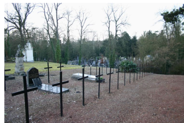
Vue vers le sud-ouest. IVR22_20088000902NUCA