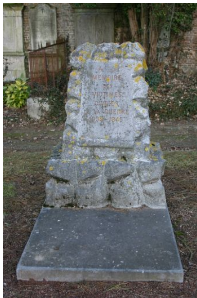
Monument commémoratif des victimes civiles du bombardement de 1944.