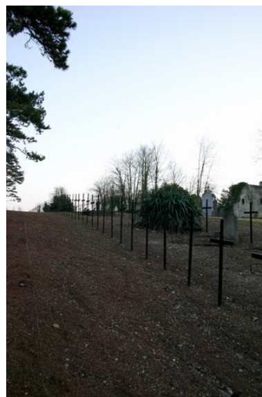
Vue vers l'est. IVR22_20088000905NUCA