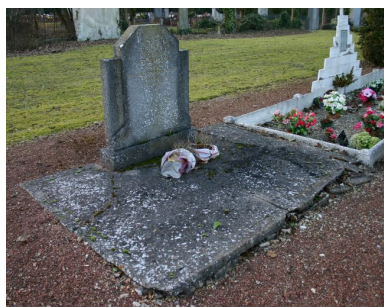
Monument particulier d'une des victimes civiles du bombardement de 1944 : stèle en granito. IVR22_20088000909NUCA