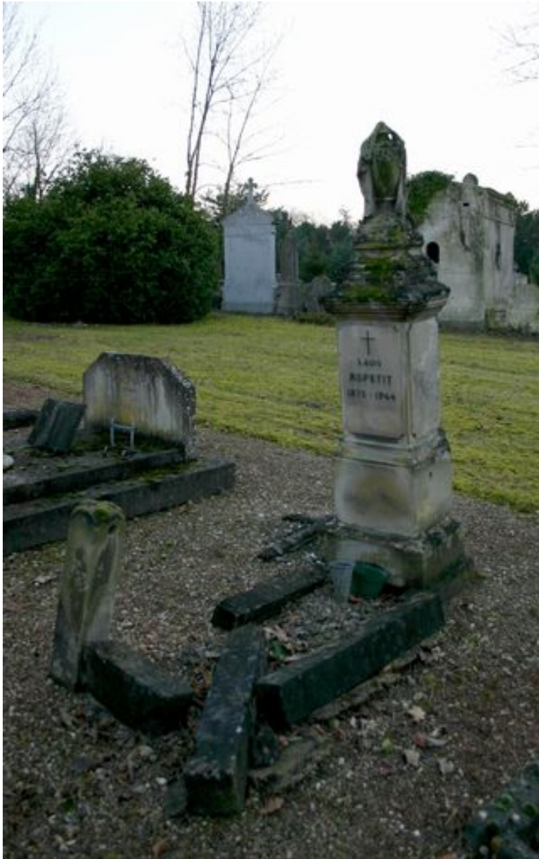
Monument particulier d'une des victimes civiles du bombardement de 1944 : cipe.