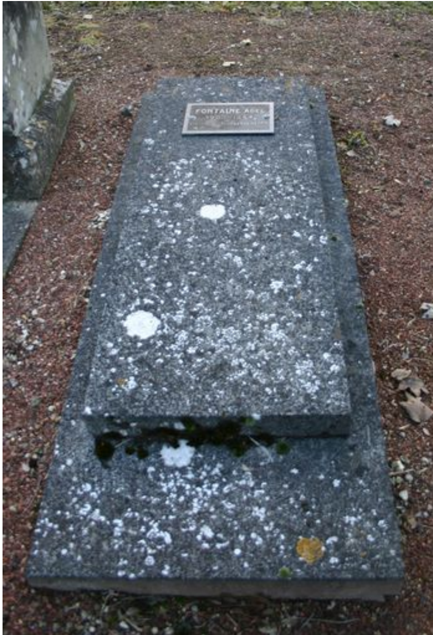
Monument particulier d'une des victimes civiles du bombardement de 1944 : dalle funéraire.