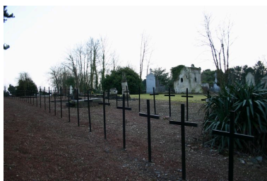
Vue générale, vers l'est. IVR22_20088000904NUCA