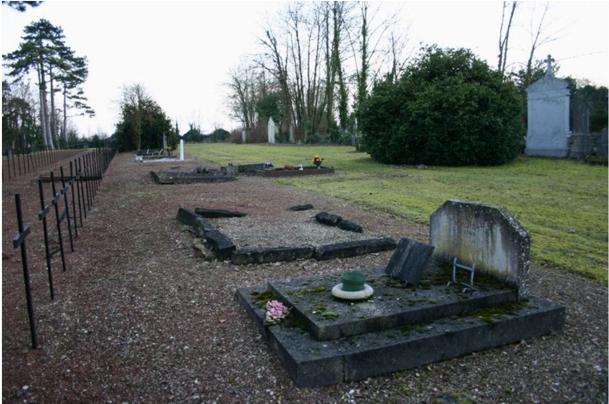
Monuments particuliers de victimes civiles du bombardement de 1944 : vue vers l'est.