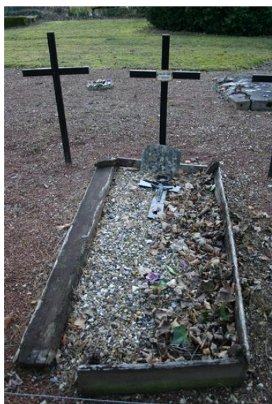
Monument particulier d'une des victimes civiles du bombardement de 1944 : croix funéraire.