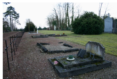
Monuments particuliers de victimes civiles du bombardement de 1944 : vue vers l'est. IVR22_20088000911NUCA