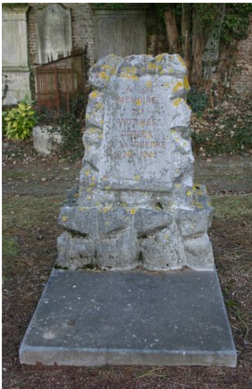
Monument commémoratif des victimes civiles du bombardement de 1944.