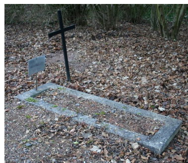
Monuments particuliers de victimes civiles du bombardement de 1944.