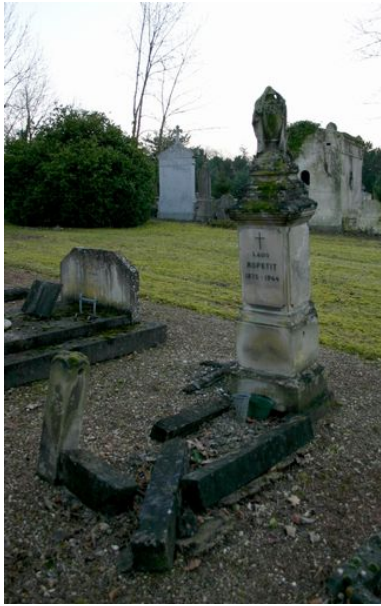
Monument particulier d'une des victimes civiles du bombardement de 1944 : cippe.