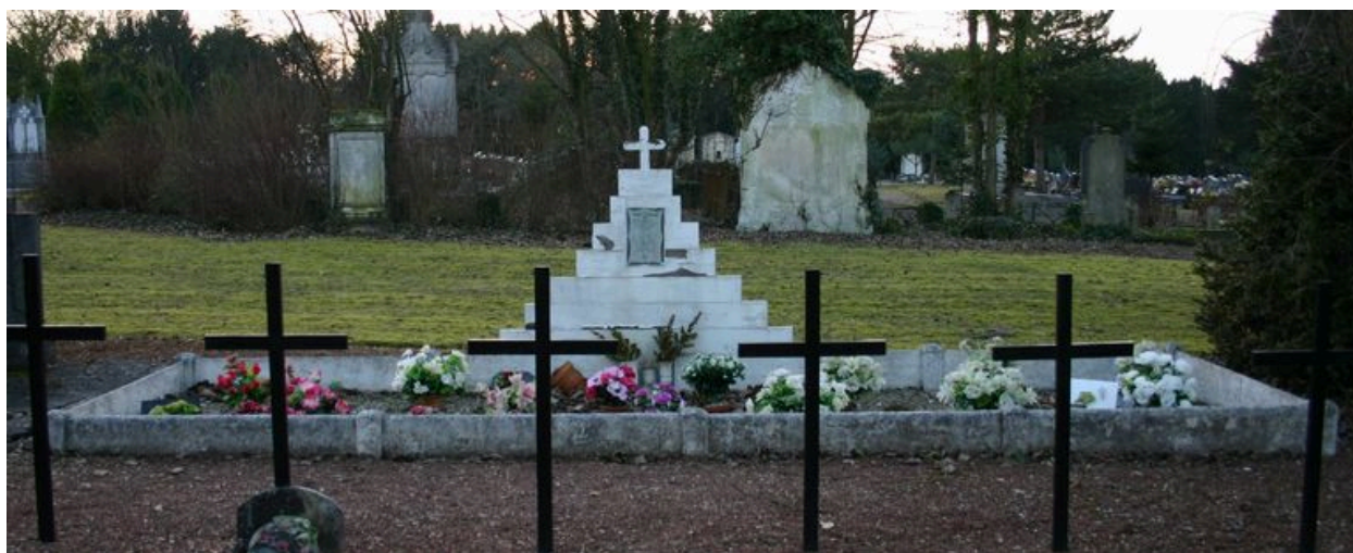
Monument particulier d'une famille victime civile du bombardement de 1944 : stèle de forme pyramidale.