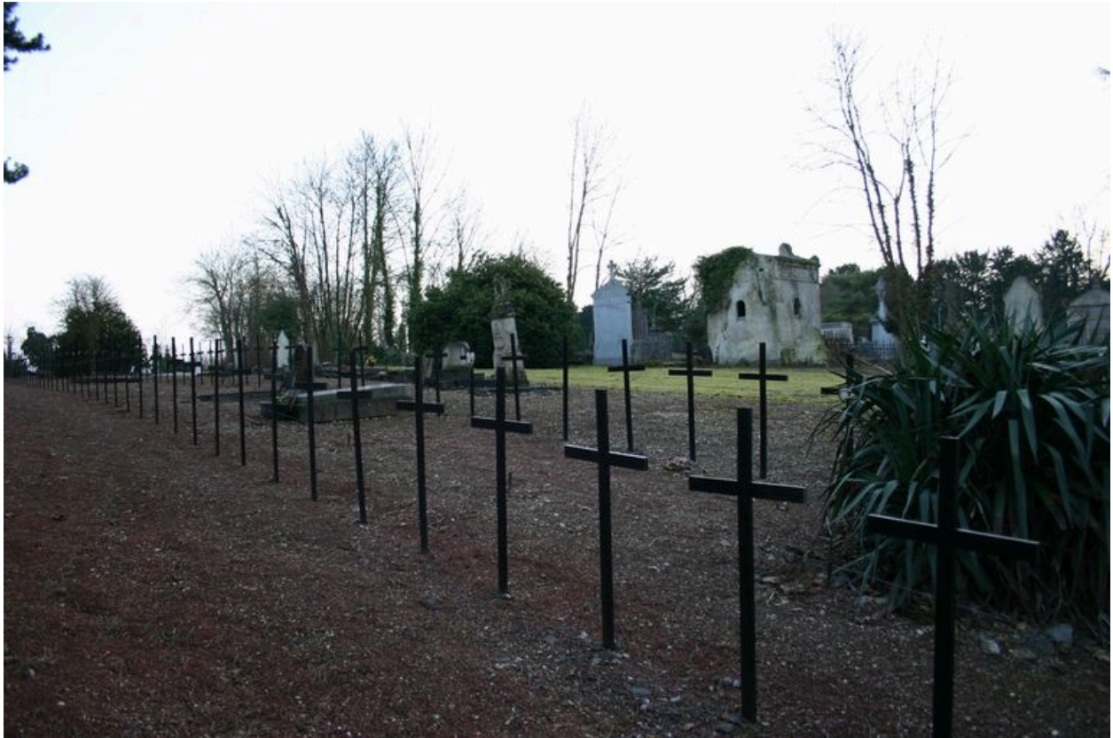
Vue générale, vers l'est.