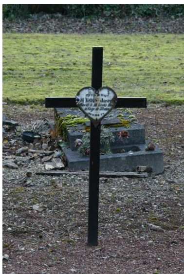
Monument particulier d'une des victimes civiles du bombardement de 1944 : croix funéraire.