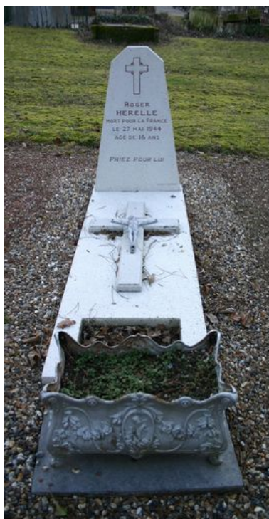
Monument particulier d'une des victimes civiles du bombardement de 1944 : stèle en granito. IVR22_20088000913NUCA