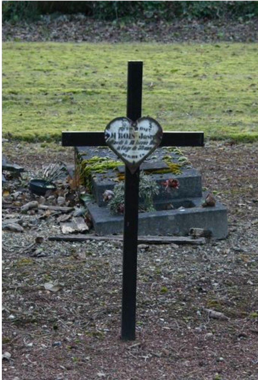
Monument particulier d'une des victimes civiles du bombardement de 1944 : croix funéraire.