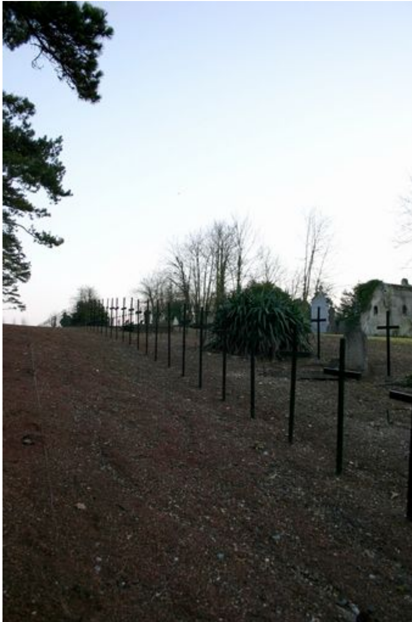
Vue vers l'est.