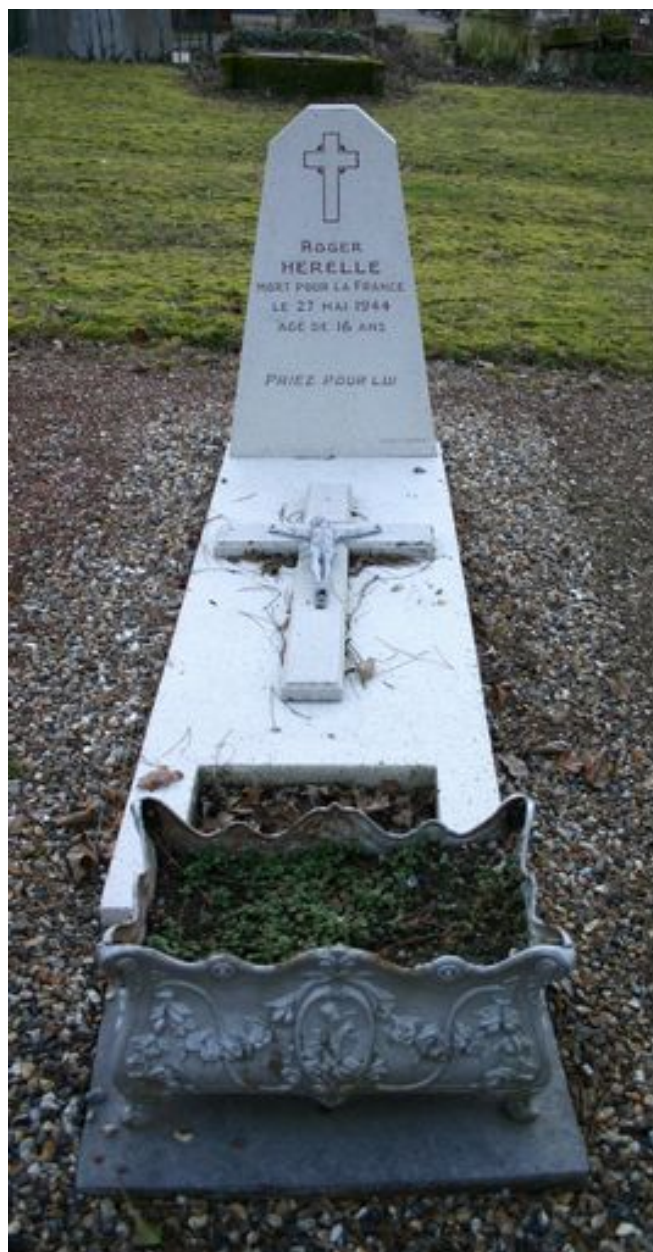
Monument particulier d'une des victimes civiles du bombardement de 1944 : stèle en granito.