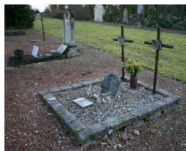
Monuments particuliers de victimes civiles du bombardement de 1944.