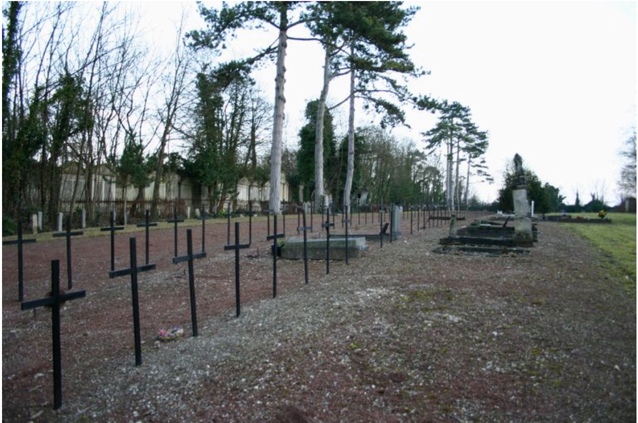
Vue générale, vers l'est.