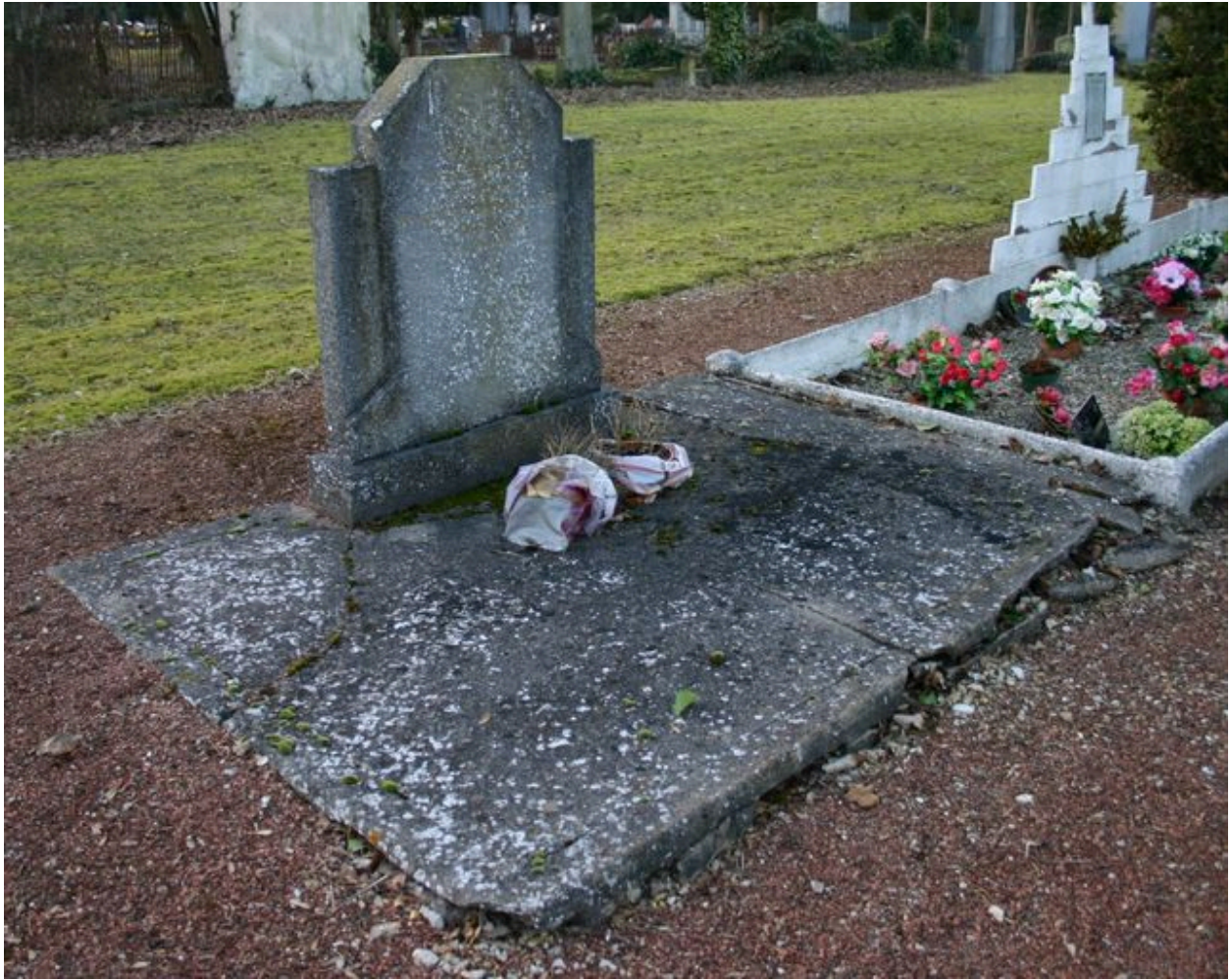
Monument particulier d'une des victimes civiles du bombardement de 1944 : stèle en granito.