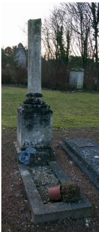
Monument particulier d'une des victimes civiles du bombardement de 1944 : colonne funéraire. IVR22_20088000907NUCA