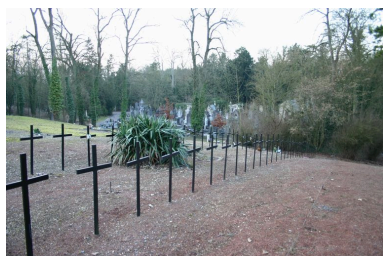
Vue vers l'ouest.