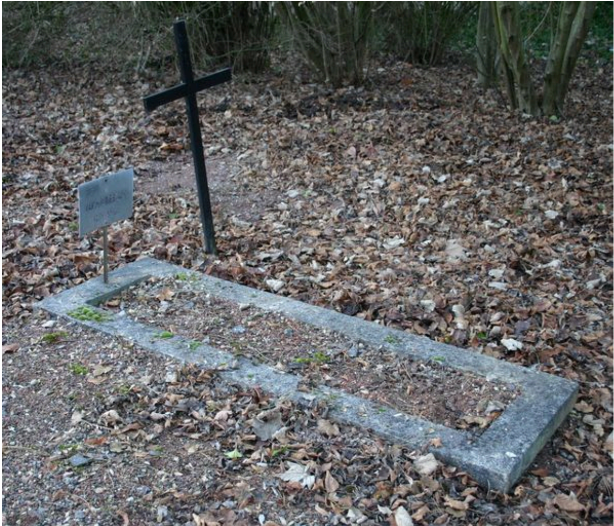
Monuments particuliers de victimes civiles du bombardement de 1944.