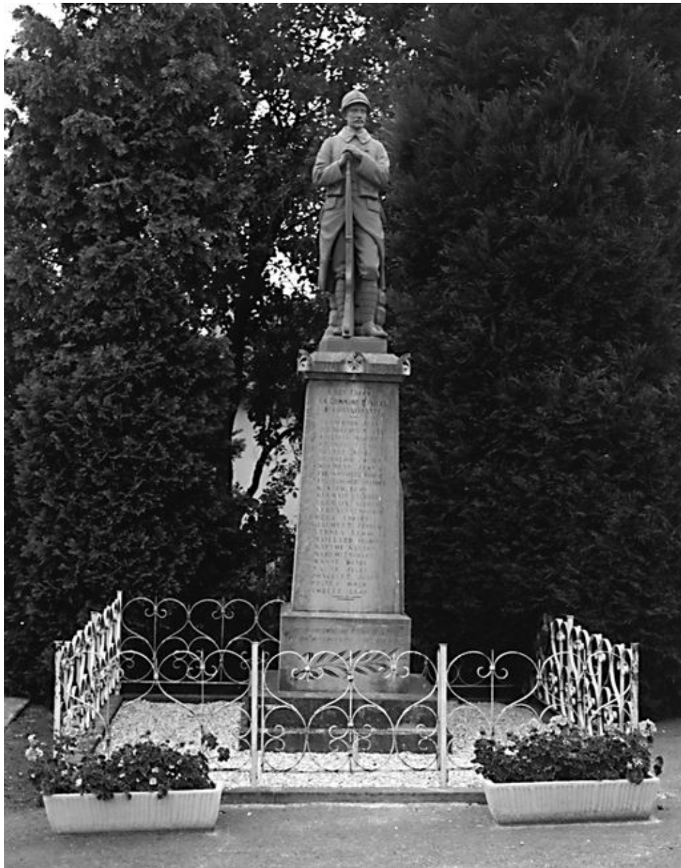
Iviers. Monument aux morts réalisé par François Laffineur, 1921.