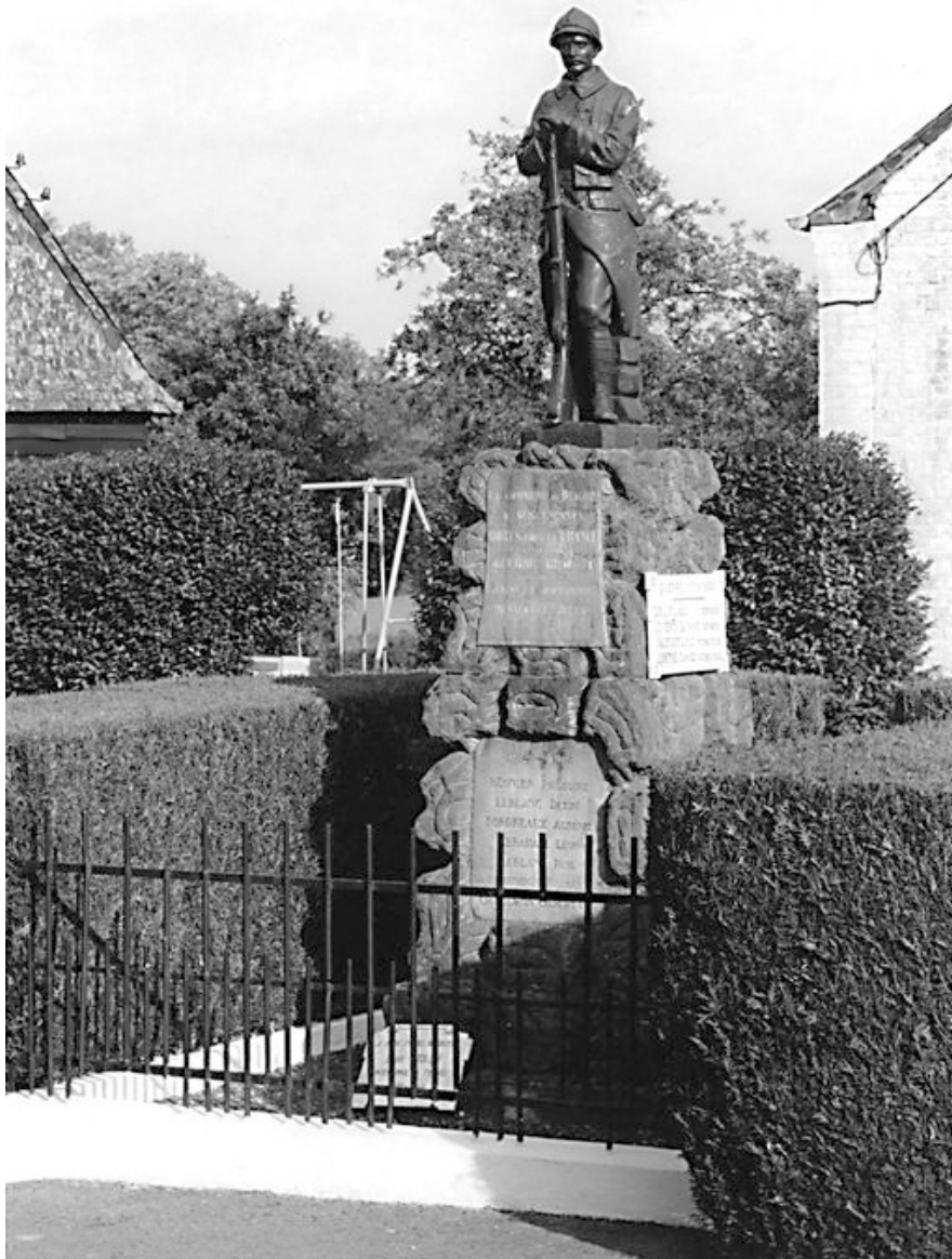
Beaumé. Monument aux morts, rue de l'Eglise.