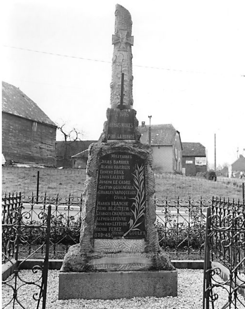
Mont-Saint-Jean. Monument aux morts de la guerre 1914-1918, rue Jean-Mermoz.