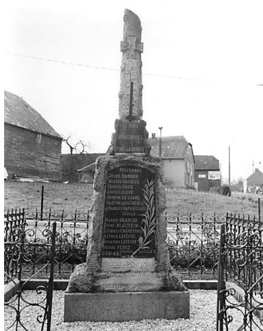
Mont-Saint-Jean. Monument aux morts de la guerre 1914-1918, rue Jean-Mermoz.