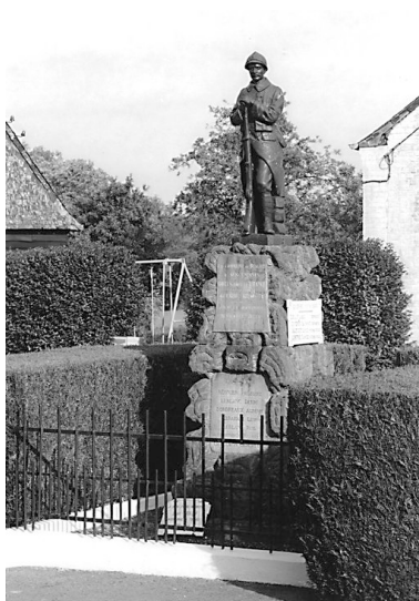
Beaumé. Monument aux morts, rue de l'Eglise.