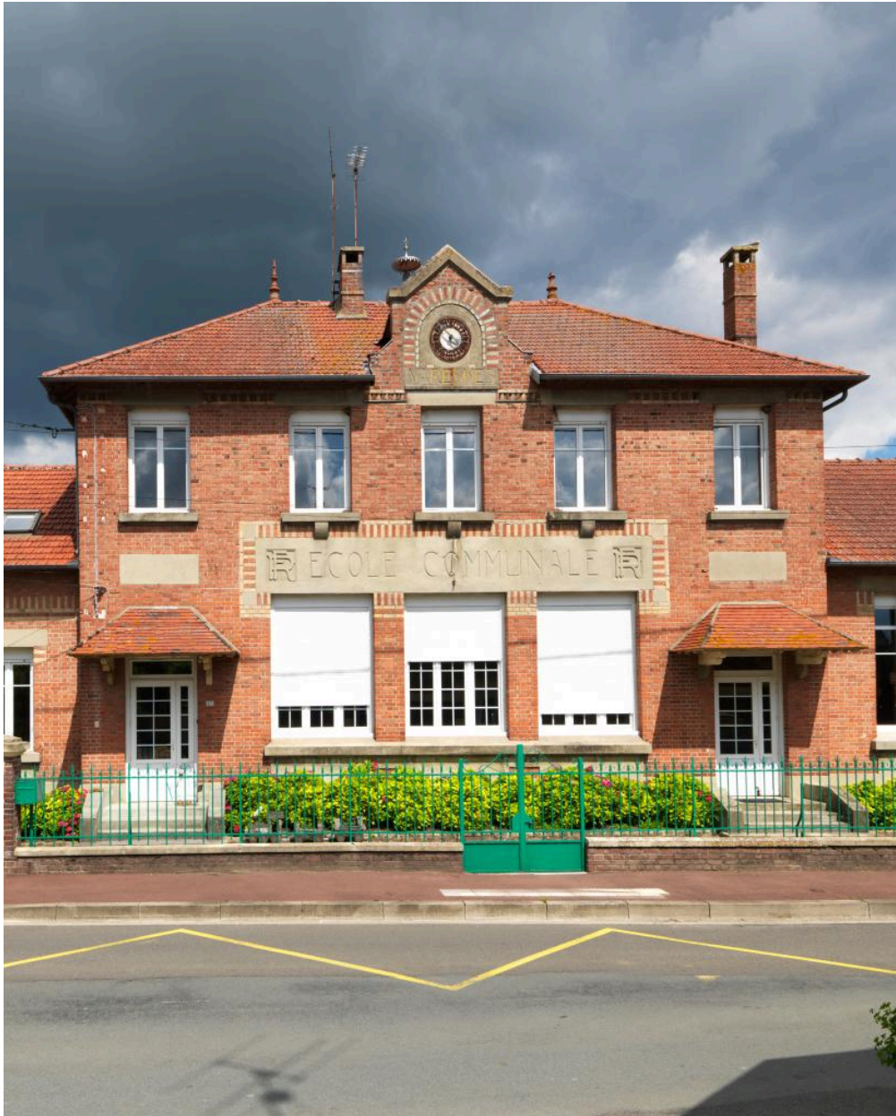
Vue du pavillon central.