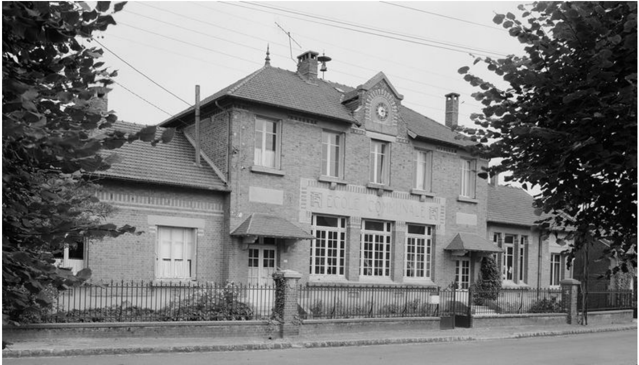
Elévation antérieure, en 1984.