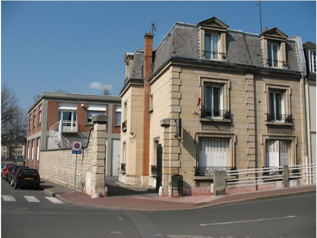
Bâtiments administratifs des établissements Willot.