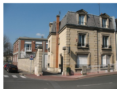
Bâtiments administratifs des établissements Willot.

Phot. Clarisse Lorieux (reproduction) IVR22_20076005149NUCAB