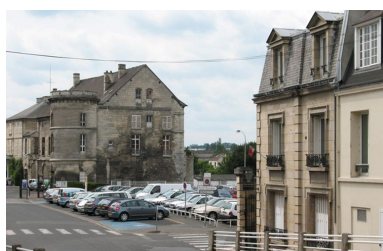
Emplacement des anciens entrepôts Willot.

IVR22_20076005242NUCA