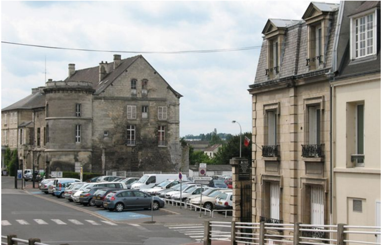
Emplacement des anciens entrepôts Willot.