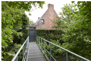
Passerelle enjambant le fossé en eau de la propriété. Pignon ouest.