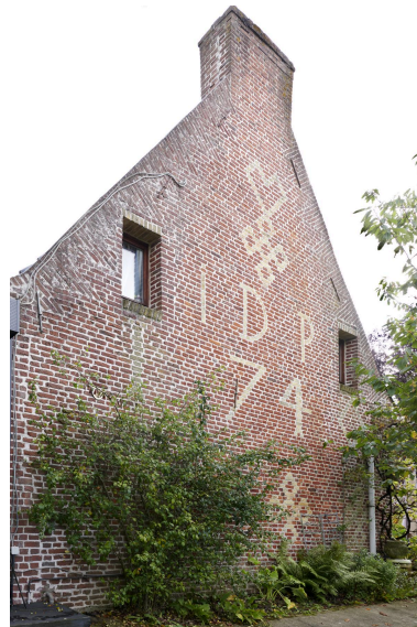
Détail du pignon ouest. IVR32_20245903128NUCA