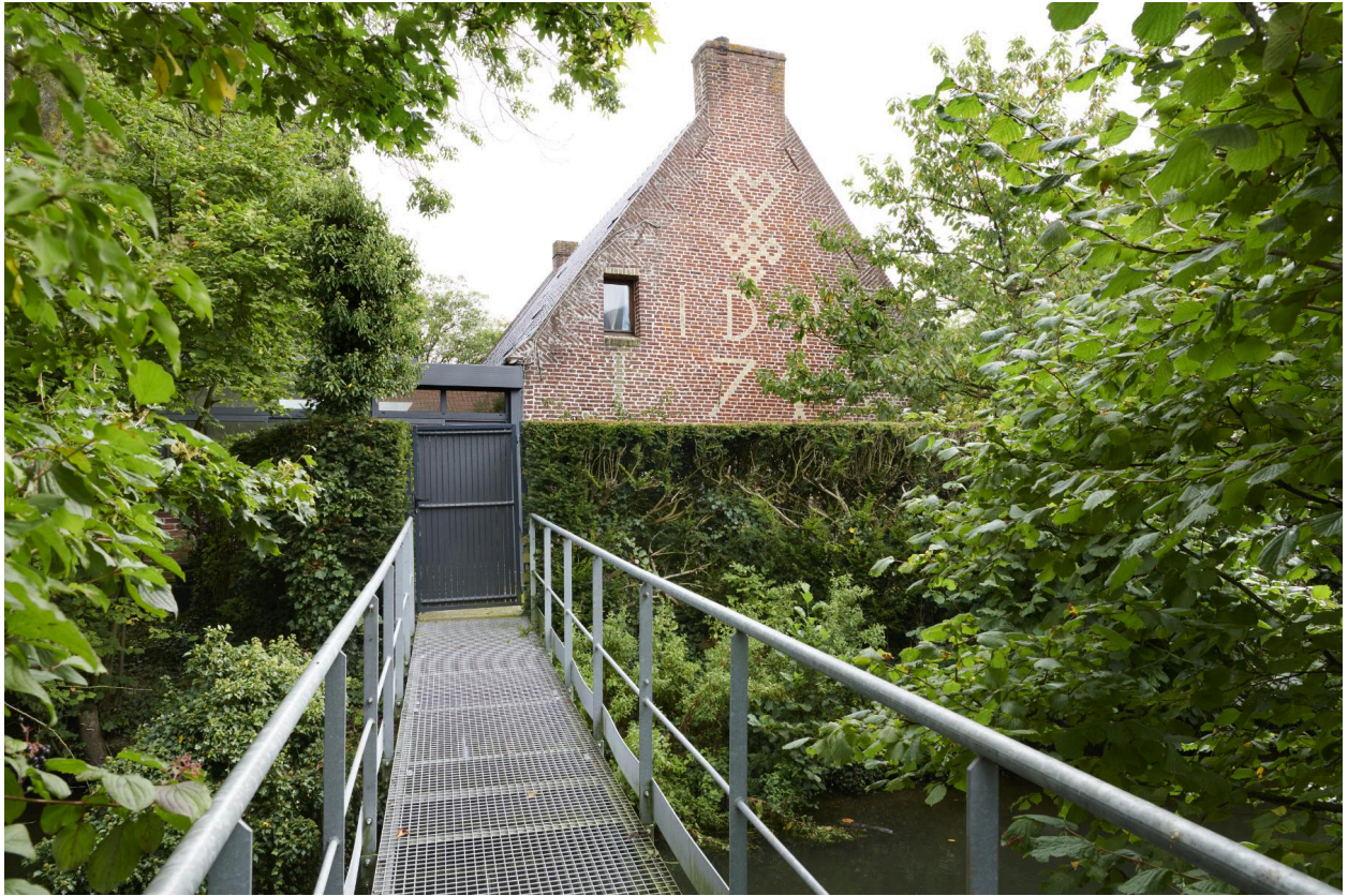
Passerelle enjambant le fossé en eau de la propriété. Pignon ouest.