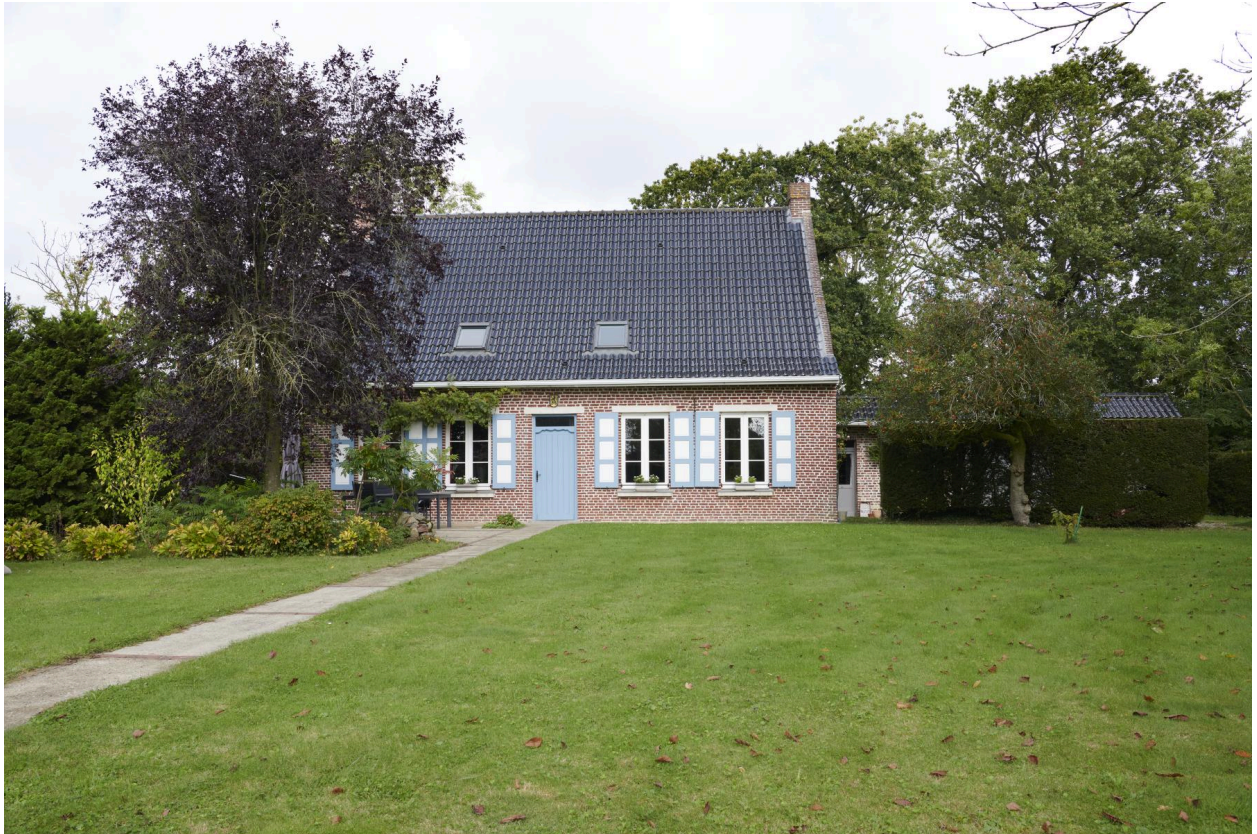
Vue générale de la façade sud.