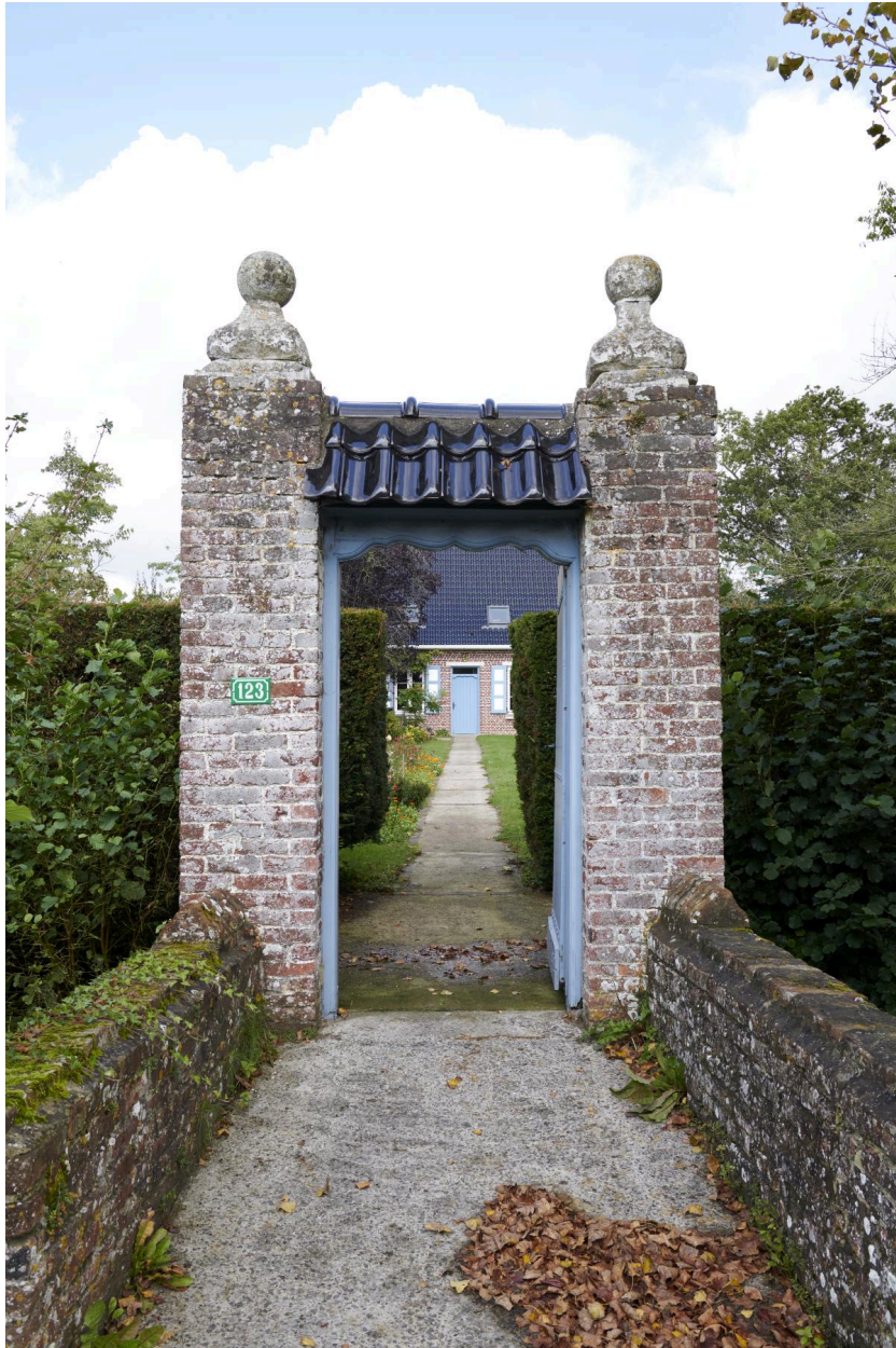
Ponceau sud en brique qui enjambe le fossé en eau.