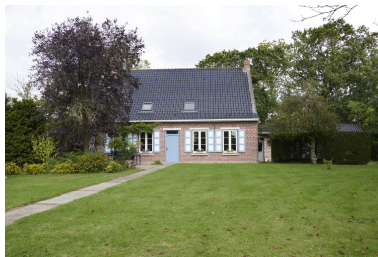
Vue générale de la façade sud. IVR32_20245903126NUCA