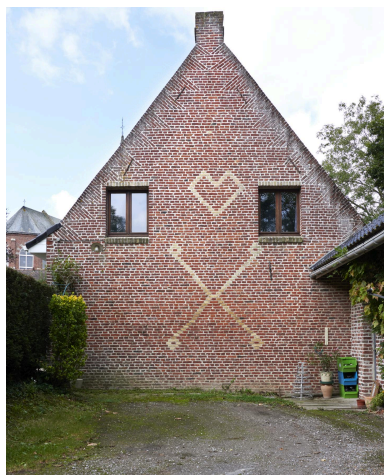
Pignon est. IVR32_20245903127NUCA