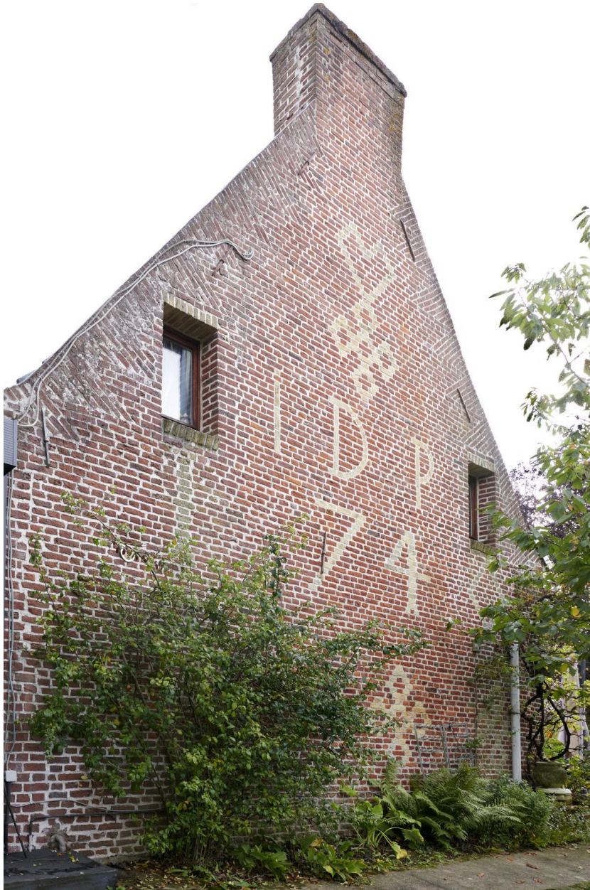
Détail du pignon ouest.