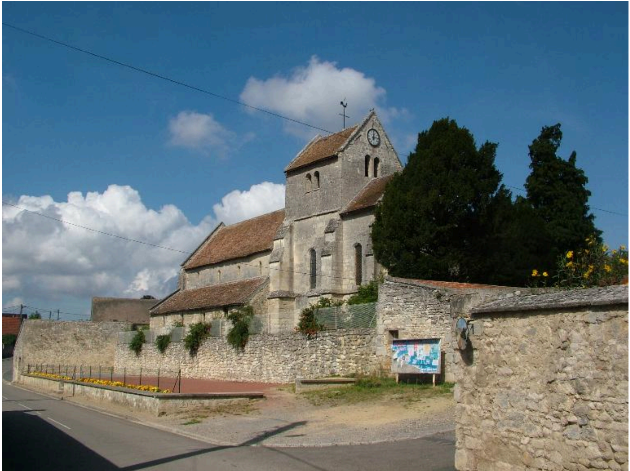
Vue de situation, depuis le sud-est.