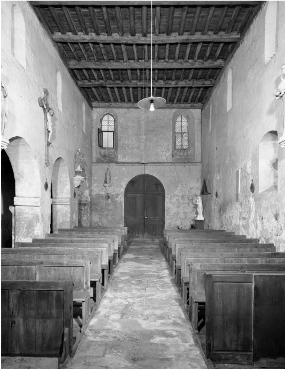
Vue intérieure, du choeur vers l'entrée.