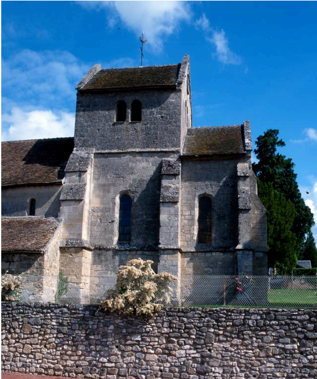
Vue extérieure du transept sud.