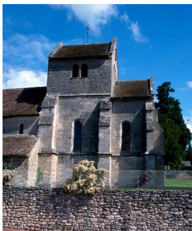
Vue extérieure du transept sud.