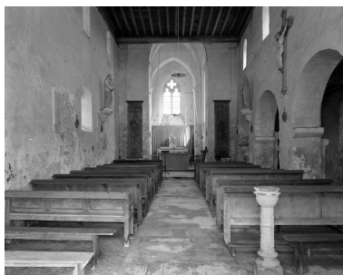
Vue intérieure, de l'entrée vers le chœur. IVR22_20020202925V