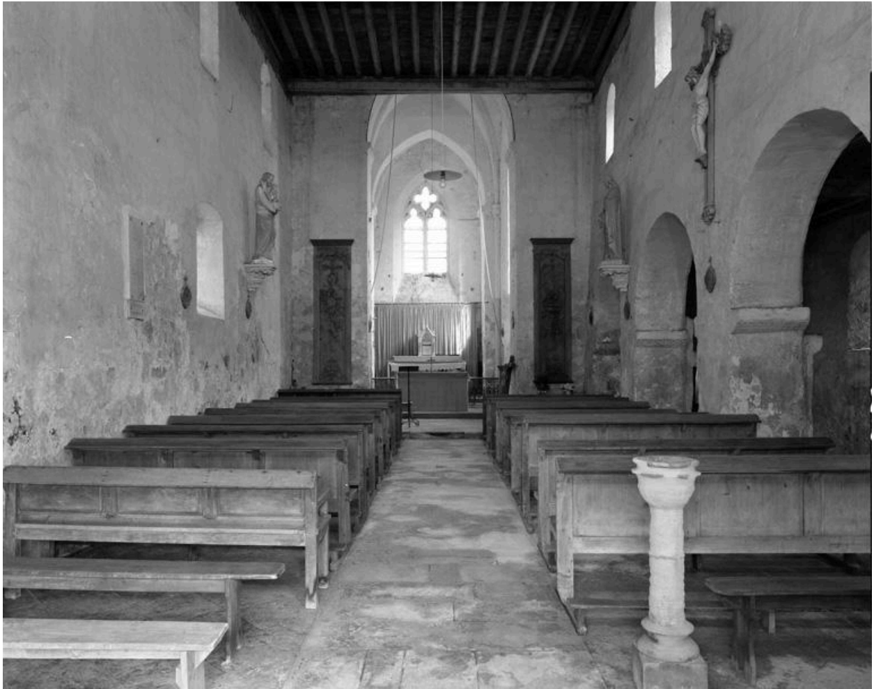
Vue intérieure, de l'entrée vers le chœur.