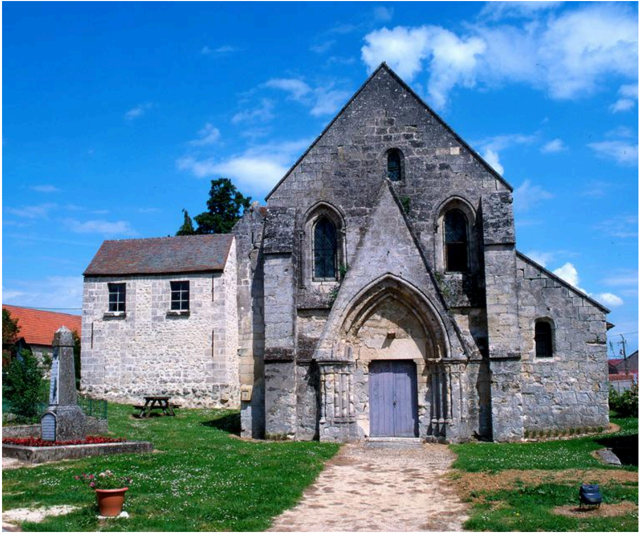
Vue extérieure de la façade occidentale.