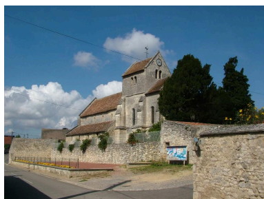
Vue de situation, depuis le sud-est.