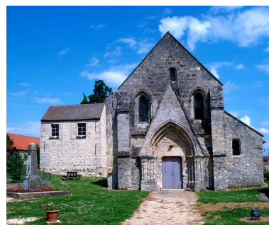
Vue extérieure de la façade occidentale. IVR22_20020202916XA