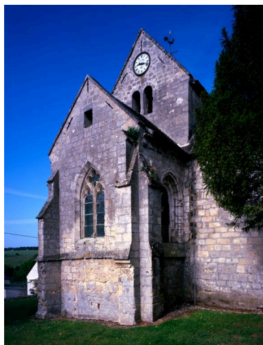
Vue du chevet.