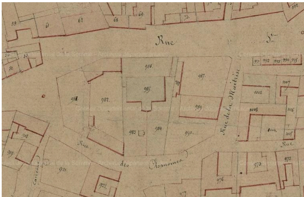
Extrait du cadastre napoléonien, section B, vers 1830 (AD Somme ; 3P 2065/4).