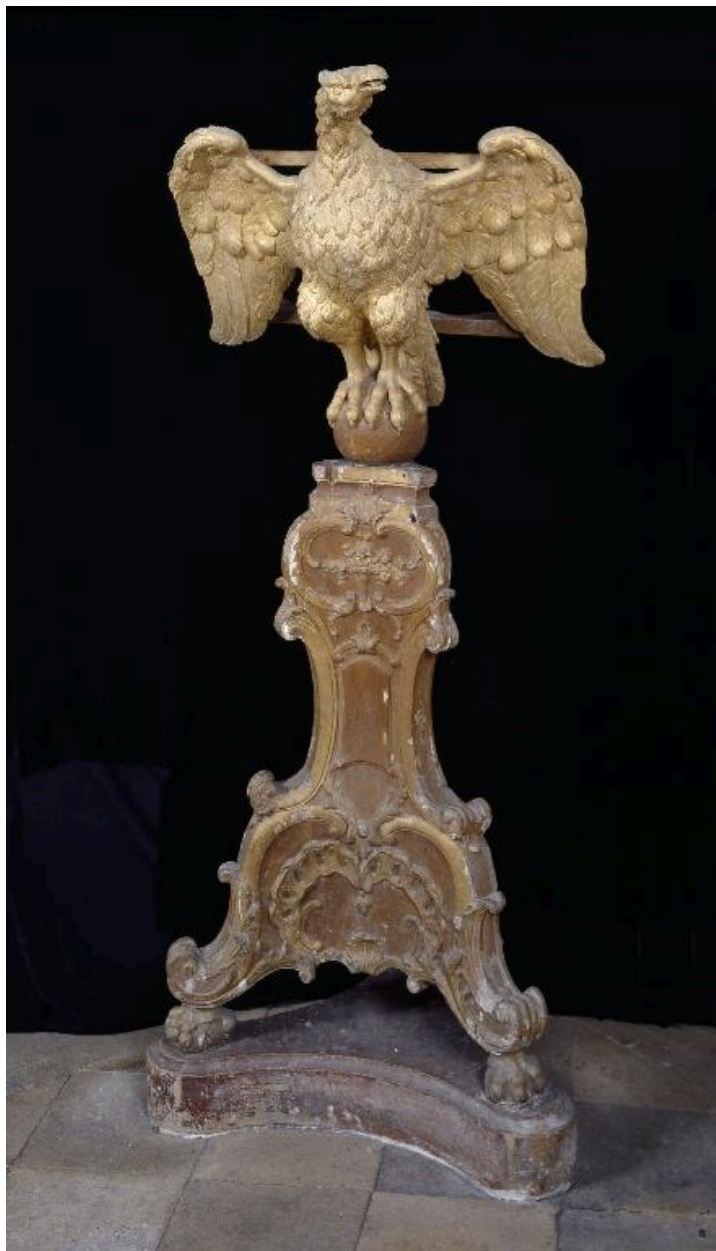
L'aigle-lutrin, vu de face.