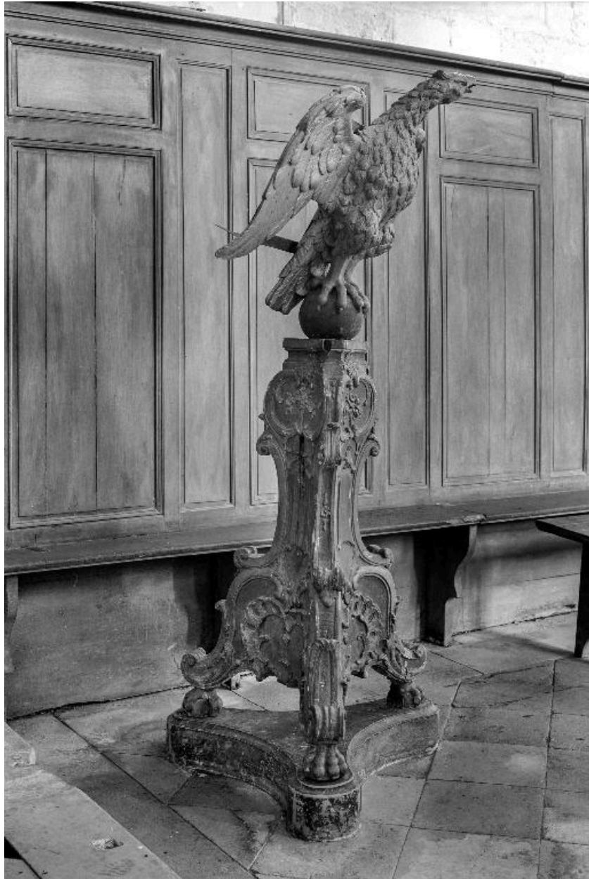
L'aigle-lutrin, vu de profil.