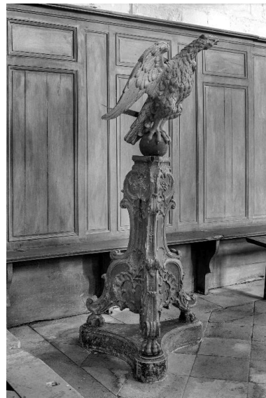
L'aigle-lutrin, vu de profil. IVR22_19880200817X