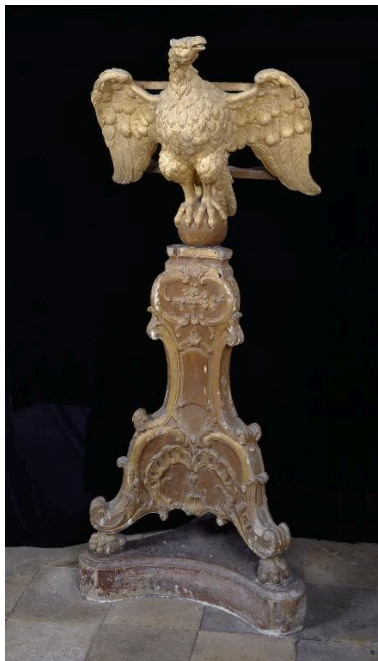
L'aigle-lutrin, vu de face. IVR22_19920202589VA