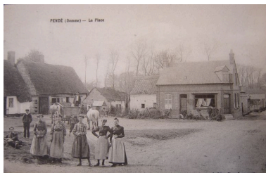
Vue de la bâtisse et de la place de l'église au début du 20e siècle.