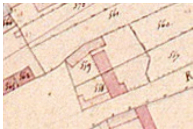
Extrait du cadastre napoléonien présentant le plan des deux fermes jumelles à cet emplacement en 1832.