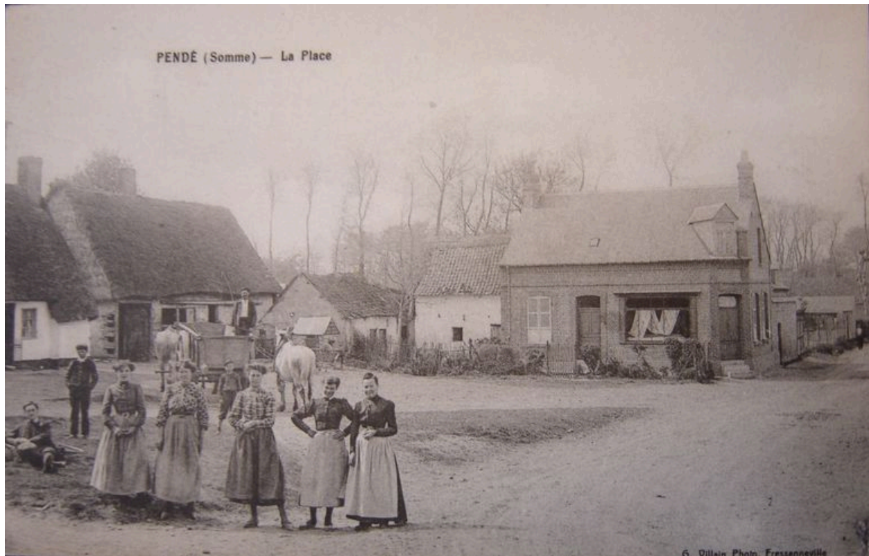
Vue de la bâtisse et de la place de l'église au début du 20e siècle.