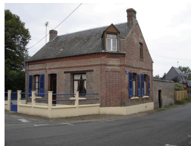
Vue générale. IVR22_20078005985NUCA