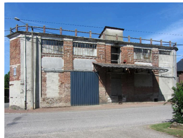
Façade sur rue du moulin. IVR22_20158005911NUCA