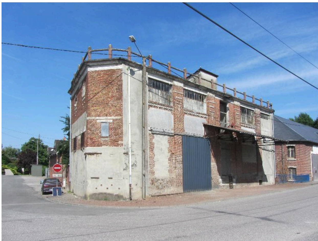
Vue d'ensemble sur rue.