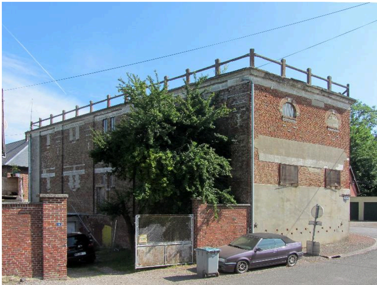
Façade postérieure du moulin à farine.