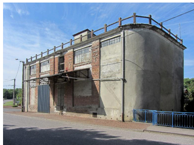
Vue d'ensemble sur rue et du pignon sur la rivière.