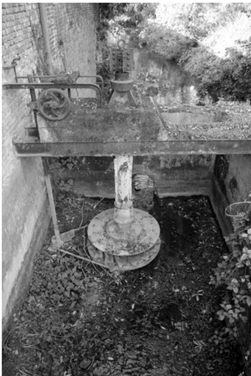
Détail de la turbine hydraulique.