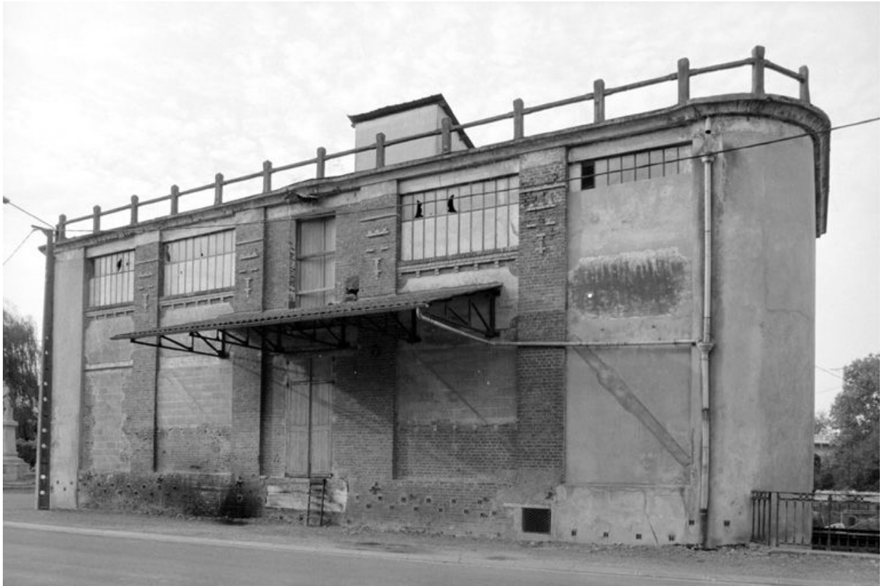
Atelier de fabrication principal en 1990.