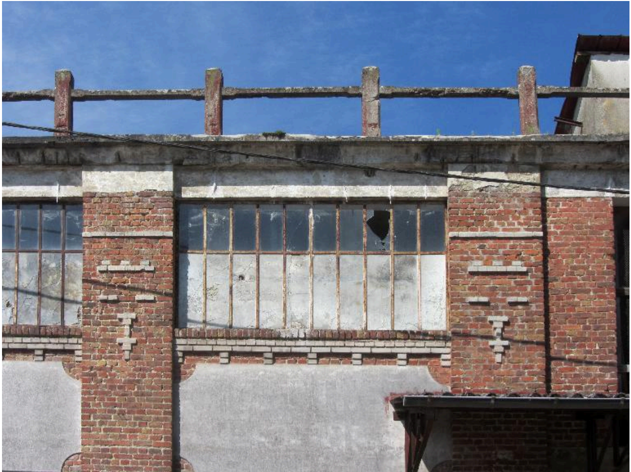
Détail des éléments décoratifs de la façade sur rue.