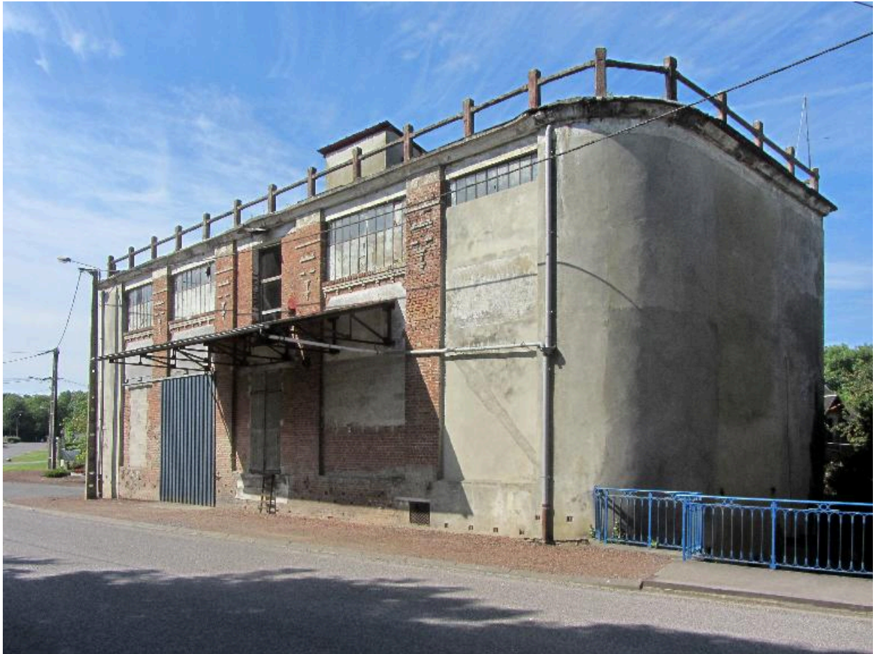
Vue d'ensemble sur rue et du pignon sur la rivière.