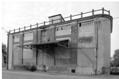
Atelier de fabrication principal en 1990.