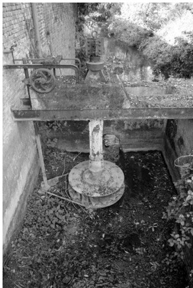
Détail de la turbine hydraulique.