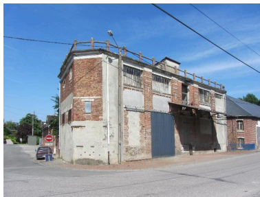
Vue d'ensemble sur rue. IVR22_20158005912NUCA