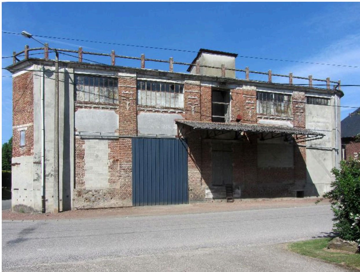
Façade sur rue du moulin.