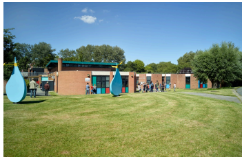
Le groupe scolaire Frédéric-Chopin (quartier le Château).

Agissant, par convention, comme maître d'ouvrage délégué de la CUDL (pour les groupes scolaires) et de la mairie (pour les cantines), l'ÉPALE élabore le programme architectural de chaque groupe scolaire en collaboration avec l'Inspection académique, en lien avec les architectes et parfois des enseignants ; ainsi des instituteurs stagiaires ont-ils participé à l'élaboration du groupe scolaire Frédéric-Chopin . Pour chaque établissement les objectifs pédagogiques sont traduits en spécificités fonctionnelles et architecturales.