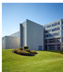
L'Ensemble littéraire et juridique, actuellement Université de Lille - campus du Pont-de-Bois.

L'Ensemble littéraire et juridique, actuellement Université de Lille - campus du Pont-de-Bois , ouverte en 1974