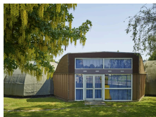
Le groupe scolaire Chateaubriand (quartier le Château).

ou d'espaces de circulation très étendus dans de très nombreux groupes scolaires : Chateaubriand , Paul-Fort , René-Clair , Hippolyte-Taine ... Dans la plupart des cas les couloirs traditionnels sont remplacés par des espaces de circulation plus vastes et au plan souvent irrégulier, servant également de lieux de rassemblement permettant d'autres activités (exposition des travaux, ateliers). On remarque également que les classes sont parfois pourvues d'un accès direct et particulier à la cour ( Chateaubriand ).