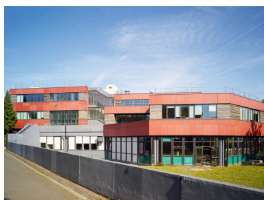
Le lycée Raymond-Queneau (quartier le Pont-de-Bois). IVR32_2019590009NUCA