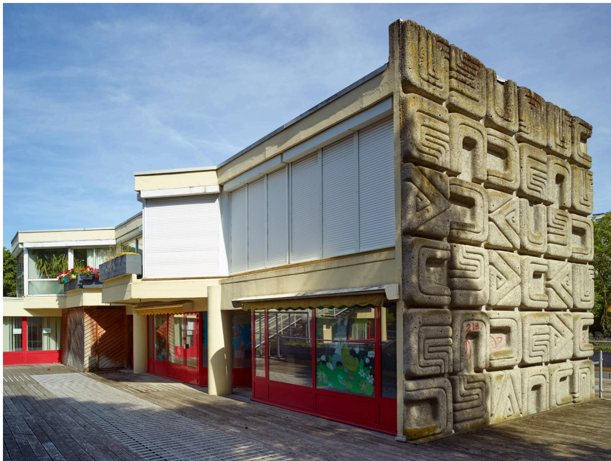
Un exemple d'équipement intégré : la maternelle et centre de la petite enfance Maxence-Van-der-Meersch (quartier l'Hôtel-de-Ville).