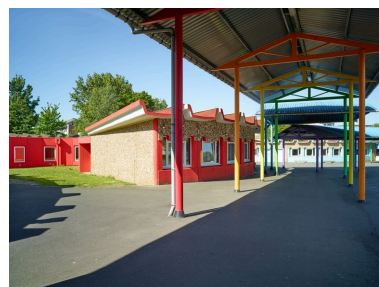
Le collège Le Triolo (quartier le Triolo).