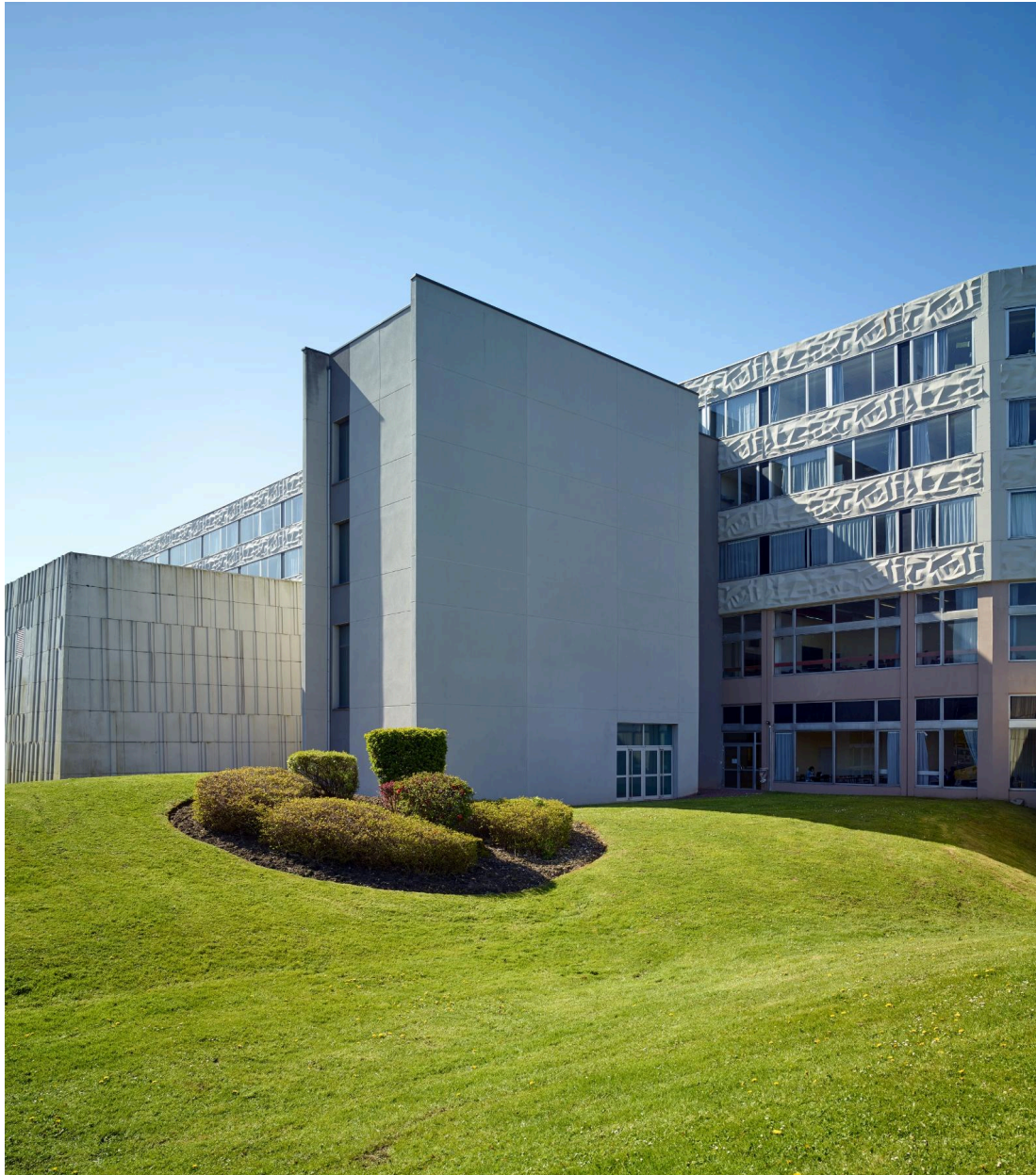
L'Ensemble littéraire et juridique, actuellement Université de Lille - campus du Pont-de-Bois.