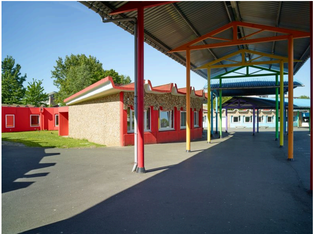
Le collège Le Triolo (quartier le Triolo).