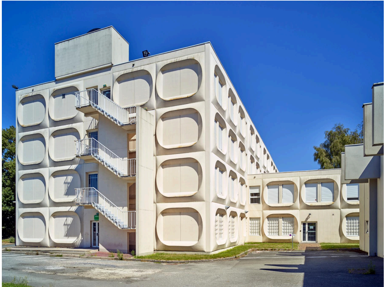
L'école normale d'apprentissage, actuellement INSPé de Lille (quartier le Tir-à-Locques).