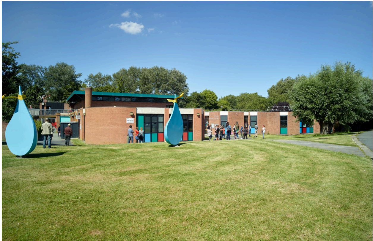
Le groupe scolaire Frédéric-Chopin (quartier le Château).