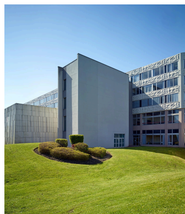
L'Ensemble littéraire et juridique, actuellement Université de Lille - campus du Pont-de-Bois.