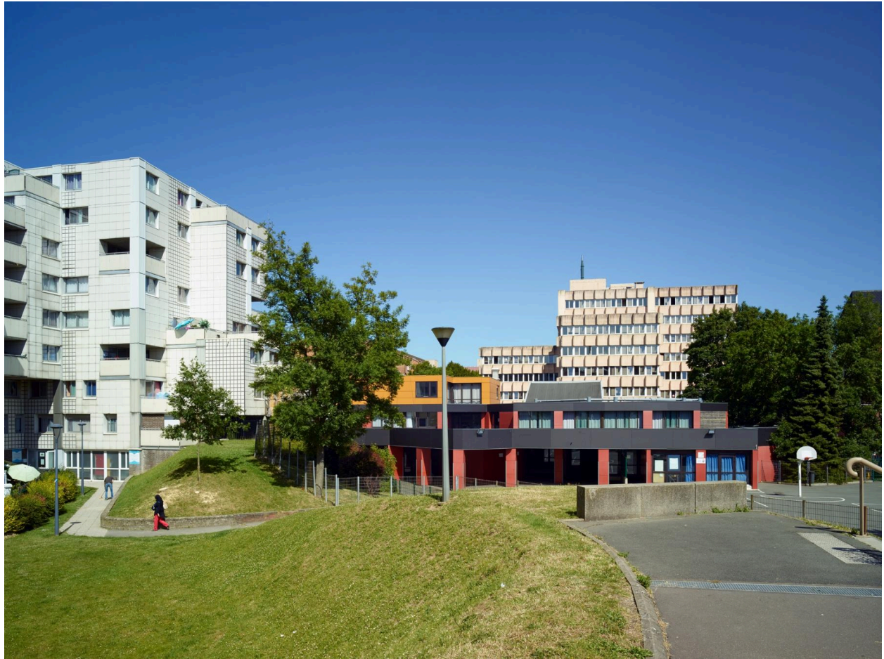
Le groupe scolaire Emile-Verhaeren (quartier l'Hôtel-de-Ville).