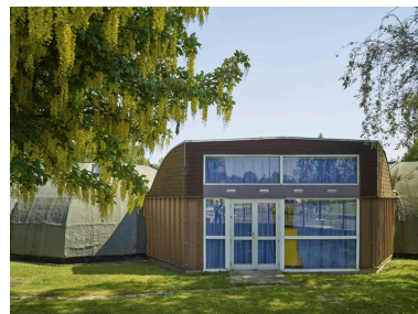
Le groupe scolaire Chateaubriand (quartier le Château).