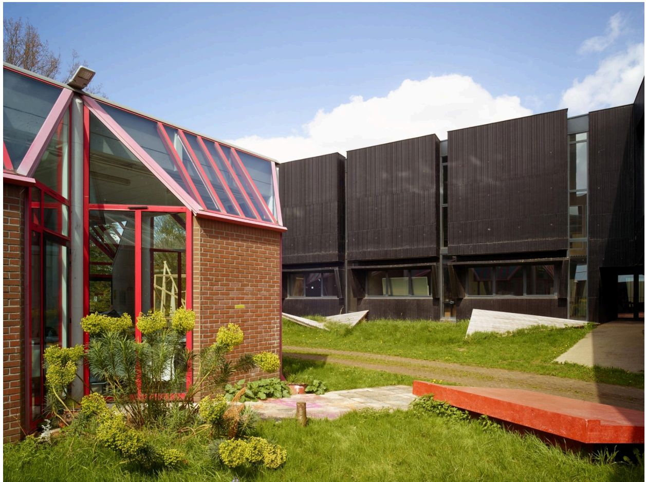
L'École nationale supérieure d'architecture et de paysage de Lille (quartier l'Hôtel-de-Ville).