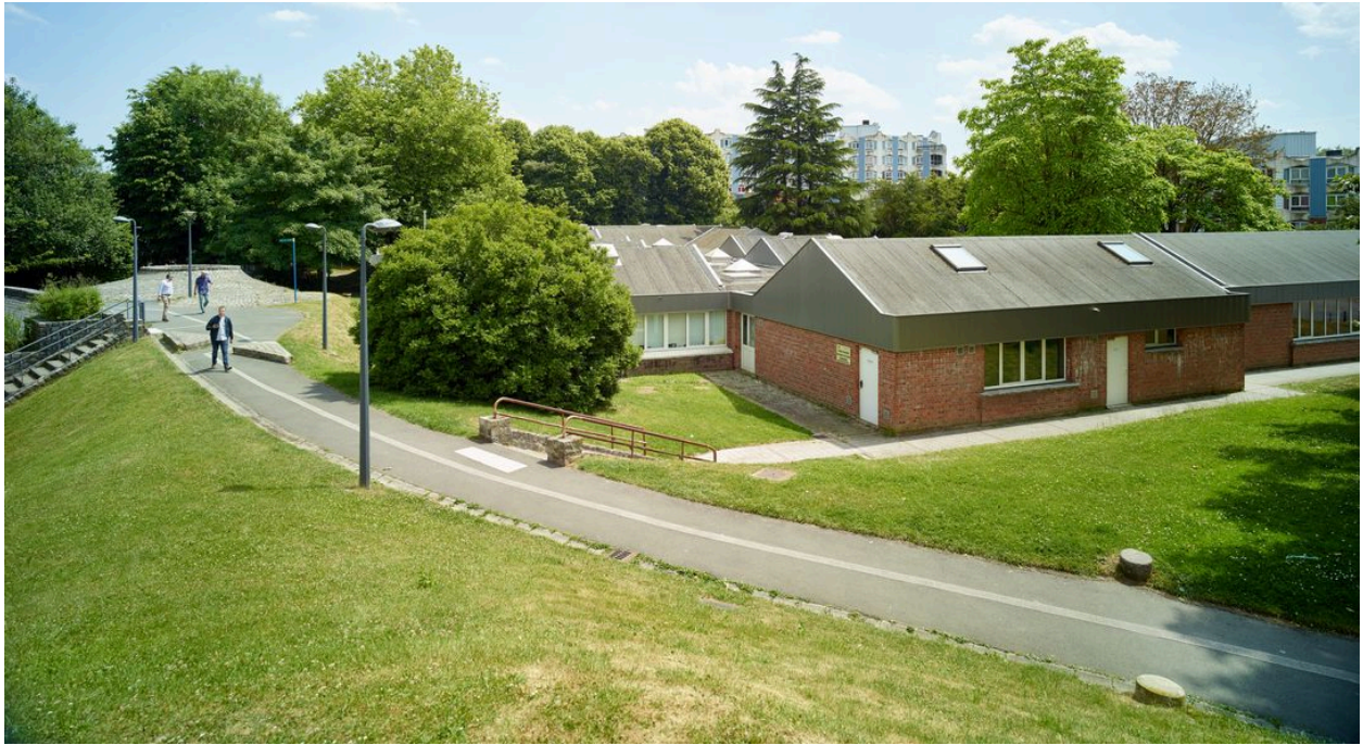
L'école primaire Hippolyte-Taine (quartier le Triolo).