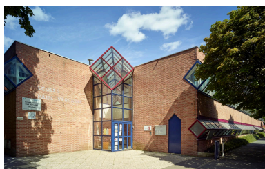
Le groupe scolaire Paul-Verlaine (quartier l'Hôtel-de-Ville). IVR32_20195901002NUCA