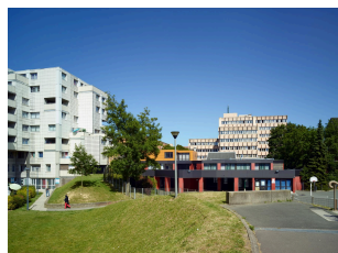
Le groupe scolaire Emile-Verhaeren (quartier l'Hôtel-de-Ville).

La variété des architectures est à l'image de celle observée dans les habitations de la ville nouvelle : les groupes scolaires d'inspiration moderne ( Jacques-Bénigne-Bossuet , Frédéric-Chopin ) sont cependant les plus nombreux, et côtoient quelques équipements aux formes nettement plus traditionnelles ( Pablo-Picasso , René-Clair ). Sauf exception ( Jacques-Prévert ) l'architecture des différents établissements scolaires est en harmonie avec celles des îlots voisins ( Emile-Verhaeren , René-Clair ).