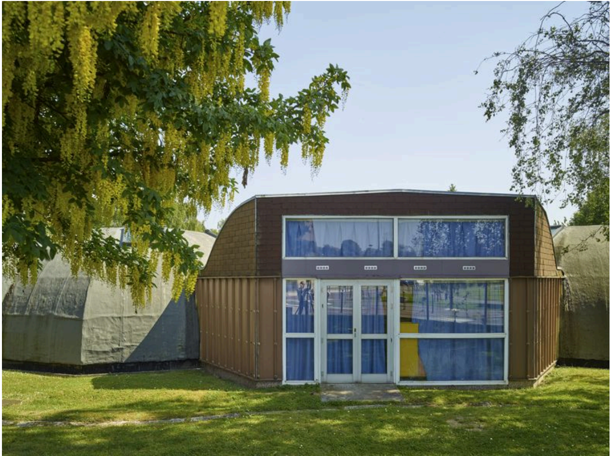
Le groupe scolaire Chateaubriand (quartier le Château).