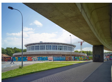
La bibliothèque de la cité scientifique, actuellement LILIAD.