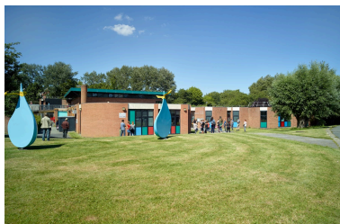
Le groupe scolaire Frédéric-Chopin (quartier le Château).