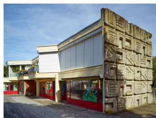
Un exemple d'équipement intégré : la maternelle et centre de la petite enfance Maxence-Van-der-Meersch (quartier l'Hôtel-de-Ville).

Cette volonté d'ouverture à la vie du quartier va jusqu'à la réalisation d'équipements intégrés : certains édifices scolaires intègrent alors d'autres équipements, aux fonctions différentes. Ainsi une bibliothèque est installée dans le groupe scolaire Frédéric-Chopin ; elle est accessible par une passerelle publique. L'école maternelle et centre de la petite enfance Maxence-Van-der-Meersch est un autre exemple d'équipement intégré.