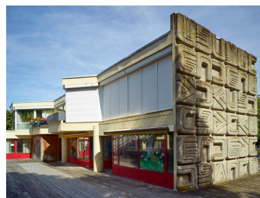
Un exemple d'équipement intégré : la maternelle et centre de la petite enfance Maxence-Van-der-Meersch (quartier l'Hôtel-de-Ville).