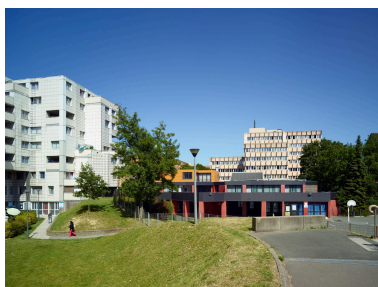
Le groupe scolaire Emile-Verhaeren (quartier l'Hôtel-de-Ville). IVR32_20195900937NUCA