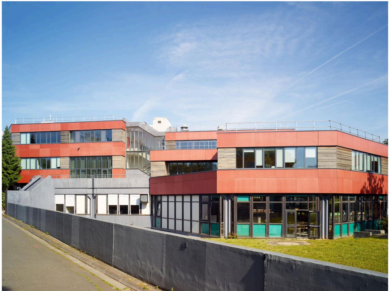
Le lycée Raymond-Queneau (quartier le Pont-de-Bois).