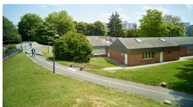
L'école primaire Hippolyte-Taine (quartier le Triolo).