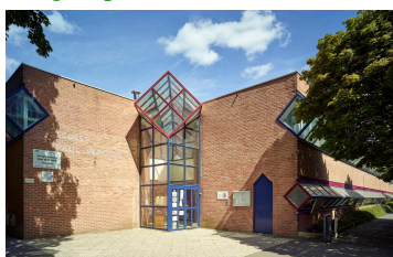
Le groupe scolaire Paul-Verlaine (quartier l'Hôtel-de-Ville).

Les écoles constituent finalement autant de monuments repères au sein de la ville nouvelle. Leurs architectures singulières et parfois remarquables permettent d'identifier facilement les groupes scolaires et par extension les unités de voisinages et quartiers dans lesquels ils sont installés ; c'est le cas des verrières cubiques qui caractérisent Paul-Verlaine , quartier l'Hôtel-de-Ville, ou des dômes caractérisant le groupe scolaire Chateaubriand , au Château.