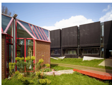
L'École nationale supérieure d'architecture et de paysage de Lille (quartier l'Hôtel-de-Ville). IVR32_20185900382NUCA