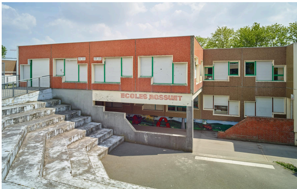
Le groupe scolaire Jacques-Bénigne-Bossuet (quartier le Pont-de-Bois).