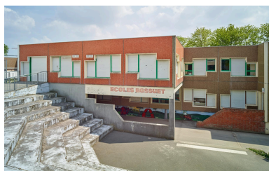
Le groupe scolaire Jacques-Bénigne-Bossuet (quartier le Pont-de-Bois).