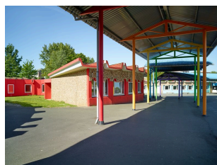
Le collège Le Triolo (quartier le Triolo).

En fin de projet la ville nouvelle compte 5 collèges :