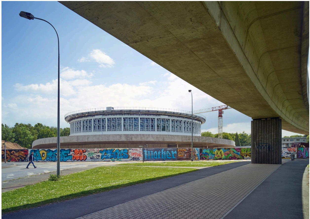
La bibliothèque de la cité scientifique, actuellement LILIAD.