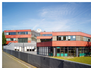
Le lycée Raymond-Queneau (quartier le Pont-de-Bois).

Situé au Pont-de-Bois, le lycée Raymond-Queneau est un équipement intégré, comprenant également une maison de quartier, une halte-garderie et un LCR (Local Collectif Résidentiel). Il est initialement complètement ouvert sur la place Léon-Blum. Des difficultés dans l'usage et le partage des espaces ont entraîné d'une part sa clôture et d'autre part la fermeture des communications internes entre structures, témoignant des limites de ces équipements expérimentaux.