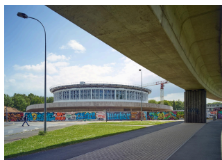
La bibliothèque de la cité scientifique, actuellement LILIAD.

L'Ensemble littéraire et juridique, actuellement Université de Lille - campus du Pont-de-Bois , ouverte en 1974