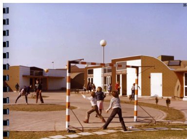
En 1978 : la cour de récréation du groupe scolaire Chateaubriand (quartier le Château)