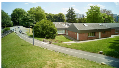
L'école primaire Hippolyte-Taine (quartier le Triolo).

Cette volonté d'ouverture à la vie du quartier va jusqu'à la réalisation d'équipements intégrés : certains édifices scolaires intègrent alors d'autres équipements, aux fonctions différentes. Ainsi une bibliothèque est installée dans le groupe scolaire Frédéric-Chopin ; elle est accessible par une passerelle publique. L'école maternelle et centre de la petite enfance Maxence-Van-der-Meersch est un autre exemple d'équipement intégré.