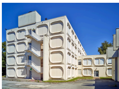
L'école normale d'apprentissage, actuellement INSPÉ de Lille (quartier le Tir-à-Locques).