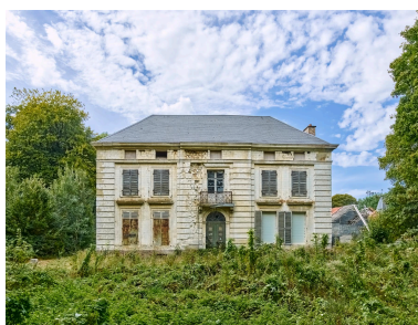
Demeure, dite château de Faveille ou Château Blanc (route Nationale).

IVR32_20258001202NUCA