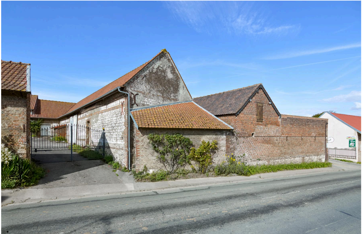
Fermes (rue Joseph-Harent). Deux bâtiments agricoles attenants, l'un en pierre de taille avec cordon de brique, l'autre en brique portant la date 1868 par fers d'ancrage.