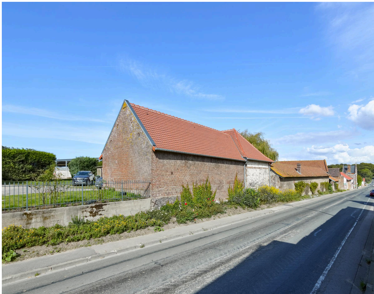
Fermes (rue Joseph-Harent). Alignement sur rue des bâtiments agricoles.