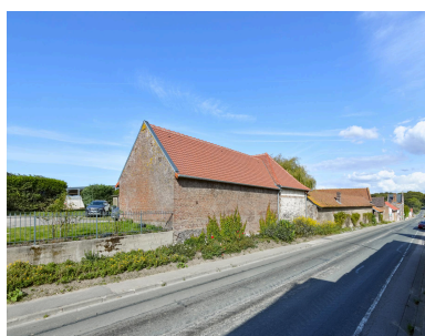
Fermes (rue Joseph-Harent). Alignement sur rue des bâtiments agricoles.

IVR32_20258002100NUCA