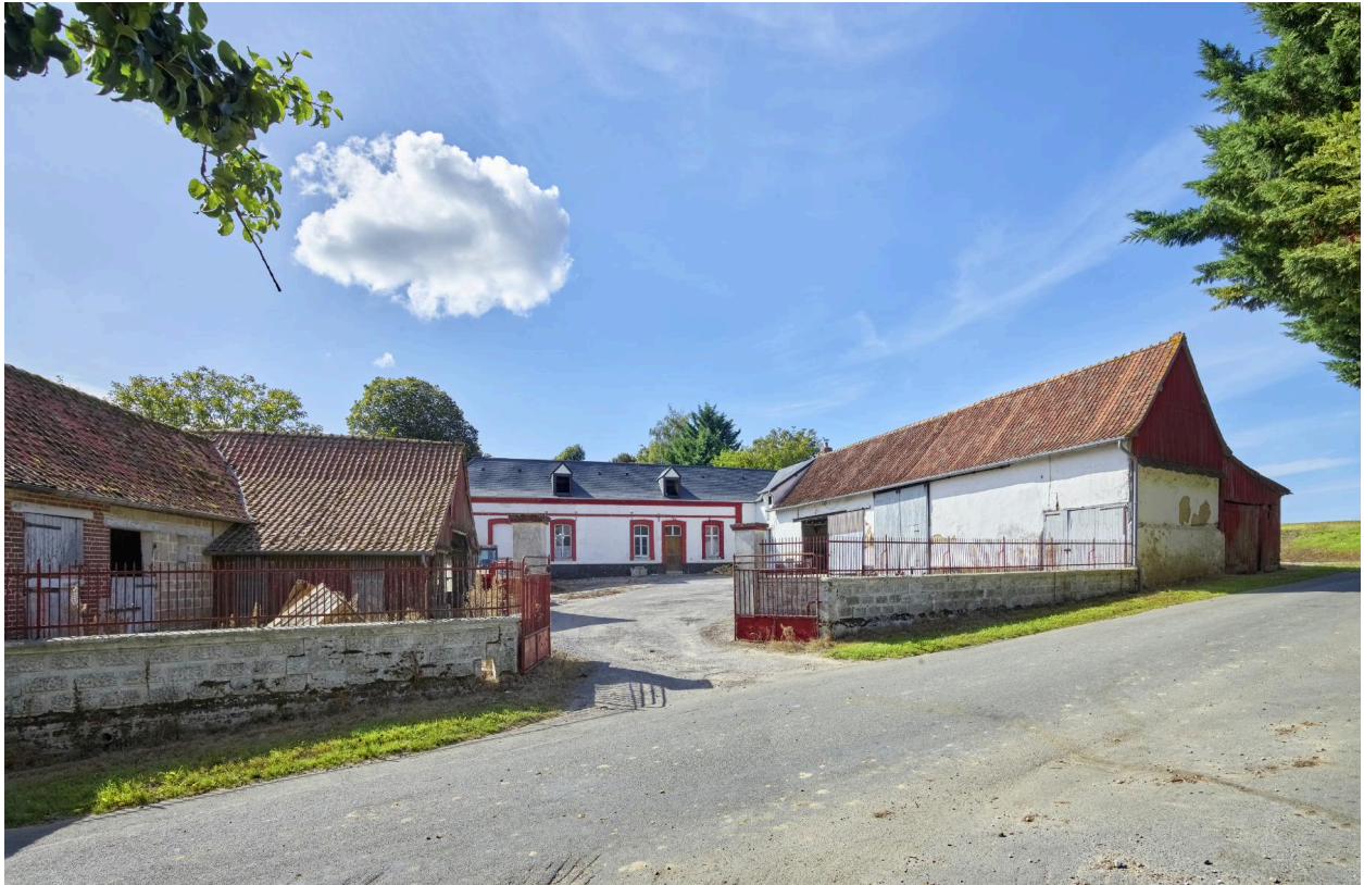
Ferme Boinet (3, route de Vercourt). Vue d'ensemble depuis la route.