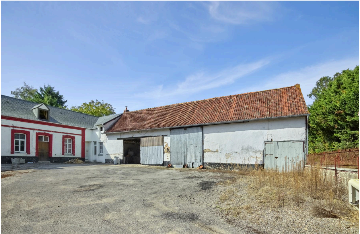
Ferme Boinet (3, rue de Vercourt). Façade sur cour de la grange.