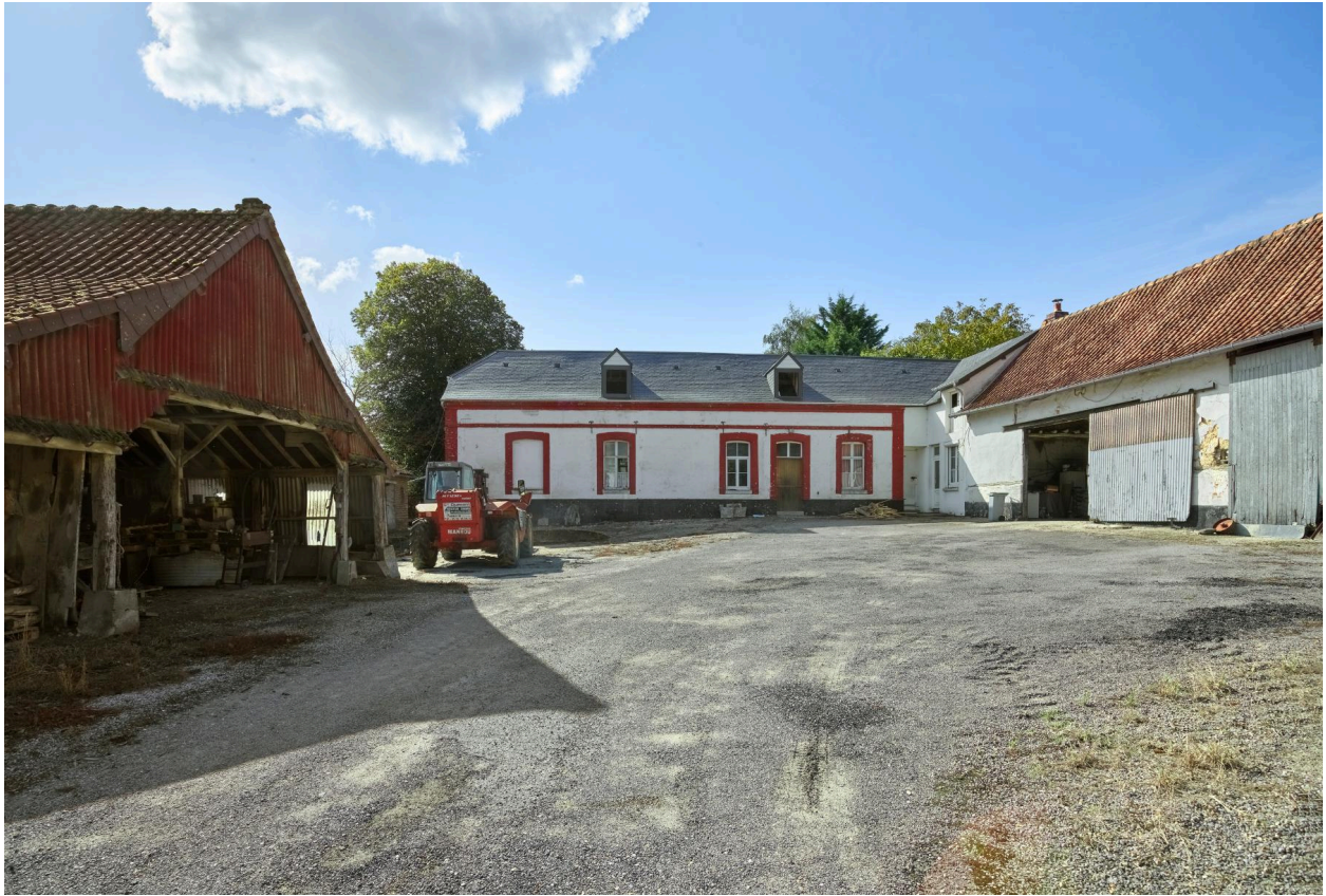
Ferme Boinet (3 route de Vercourt). Vue de face, depuis la route.