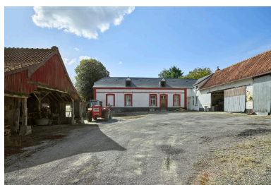
Ferme Boinet (3 route de Vercourt). Vue de face, depuis la route.

Phot. Thierry Lefébure IVR32_20258002095NUCA