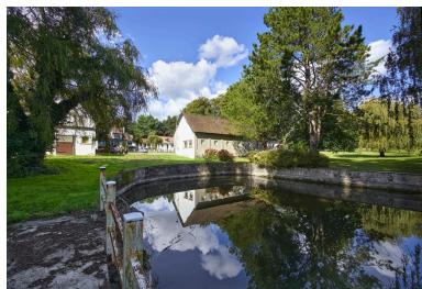
Ancienne ferme de Thurel.