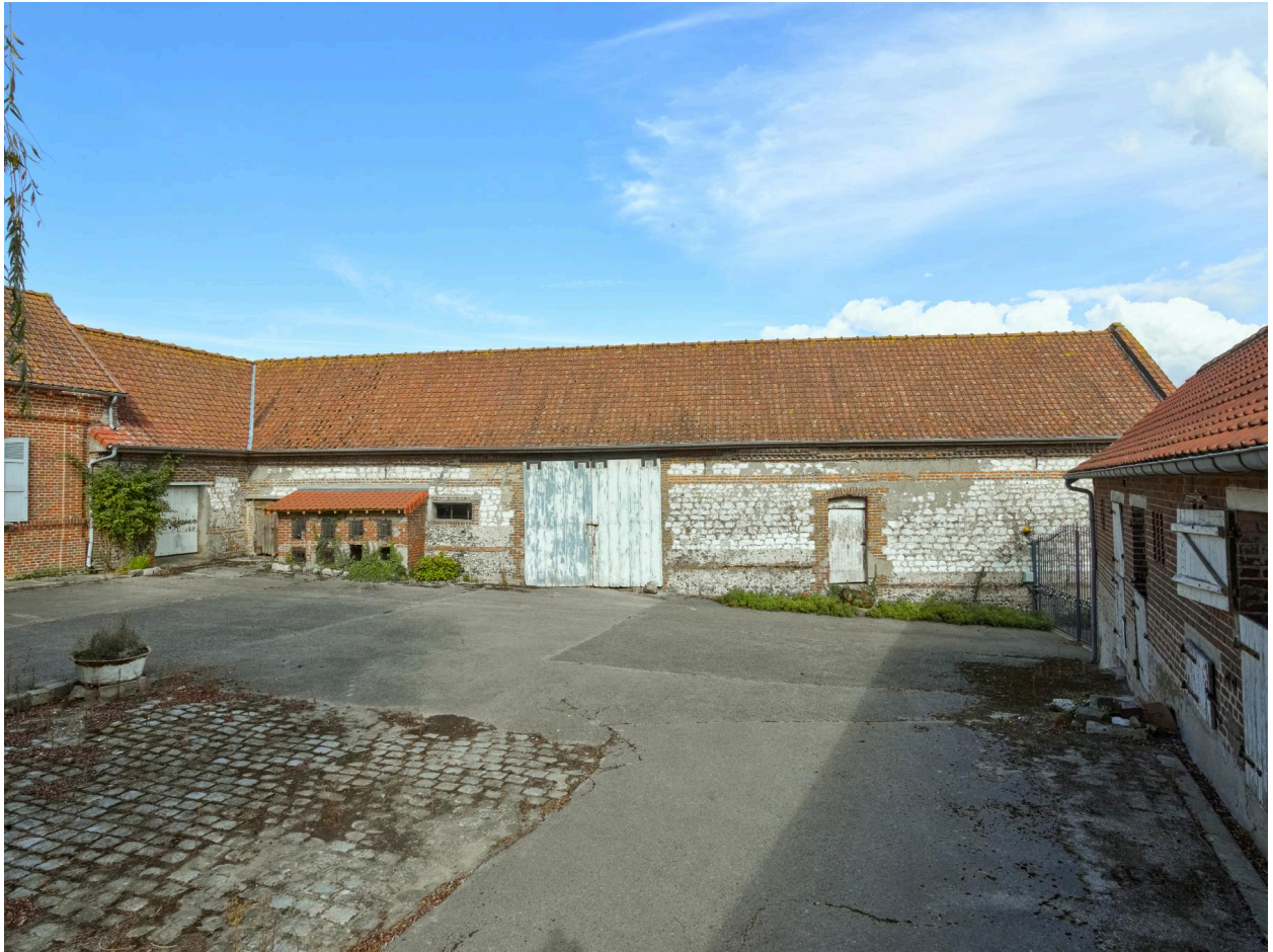
Ferme Trouart (24, rue Joseph-Harent). Grange en pierre de taille.