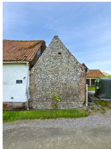
Ferme (1, rue de l'Église). Détail du pignon en silex d'un bâtiment agricole.