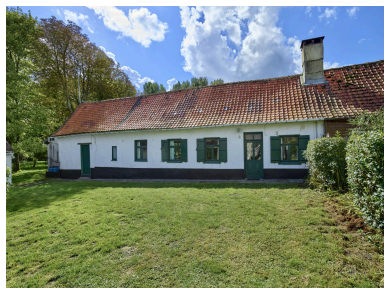
Maisons de tourbiers (2, chemin des Tourbières)