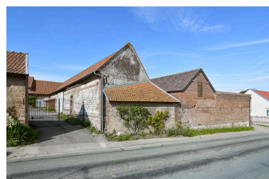
Fermes (rue Joseph-Harent). Deux bâtiments agricoles attenants, l'un en pierre de taille avec cordon de brique, l'autre en brique portant la date 1868 par fers d'ancrage.

IVR32_20258002097NUCA