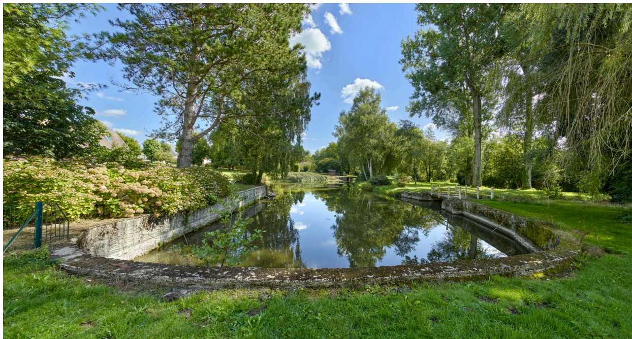
Pièce d'eau et abreuvoir (?) de la ferme de Thurel alimenté par la Maye.