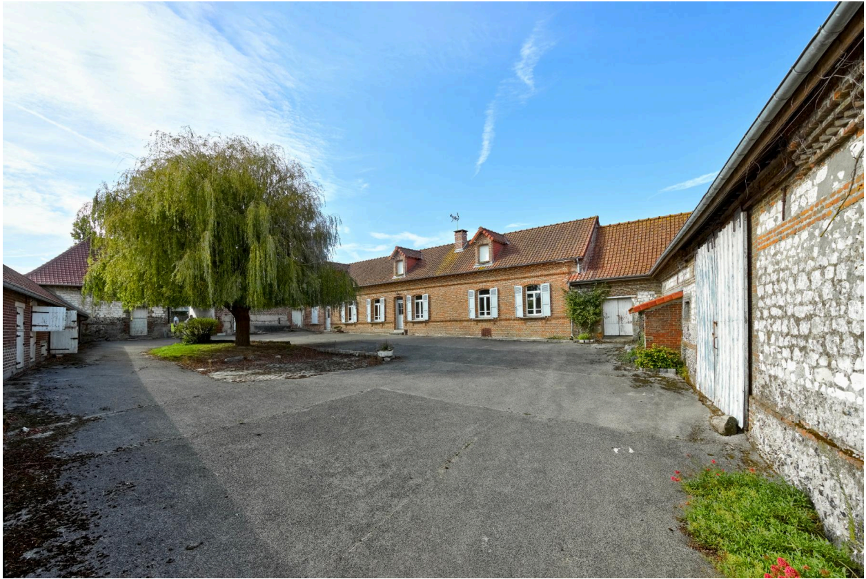
Ferme Trouart (24, rue Joseph-Harent). Grange et maison d'habitation en brique.