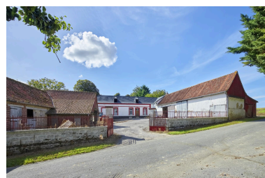
Ferme Boinet (3, route de Vercourt). Vue d'ensemble depuis la route.

IVR32_20258002090NUCA