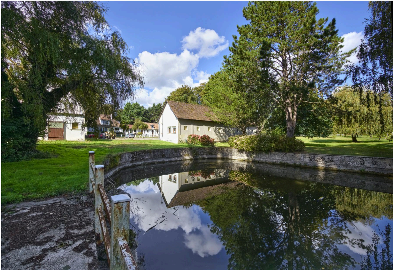
Ancienne ferme de Thurel.