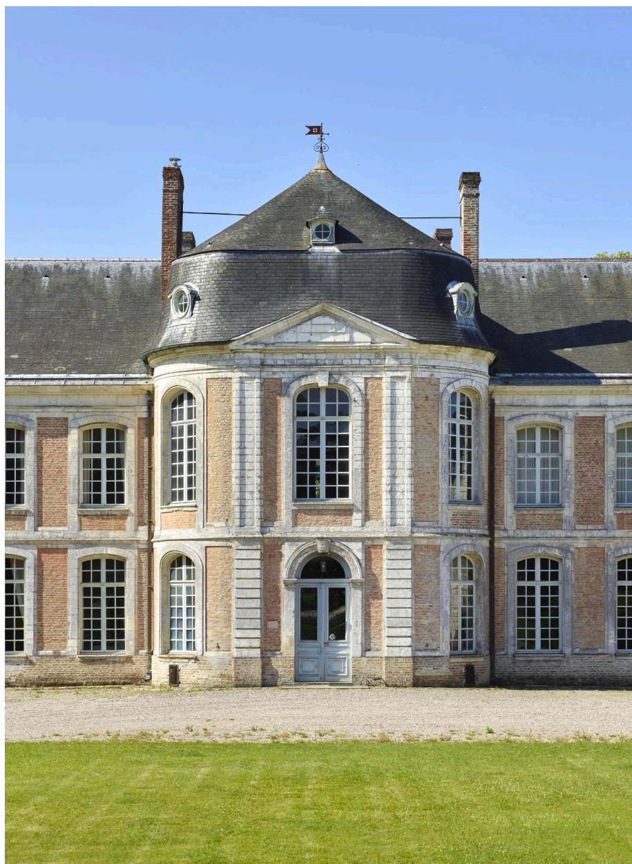
Avant-corps central du château d'Arry.