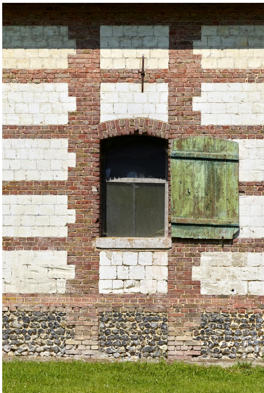
Détail de l'appareil du magasin à fourrage de la ferme du château, construit en 1875 (date portée).