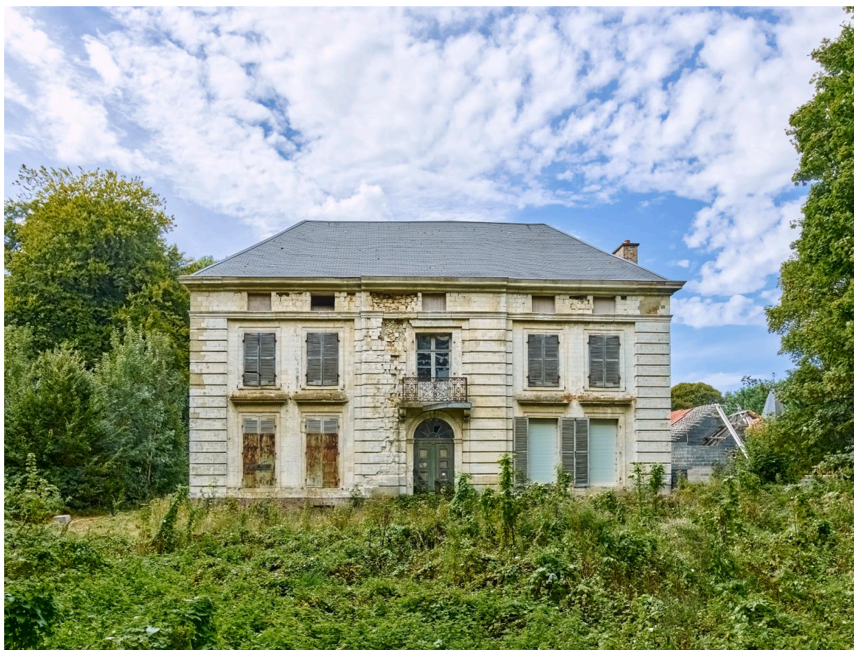
Demeure, dite château de Faveille ou Château Blanc (route Nationale).