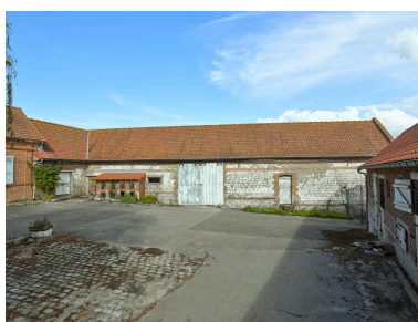
Ferme Trouart (24, rue Joseph-Harent). Grange en pierre de taille.

IVR32_20258002102NUCA