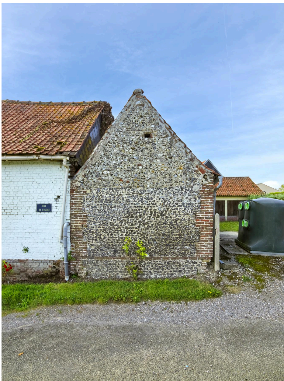
Ferme (1, rue de l'Église). Détail du pignon en silex d'un bâtiment agricole.