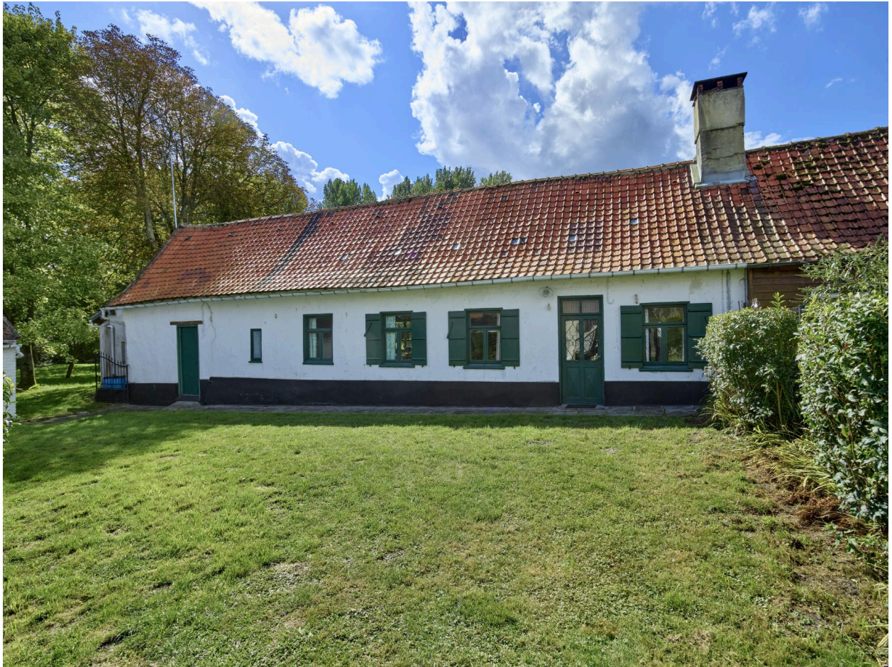
Maisons de tourbiers (2, chemin des Tourbières)