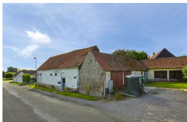
Ancienne ferme (1 rue de l'Église).