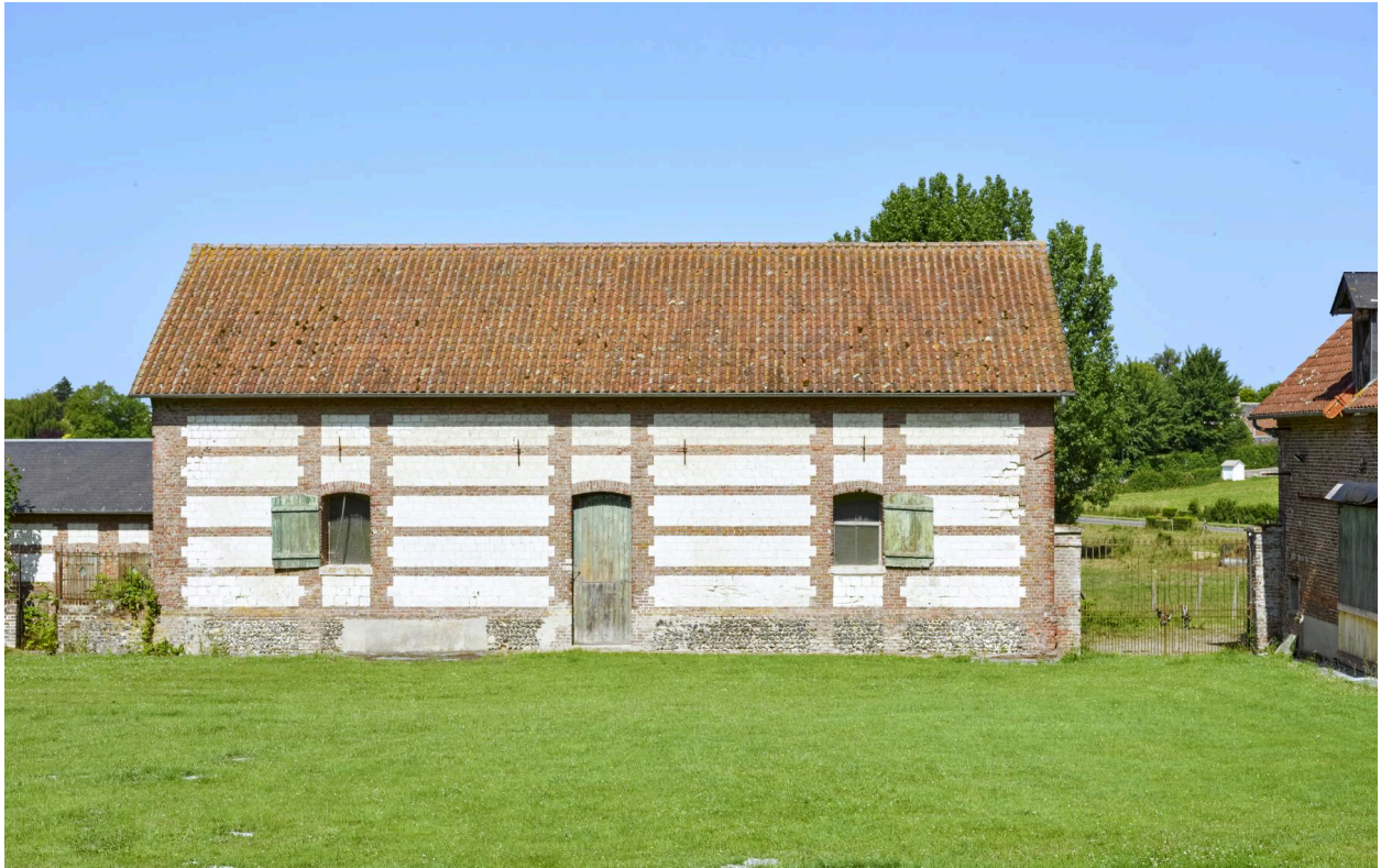
Magasin à fourrage de la ferme du château.