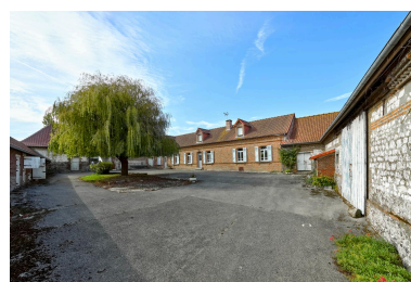
Ferme Trouart (24, rue Joseph-Harent). Grange et maison d'habitation en brique.

IVR32_20258002107NUCA