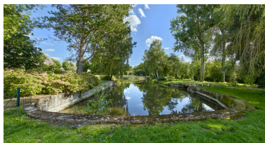
Pièce d'eau et abreuvoir (?) de la ferme de Thurel alimenté par la Maye.