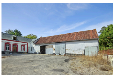
Ferme Boinet (3, rue de Vercourt). Façade sur cour de la grange.

IVR32_20258002096NUCA