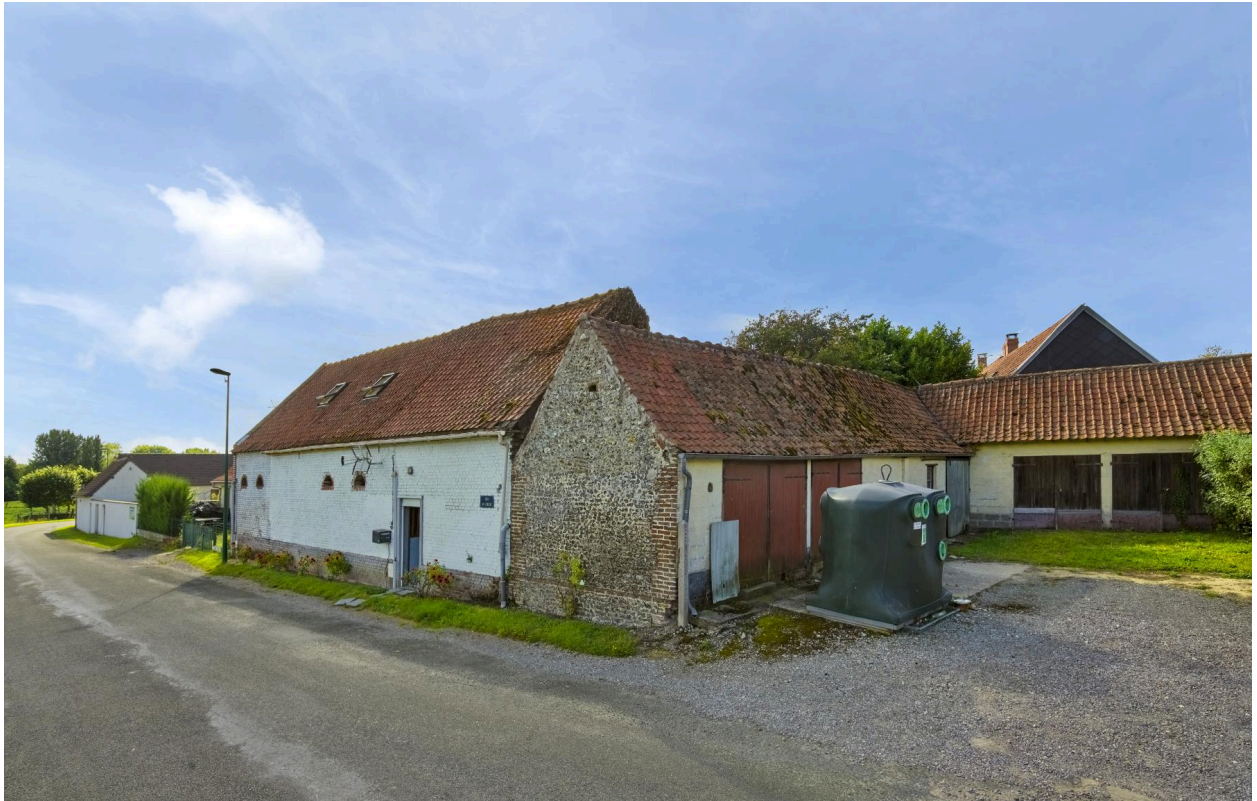
Ancienne ferme (1 rue de l'Église).