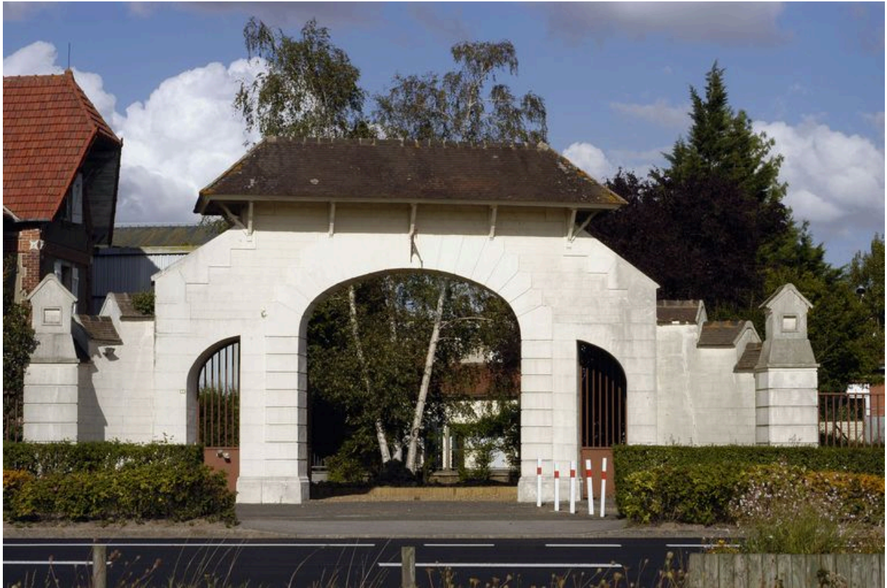
Le portail monumental d'entrée.