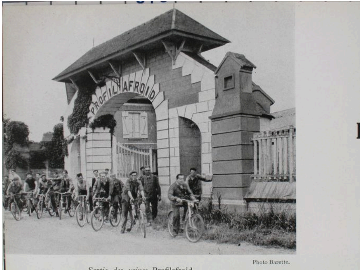
Sortie de l'usine Profilafroid, 1954 (L'Opinion économique et financière : les Pays de l'Oise).