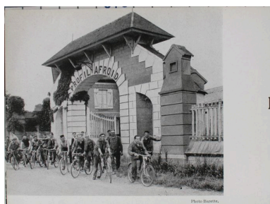
Sortie de l'usine Profilafroid, 1954 (L'Opinion économique et financière : les Pays de l'Oise).