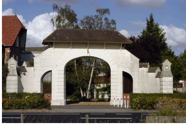
Le portail monumental d'entrée.