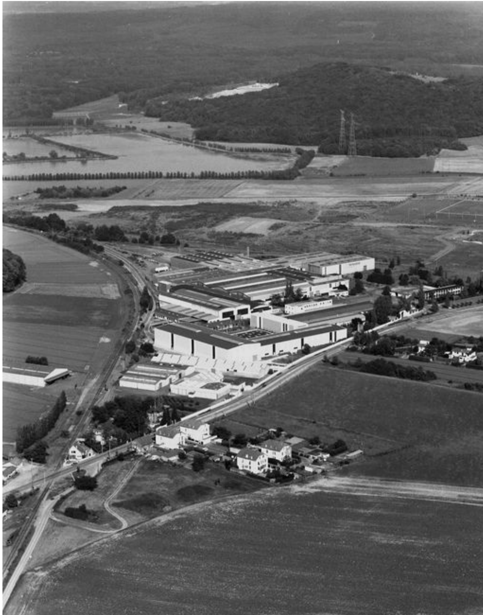
Vue aérienne de l'usine en 1994.