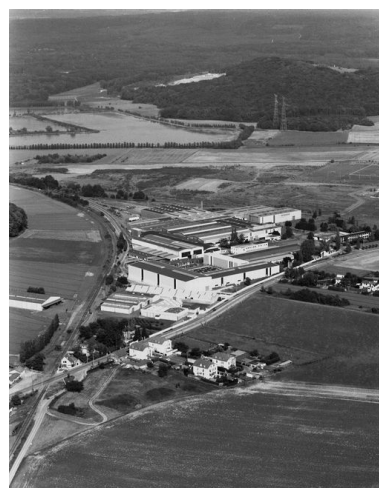
Vue aérienne de l'usine en 1994. IVR22_19946001524X