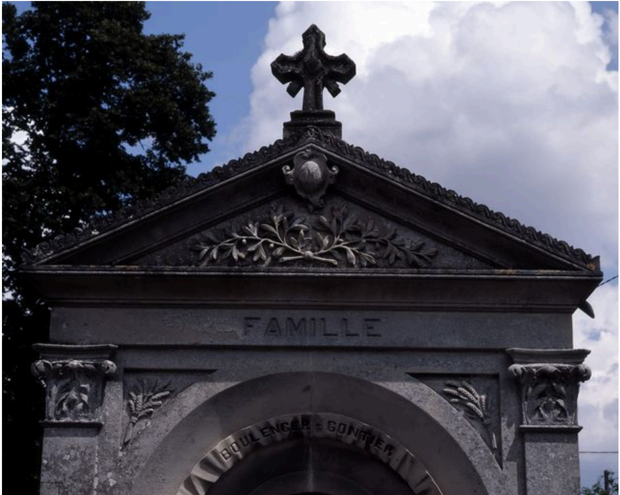
Détail sur le fronton.