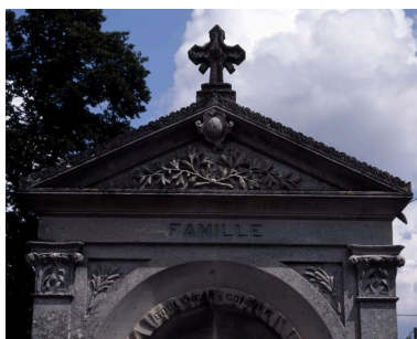
Détail sur le fronton.

IVR22_20078000240XA