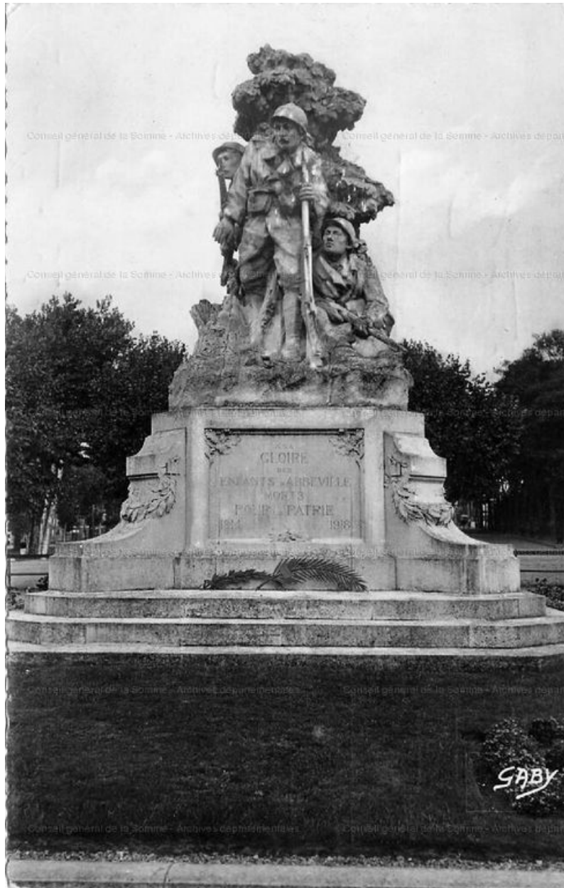
Vue du monument, avant 1939 (AD Somme ; 8Fi 5888).