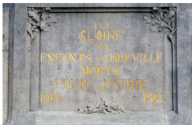
Détail de l'inscription avec décor de feuilles de chêne.