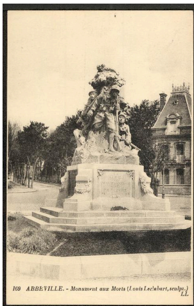
[légende + refdoc] (BM Abbeville ; fonds de cartes postales CP ABB 2-270). IVR32_20168005414NUCA