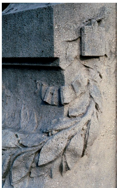
Détail du décor du socle : guirlande de laurier.