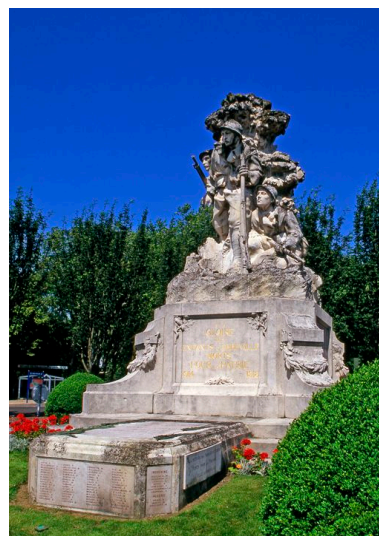
Vue de trois-quarts. IVR22_19948000310ZA