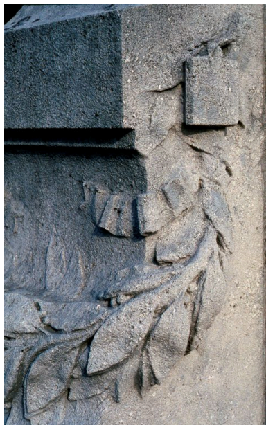
Détail du décor du socle : guirlande de laurier. IVR22_19948000396ZA