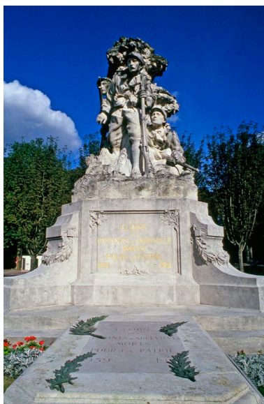
Vue rapprochée.