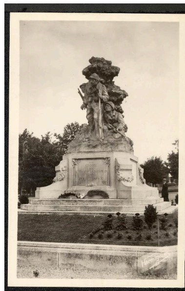
[légende + refdoc] (BM Abbeville ; fonds de cartes postales CP ABB 2-272).