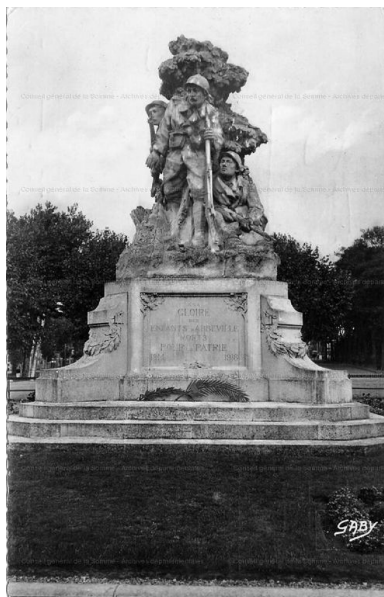
Vue du monument, avant 1939 (AD Somme ; 8Fi 5888). IVR22_20118005005NUCA