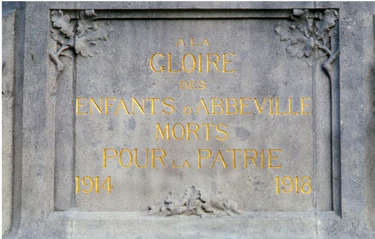
Détail de l'inscription avec décor de feuilles de chêne.