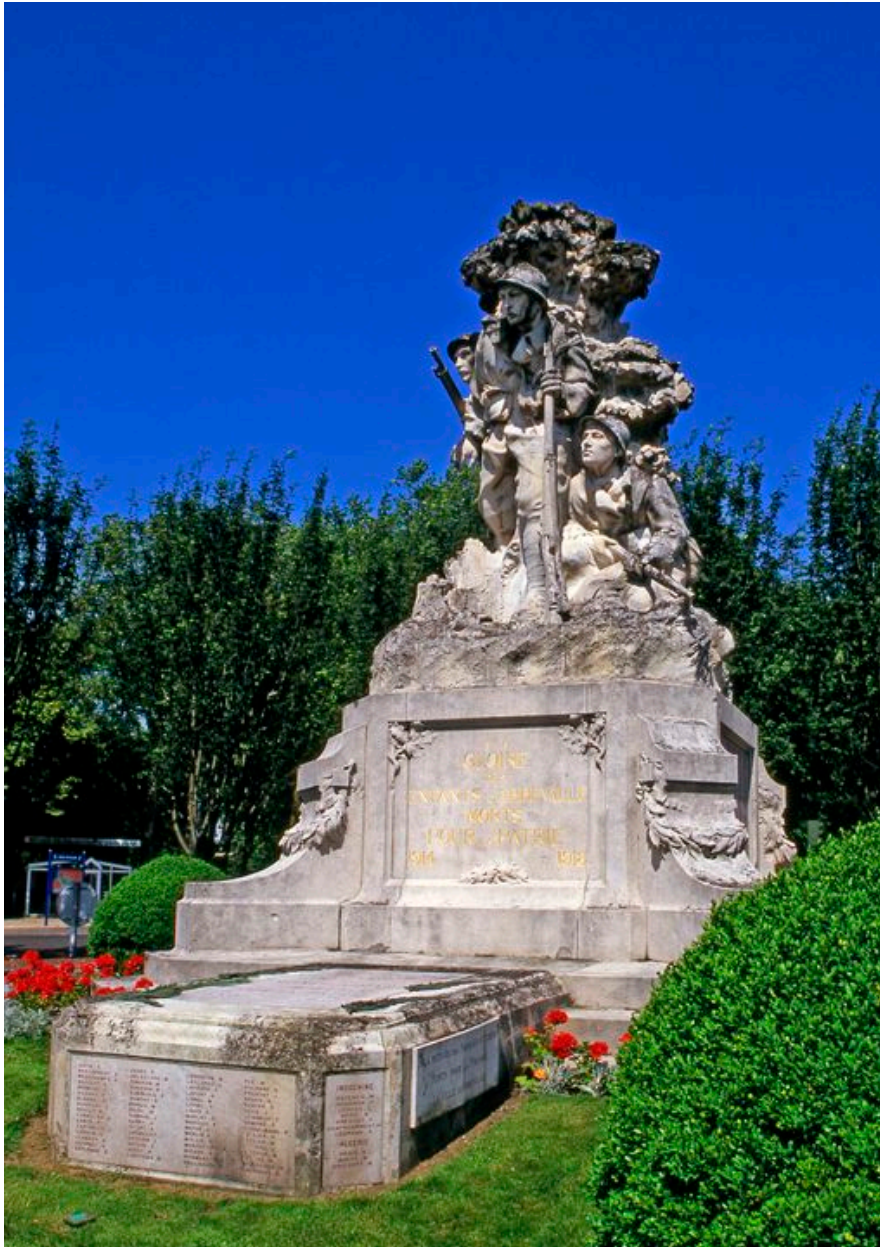
Vue de trois-quarts.