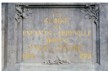
Détail de l'inscription avec décor de feuilles de chêne.