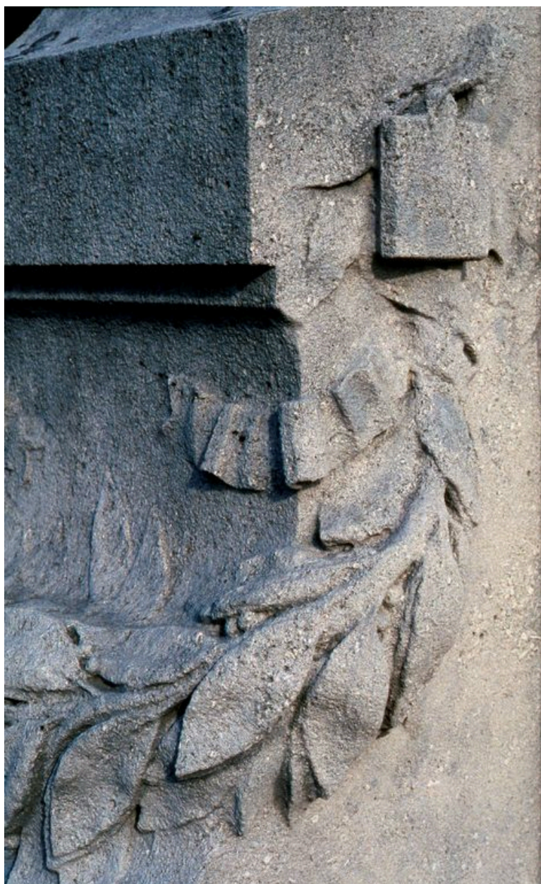
Détail du décor du socle : guirlande de laurier.