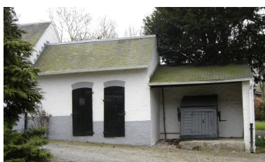
Vue des étables à cochons et du puits.