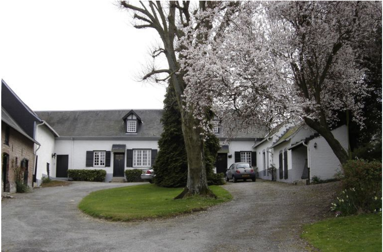
Vue depuis l'intérieur de la cour avec le logis dans le fond.