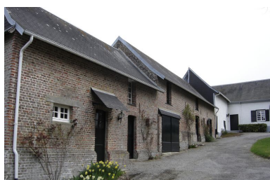
Vue de l'ensemble des bâtiments situés au nord-est de la cour avec le logement de l'employé de ferme au premier plan.