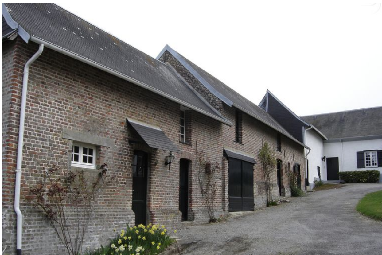
Vue de l'ensemble des bâtiments situés au nord-est de la cour avec le logement de l'employé de ferme au premier plan.