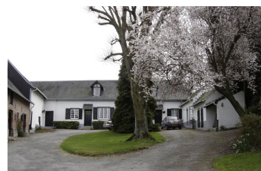
Vue depuis l'intérieur de la cour avec le logis dans le fond.