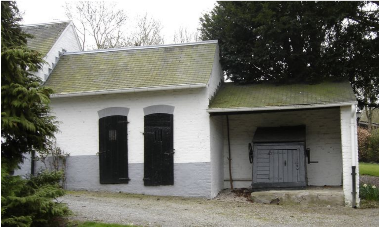
Vue des étables à cochons et du puits.