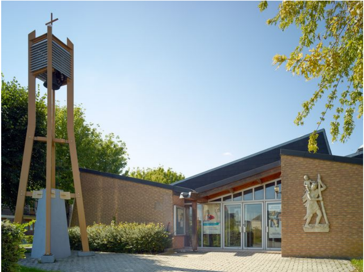
Élévation principale côté est, parvis avec son clocher.