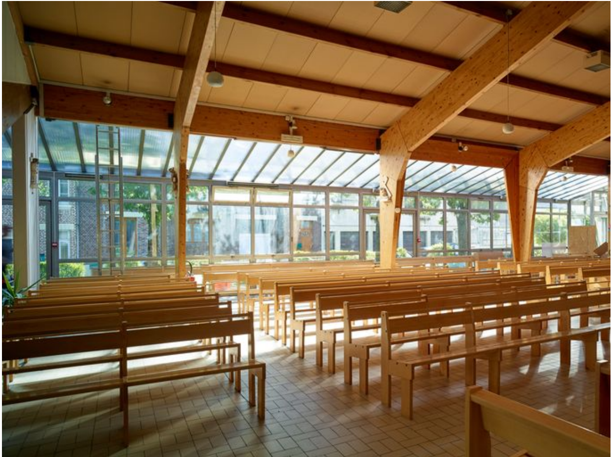
Vue de l'espace central vers le sud, depuis le chœur.