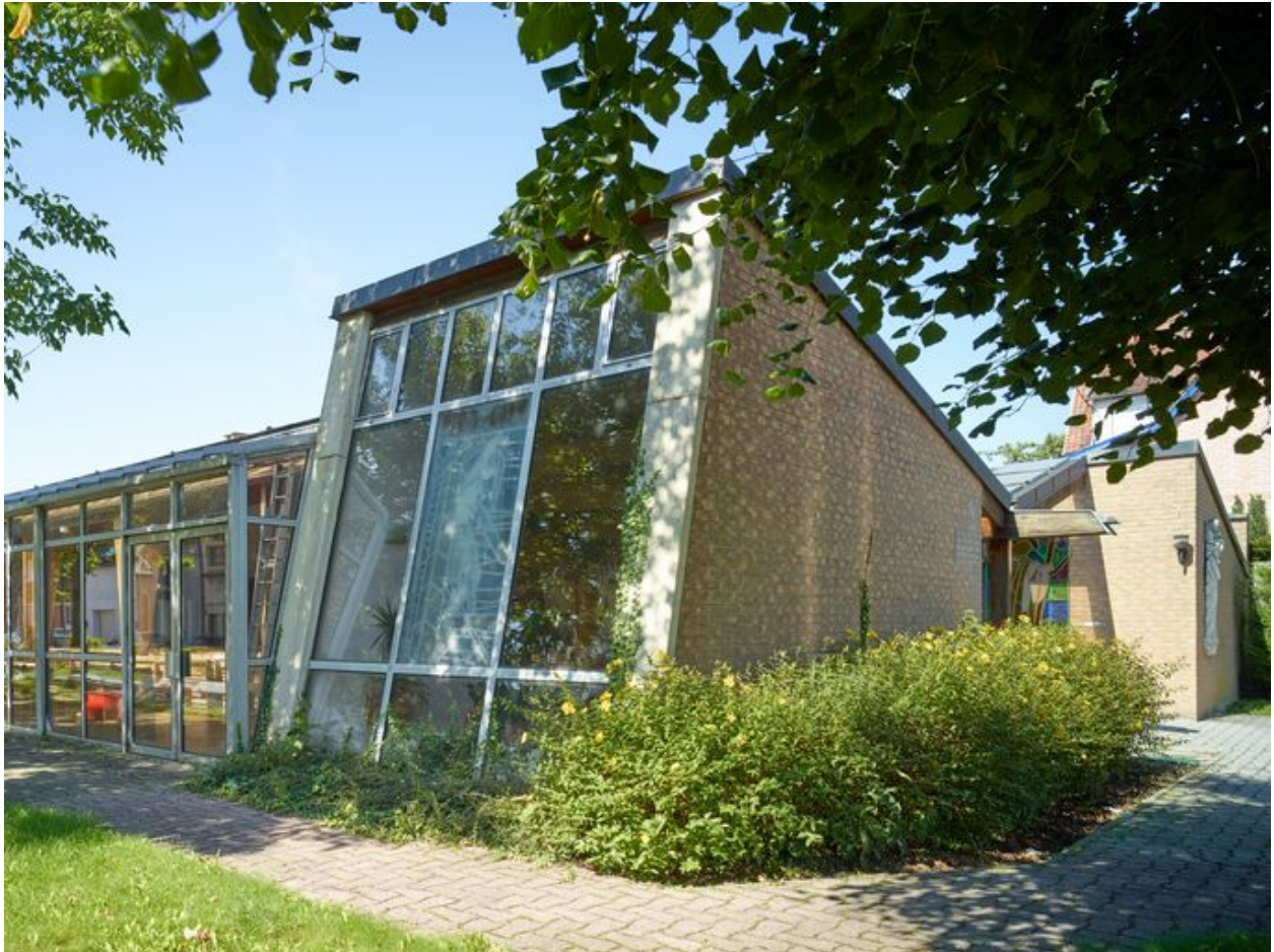
Élévation de trois quart, côté sud et est.