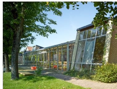
Élévation de trois quart, côté sud.