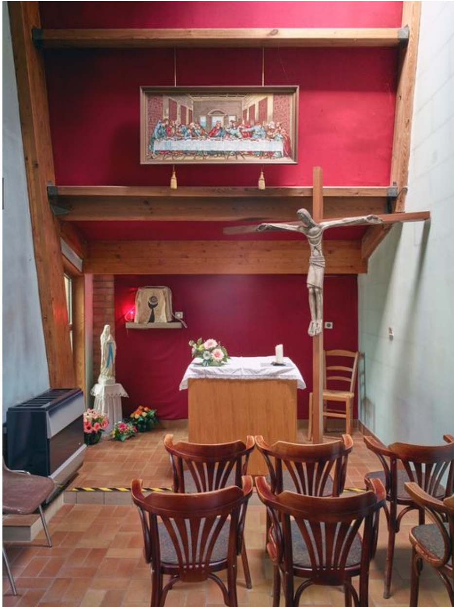
Vue de la chapelle.