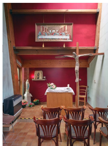
Vue de la chapelle. IVR31_20156200217NUCA