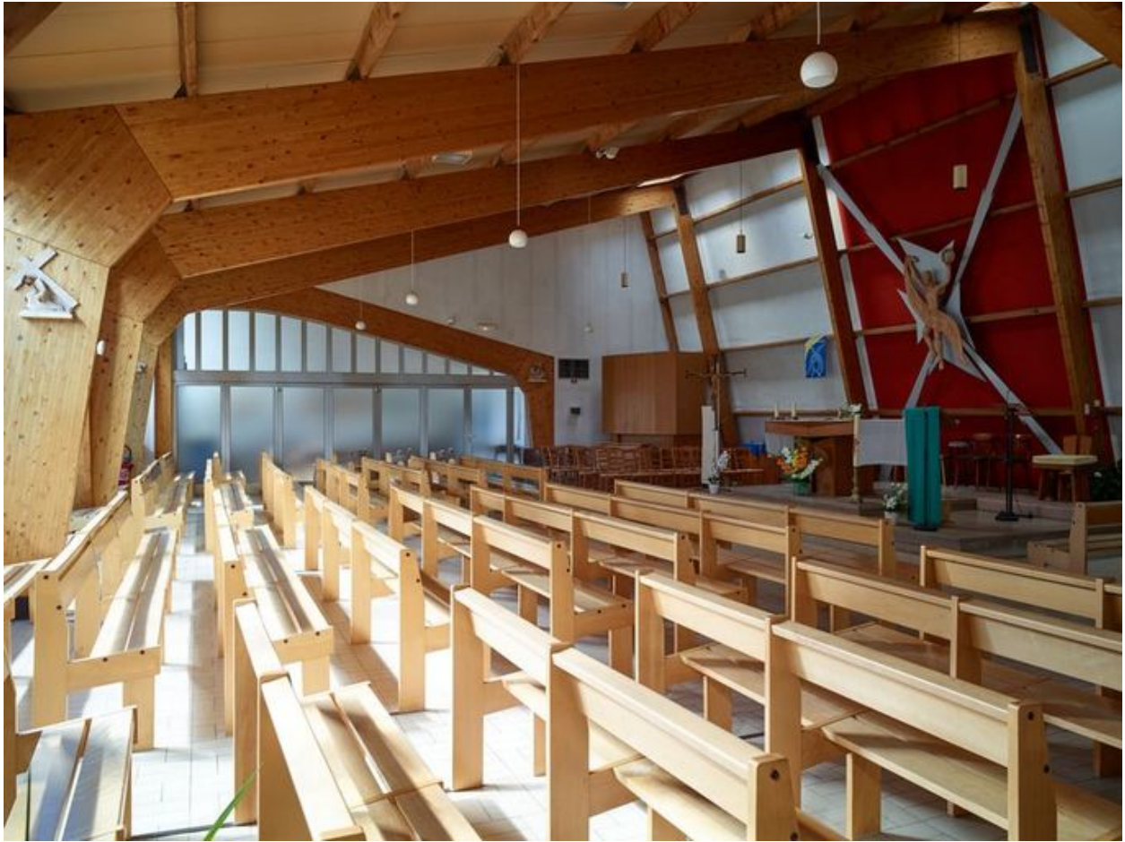
Vue de l'espace central vers l'ouest.