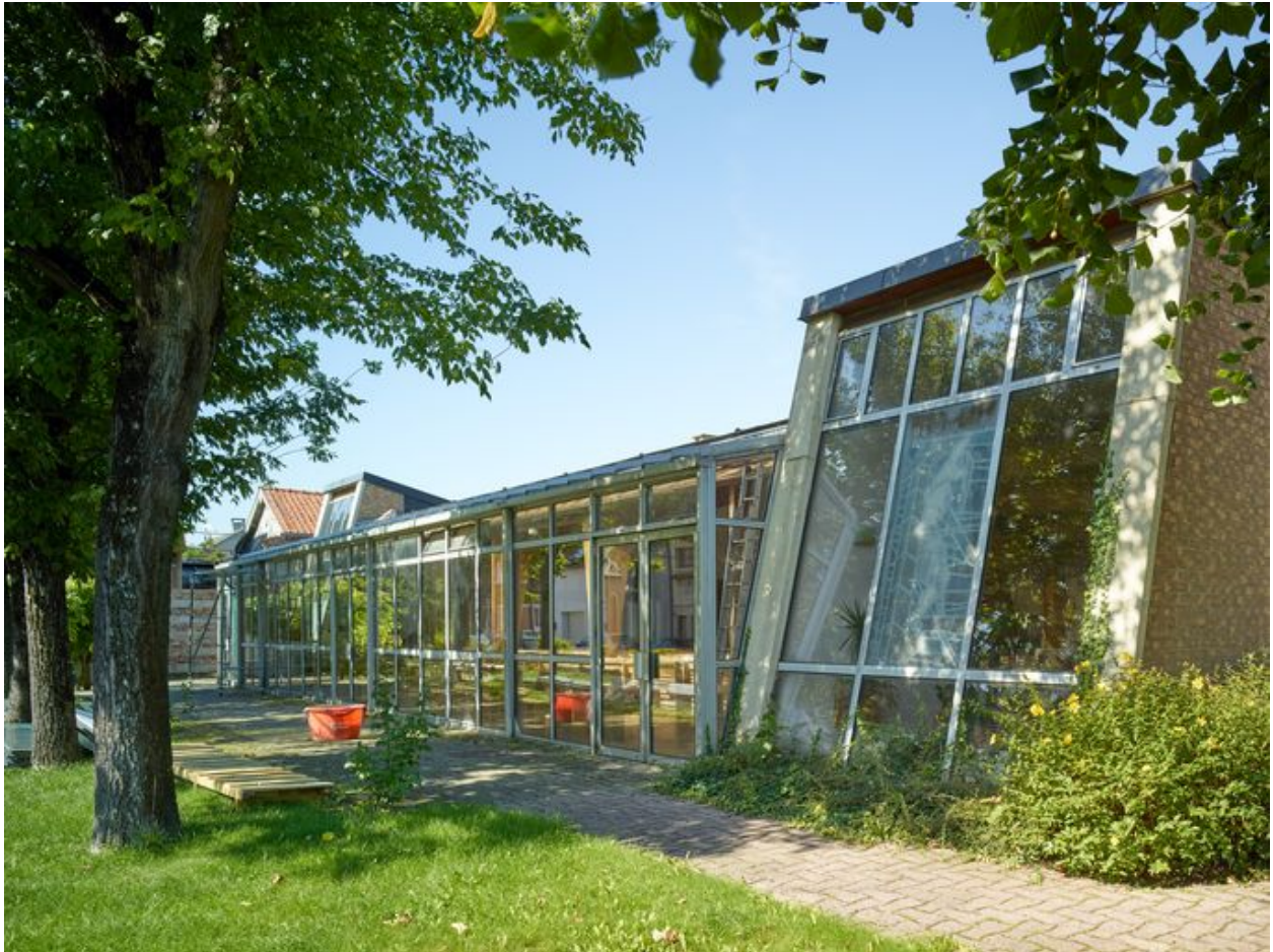
Élévation de trois quart, côté sud.