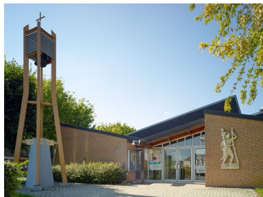
Élévation principale côté est, parvis avec son clocher. IVR31_20156200212NUCA